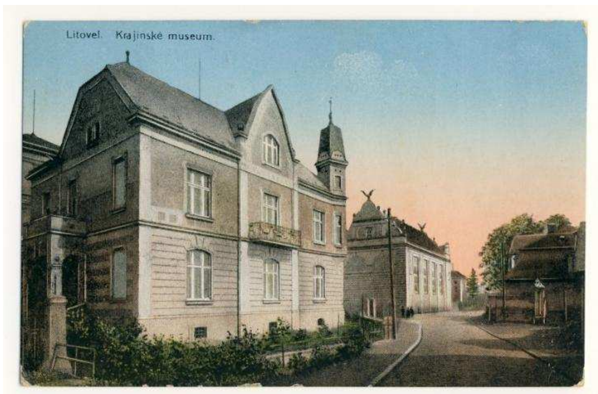
Příloha č. 7: Sochova vila na pohlednici z roku 1915 447