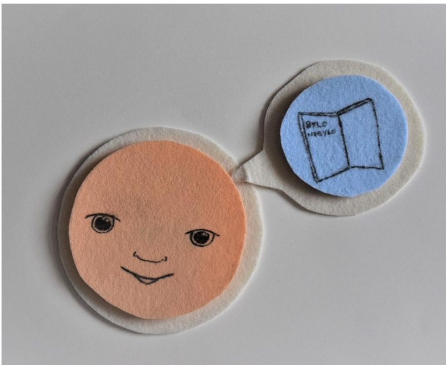
Obrázek č.4