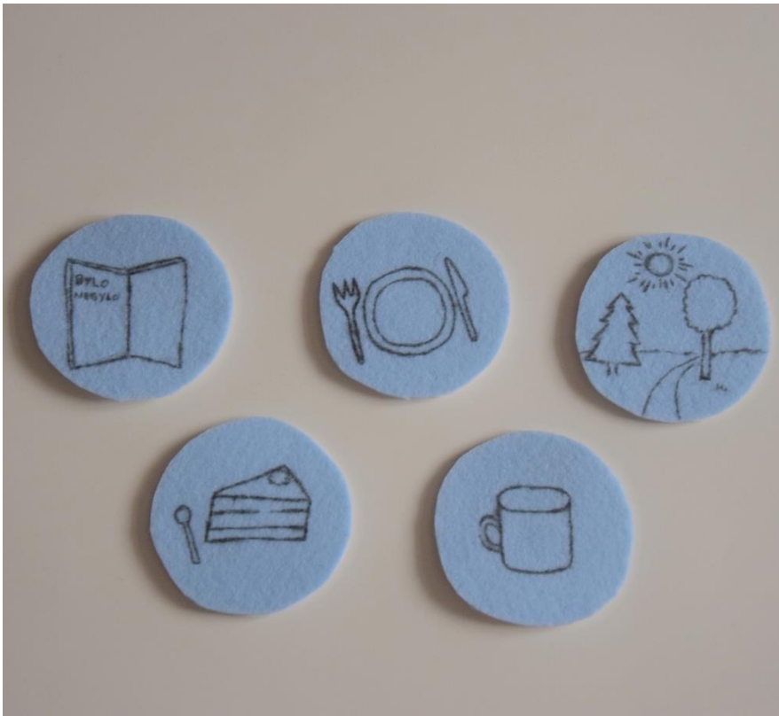
Obrázek č.3