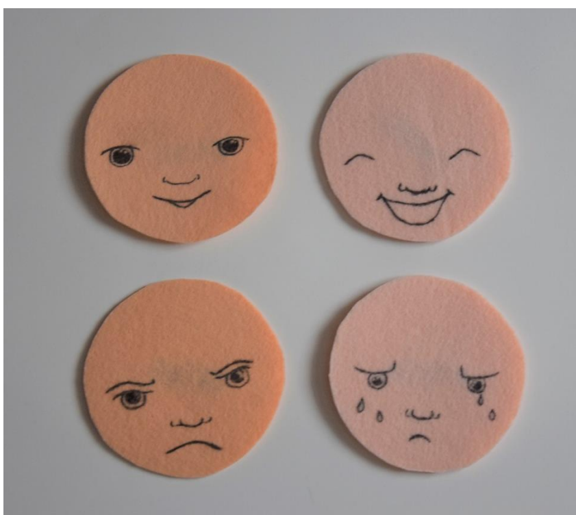
Obrázek č. 2