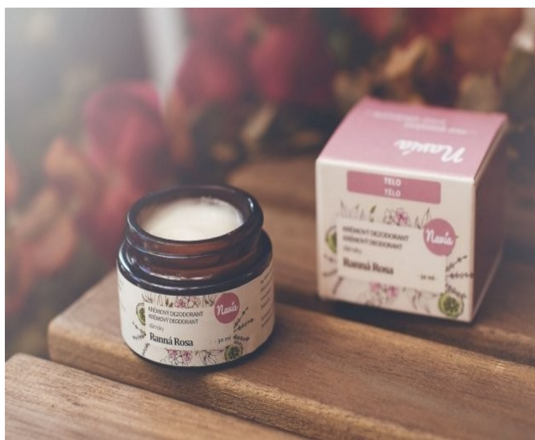
Obrázek č. 24 — Krémový deodorant Ranná rosa Navia (Deáková, 2019)

Světový den nemocných je založen převážně na náboženství, a právě proto se v rámci oslav půjde do kostela na mši. Ještě před touto akcí bude žákům vysvětlen Světový den nemocných.