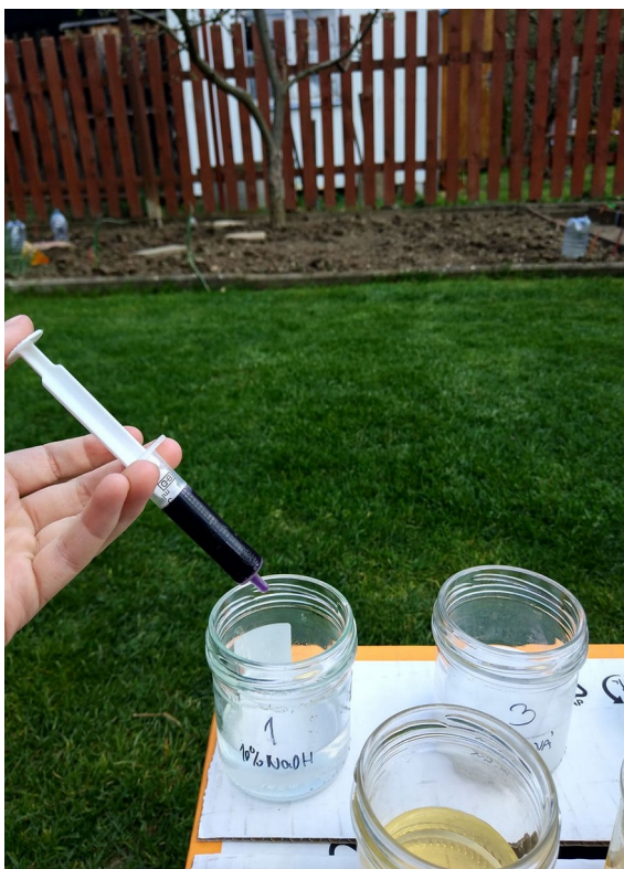
Obrázek č. VI — 2 — Aplikace indikátoru