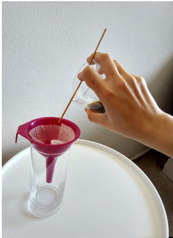
Obrázek č. 7 — Filtrace