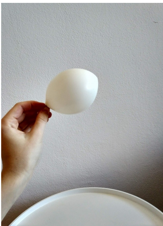
Obrázek č. V — 2 — Napuštěný balónek \text{CO}_2