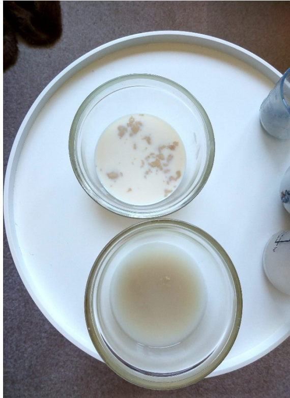
Obrázek č. 27 — Kvašení po jedné minutě