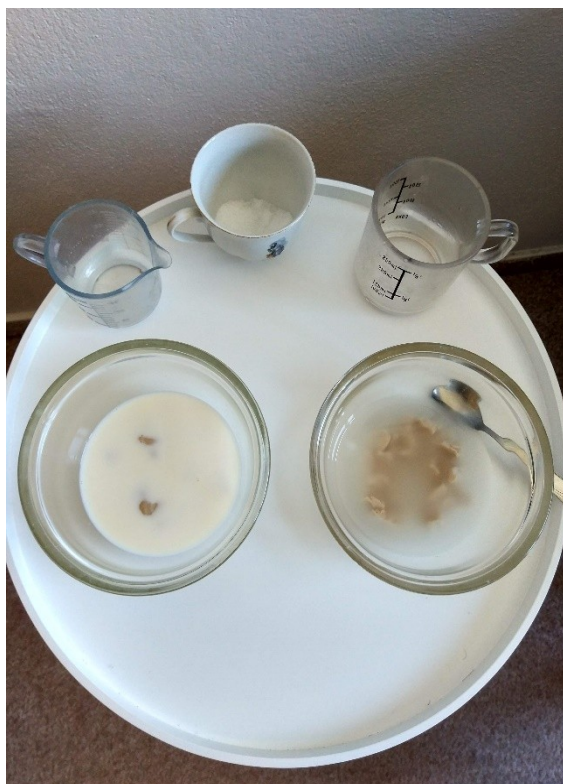
Obrázek č. 26 — Začátek kvašení