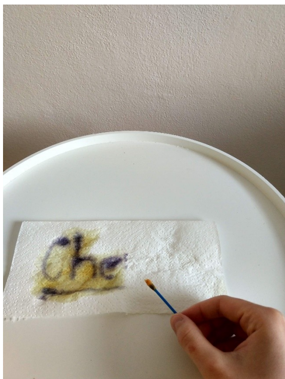
Obrázek č. 13 — Aplikace jodového roztoku