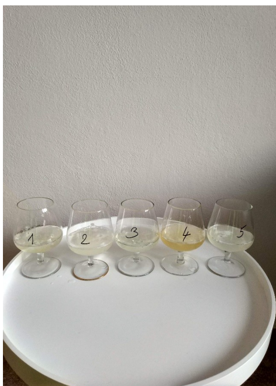
Obrázek č. VIII — 2 — Experiment po přidání chemikálií