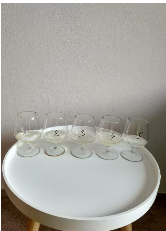
Obrázek č. 30 — Příprava na experiment — Bílkoviny