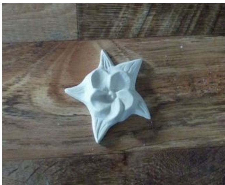
Obrázek č. 23 — Květina ze sádry (Kreativní tvoření, 2020)

Tento den byl zpracován ve formě projektu. Cílem tohoto projektu je, aby se probrala stavební pojiva a keramika jinou formou než klasickým výkladem učiva. V této projektové výuce rozdělí učitel žáky sám, aby skupiny byly vyrovnané. Žáci si mohou vybrat z těchto témat: sádra, vápno, malta, cement, beton a keramika. Několik skupin bude zpracovávat stejné téma. To záleží na tom, kolik žáků je ve třídě. Skupiny budou po 2-3 žácích. Na vypracování tématu budou mít 2 týdny. Každá skupina se pokusí sehnat své vybrané stavební pojivo a postaví z něho nějaký tvar. Žáci mohou využít tyto zdroje, např. webové stránky kreativní tvoření (Kreativní tvoření, 2020) (viz Obrázek č. 23) a knihu od Bláhové (Bláhová, 2017). Podle zkušeností, jak se žákům pracovalo se stavebním pojivem nebo keramikou, sepíší klady a zápory, které v rámci slavnosti vypíší na tabuli. Touto formou budou mít žáci celé téma Stavební pojiva a keramiku shrnuté a probrané. Během slavnosti tohoto významného dne se žáci budou moci zúčastnit přednášky, kterou povede Spolek Kruh, a tím se Den architektury oslaví.