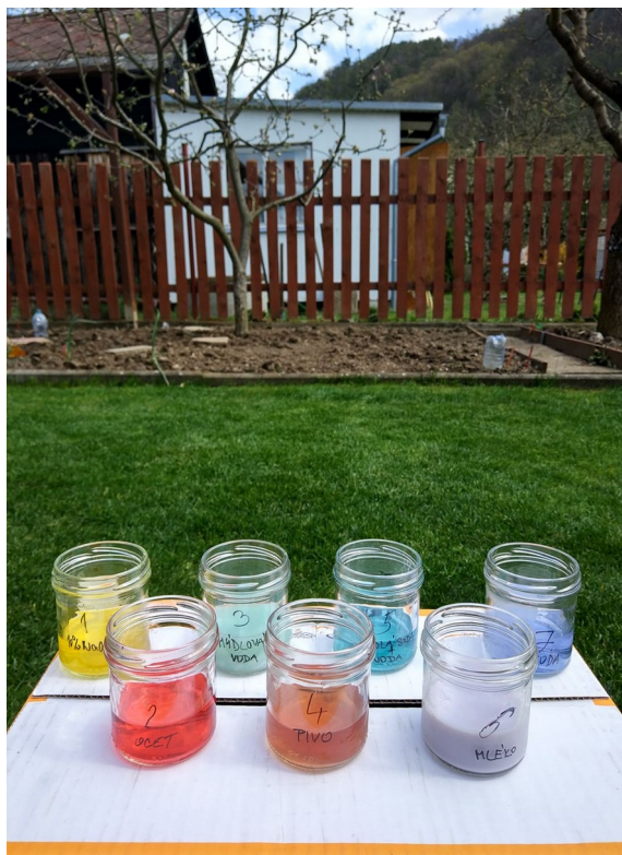
Obrázek č. 20 — Vzorke po přidání indikátoru