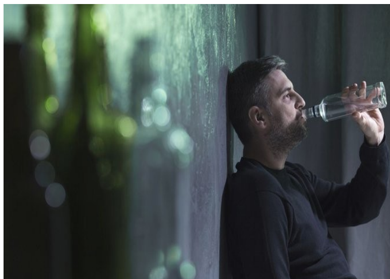
Obrázek č. 25 — Alkoholismus dokáže zcela zničit mezilidské vztahy (Moje zdraví, 2001-2020)