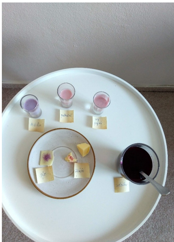
Obrázek č. 22 — Vzorke po přidání indikátoru