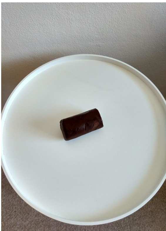
Obrázek č. 2 — Ztuhlá čokoládová směs