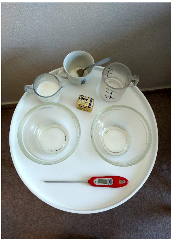
Obrázek č. VII — 1 — Suroviny potřebné k experimentu Sacharidy