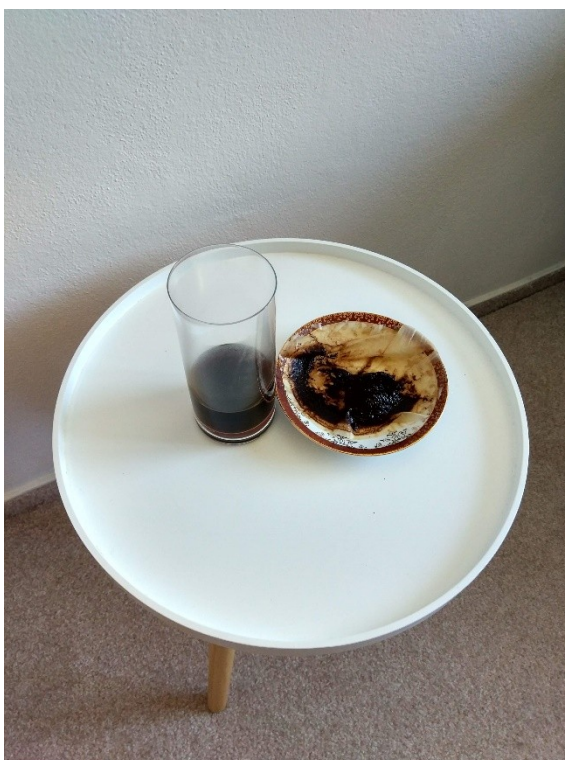
Obrázek č. II – 1 — Filtrační koláč