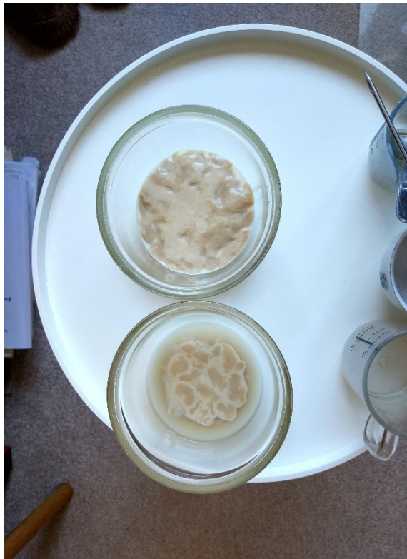
Obrázek č. 28 — Kvašení po pěti minutách