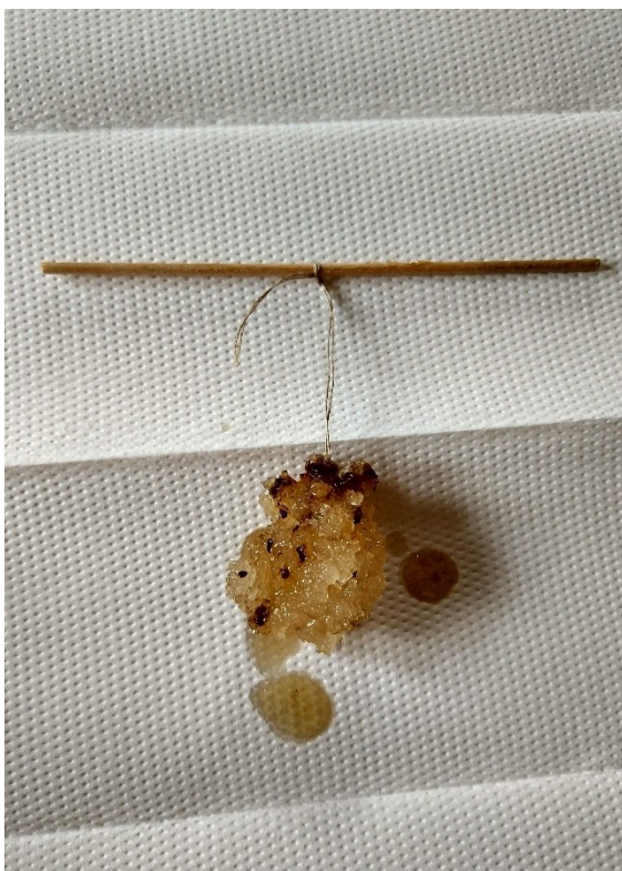
Obrázek č. 9 — Krystal z nasyceného roztoku