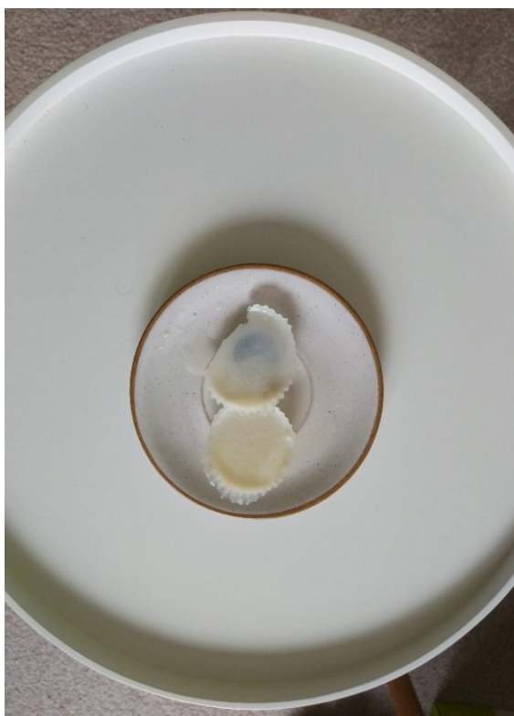
Obrázek č. 35 — Vyrobené mýdlo