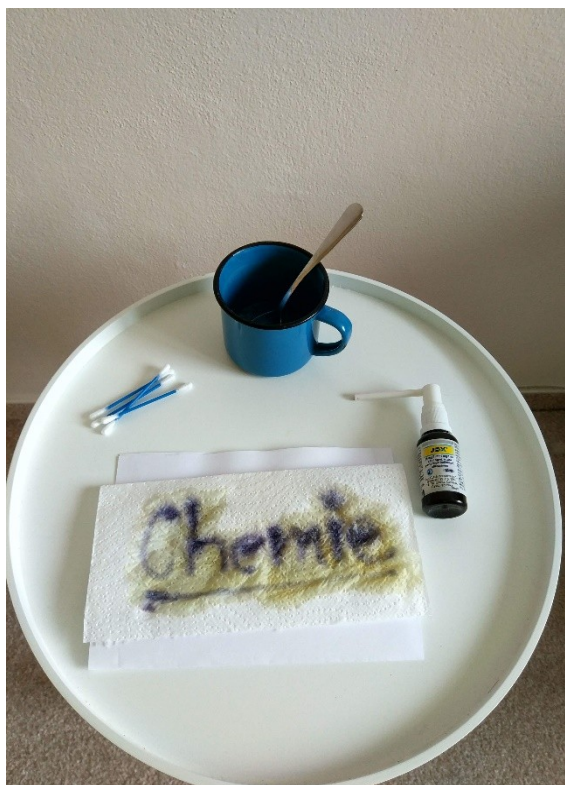
Obrázek č. 12 — Suroviny na experiment „tajné písmo“