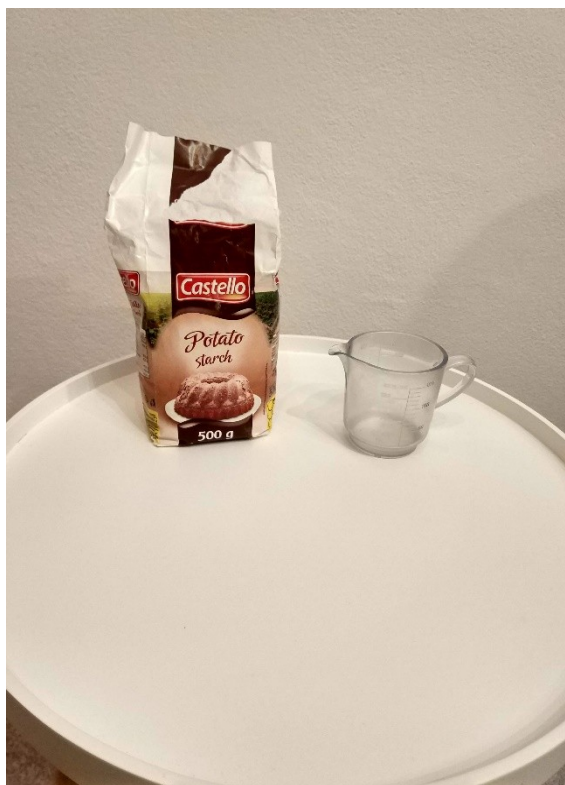
Obrázek č. III — 1 — Suroviny potřebné na škrobový maz