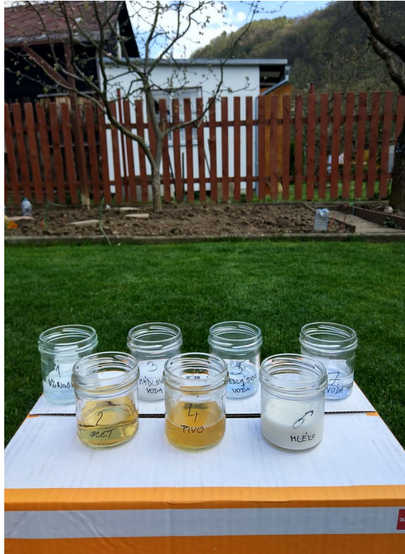
Obrázek č. 19 — Vzorke před přidáním indikátoru