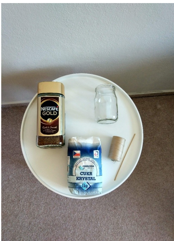
Obrázek č. II — 2 — Suroviny potřebné na krystalizaci