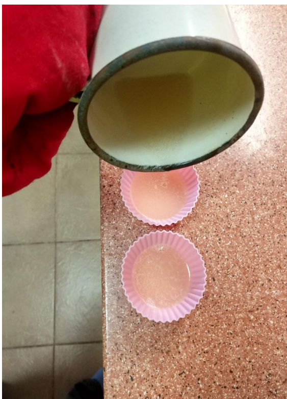
Obrázek č. 34 — Výroba mýdla