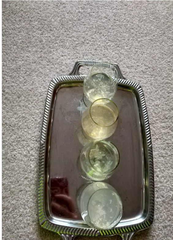
Obrázek č. 31 — Denaturace bílkovin