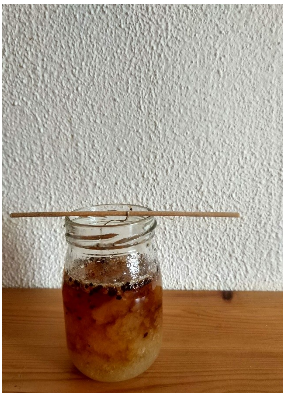
Obrázek č. 8 — Krystalizace roztoku cukru s kávou