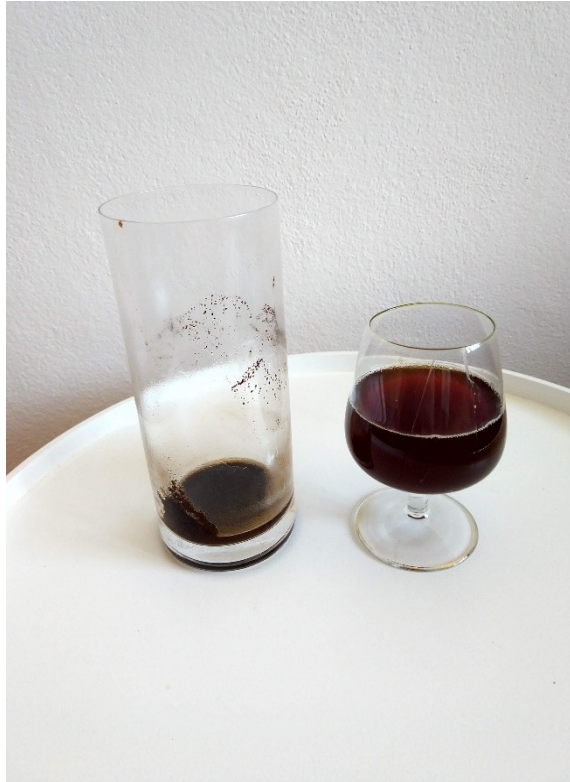
Obrázek č. 5 — Dekantace směsi kávy