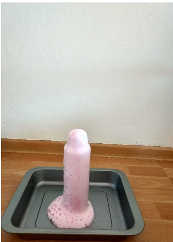
Obrázek č. 15 — Experiment „sopka“