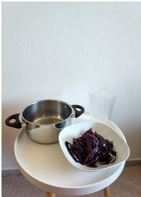
Obrázek č. 18 — Příprava indikátoru