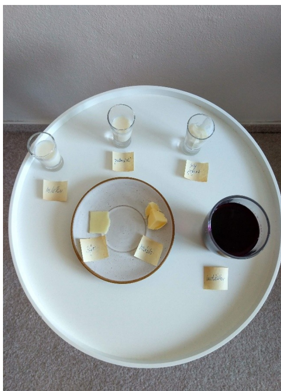
Obrázek č. 21 — Vzorke před přidáním indikátoru