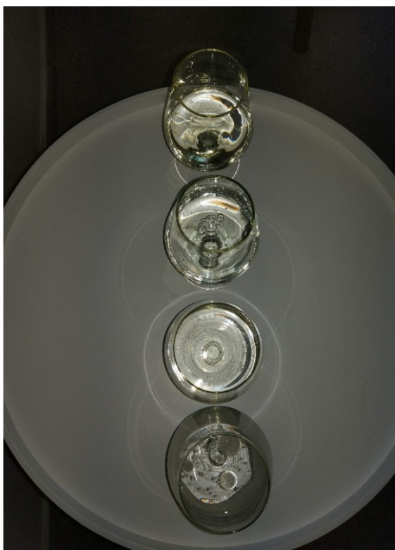
Obrázek č. 33 — Provedený experiment — Tuky