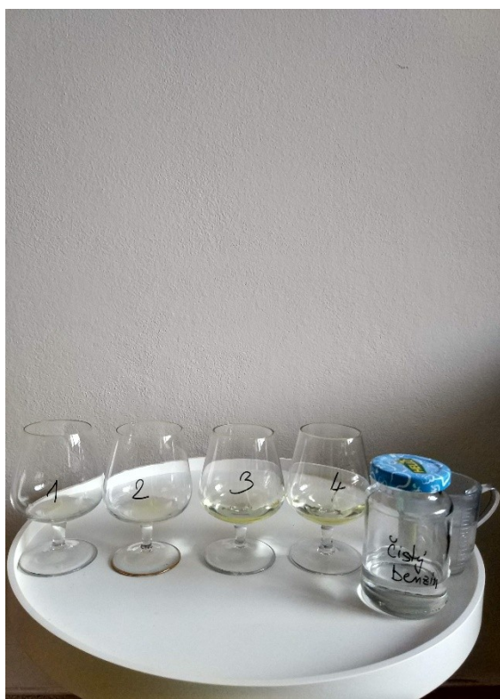
Obrázek č. 32 — Příprava na experiment — Tuky