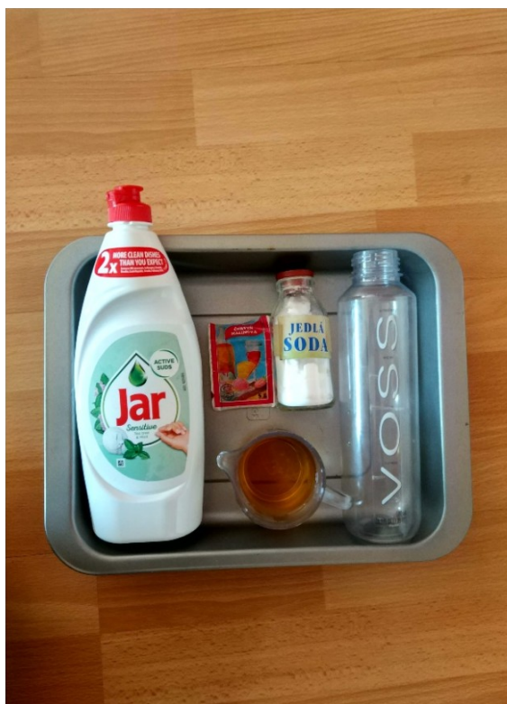
Obrázek č. 14 — Suroviny k provedení experimentu „sopka“