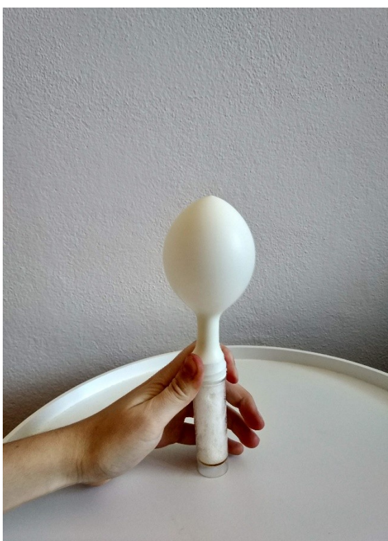
Obrázek č. 17 — Probíhající experiment