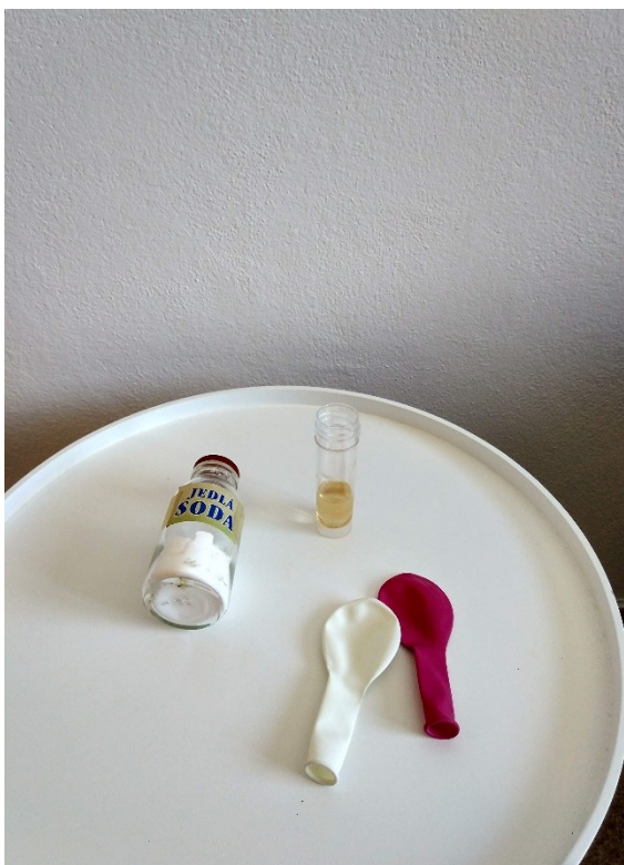
Obrázek č. V — 1 — Suroviny a pomůcky potřebné k experimentu Důkaz \text{CO}_2