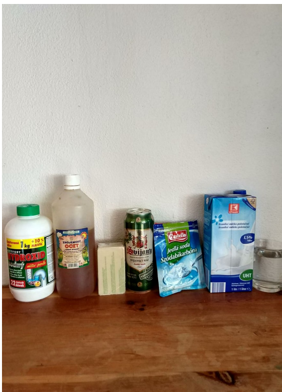
Obrázek č. VI — 1 — Vybrané suroviny pro experiment Koktejl