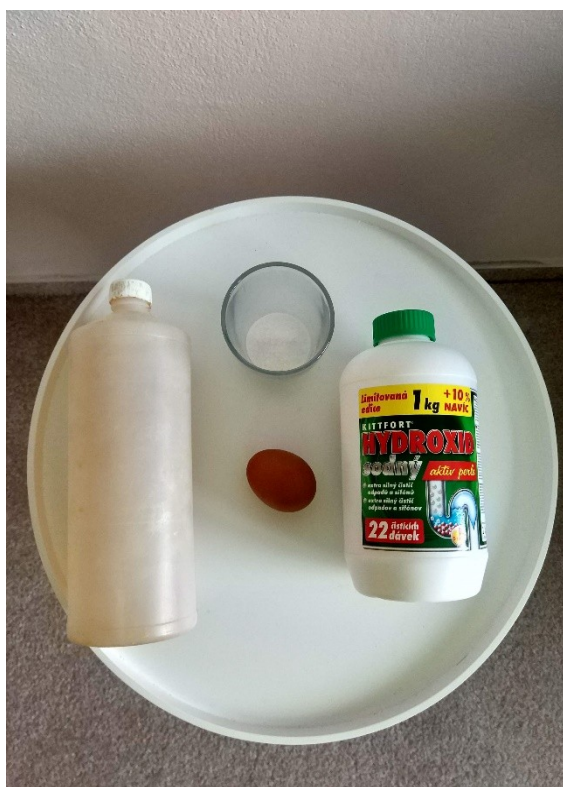
Obrázek č. VIII — 1 — Suroviny potřebné k experimentu Bílkoviny