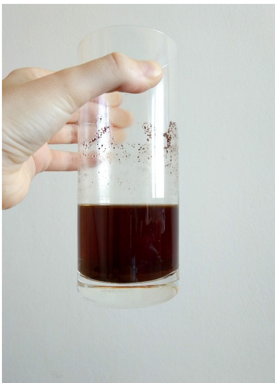
Obrázek č. 4 — Usazování směsi kávy