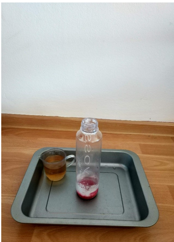
Obrázek č. IV — 1 — Příprava na experiment „sopka“