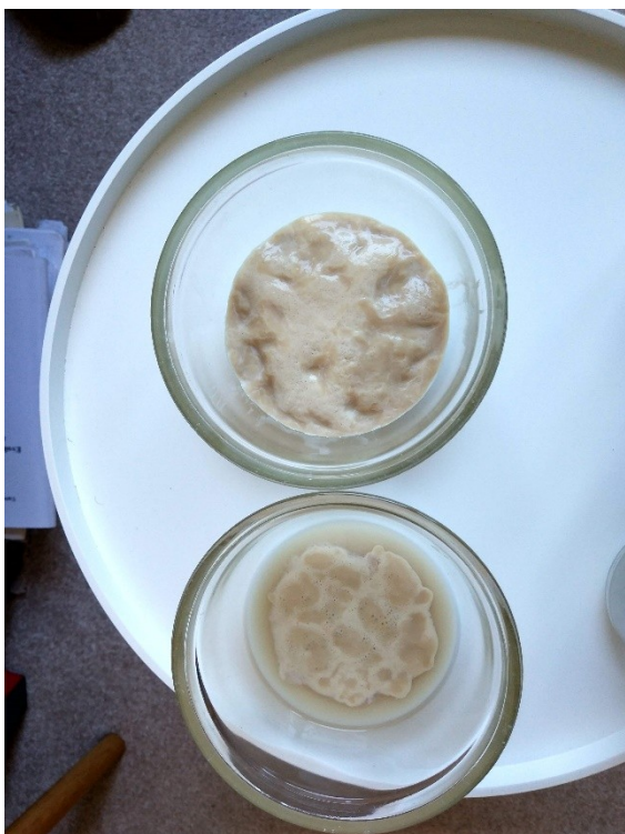
Obrázek č. 29 — Kvašení po deseti minutách