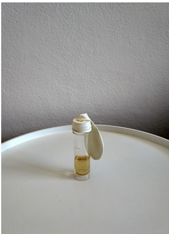
Obrázek č. 16 — Příprava experimentu: Důkaz oxidu uhličitého