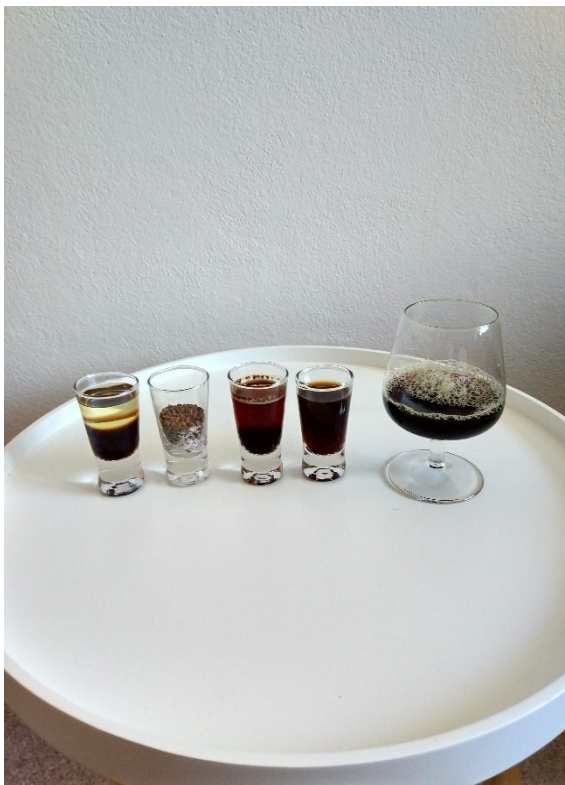
Obrázek č. 3 — Vzorky kávových směsí