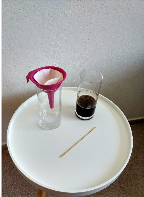
Obrázek č. 6 — Improvizovaná domácí „filtrační aparatura“