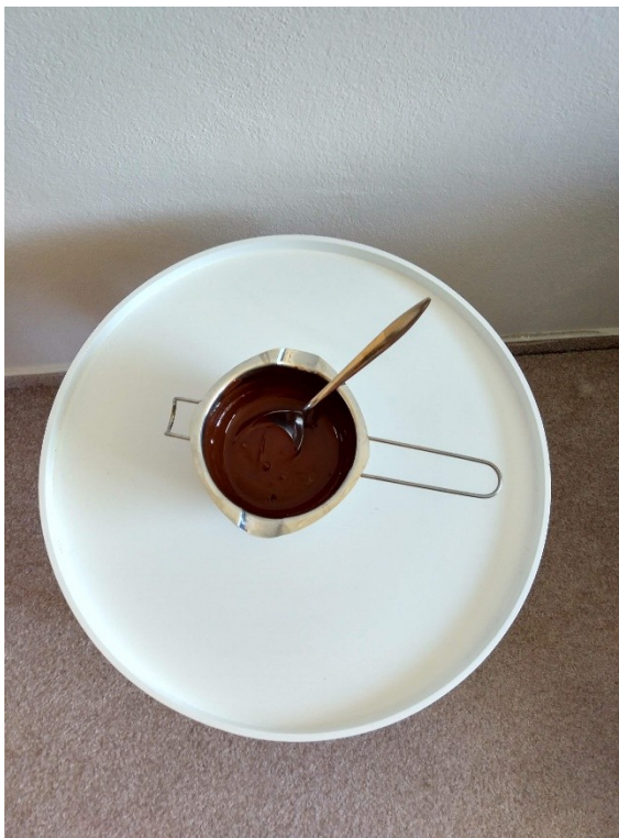
Obrázek č. I —1 — Rozpuštěná čokoláda