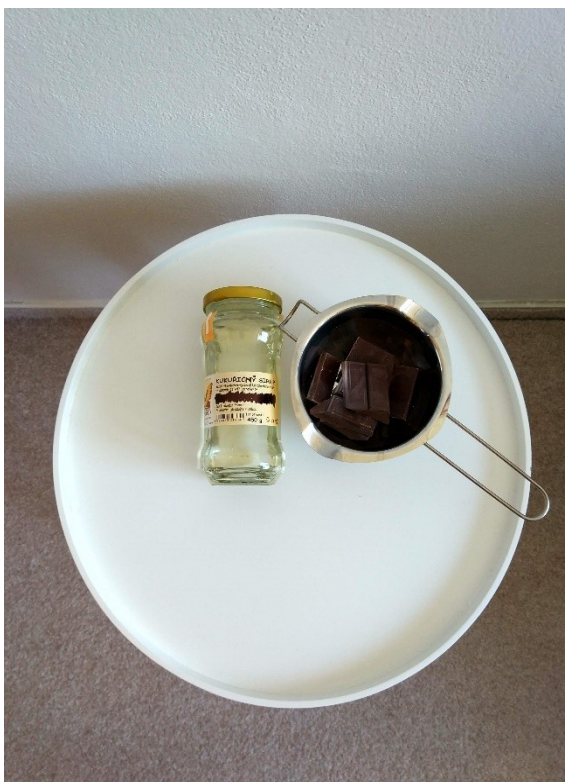
Obrázek č. 1 — Suroviny na experiment s čokoládou