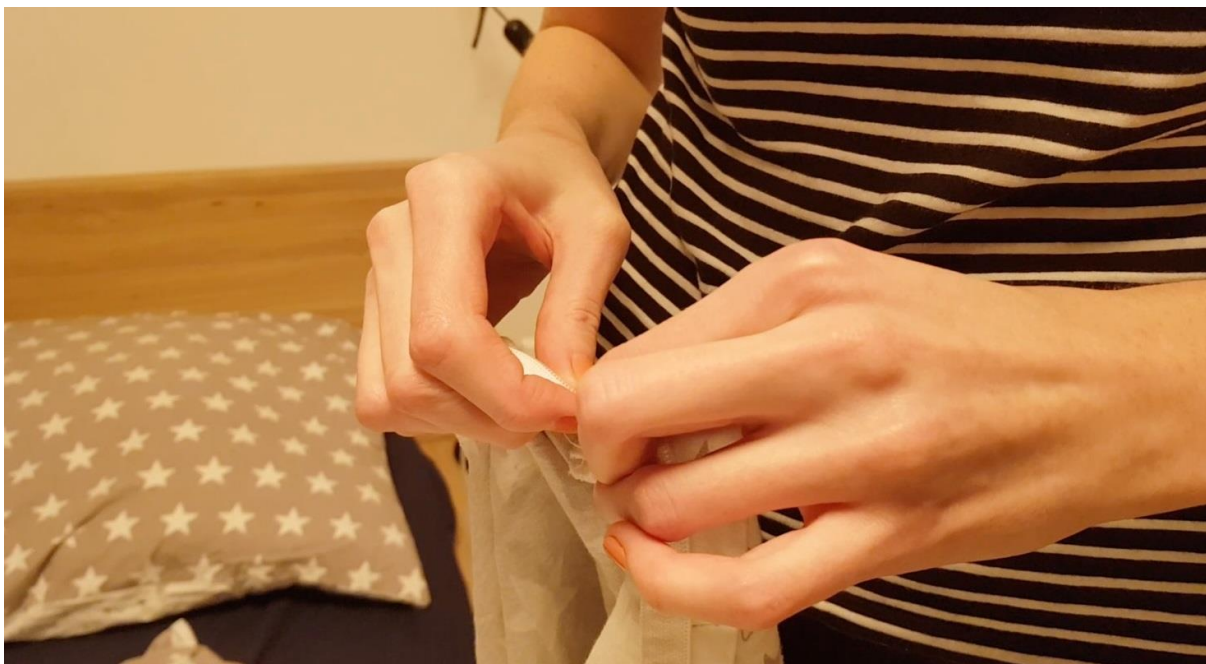
Vyjetý zip, ze série Domov jako místo rituálů, 2 min, 2019