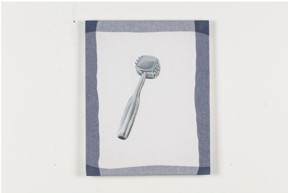
Palička na maso, olejomalba na utěrce, 50 x 40 cm, 2019