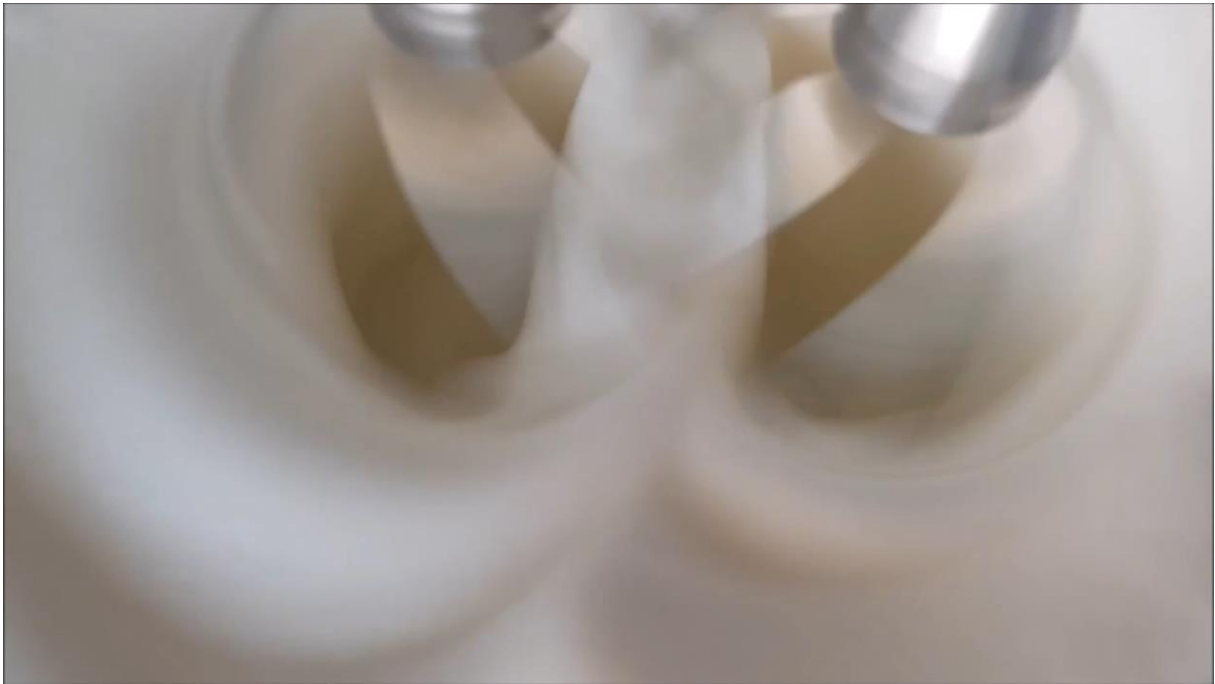
Šlehání bílků, ze série Domov jako místo rituálů, 0.48 min, 2019