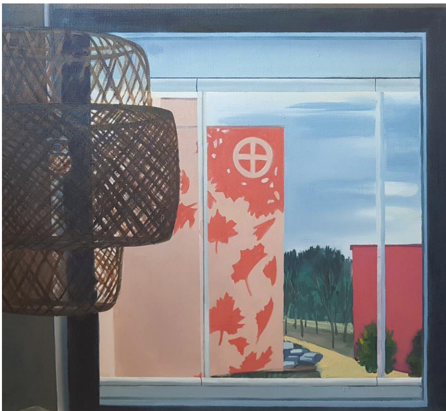
Lustr s výhledem, olejomalba na plátně, 100 x 90 cm, 2019