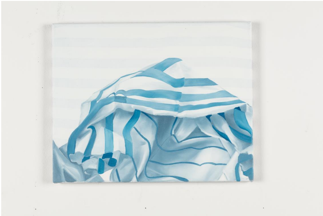
Utěrka, olejomalba na utěrce, 50 x 40 cm, 2018