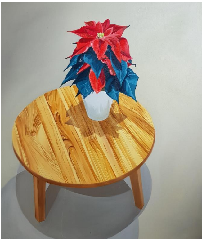
Vánoční hvězda, olejomalba na plátně, 120 x 100 cm, 2019