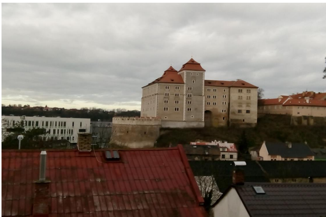
Obrázek 1 - Mladoboleslavský hrad

Konec 19. století a počátek 20. století přináší antisemitské bouře. Počet Židů v Mladé Boleslavi každým rokem klesal. Roku 1880 tvoří Židé ještě 9 % (851 osob) z celkového počtu obyvatel. V novém století, přesněji v roce 1900, se počet snížil na 4 % (560 osob) a devět let před začátkem 2. světové války klesl počet osob s židovským vyznáním na neuvěřitelné 1 % (264 osob). V porovnání s přelomem 17. a 18. století, kdy Židé tvořili 50 % obyvatel (800 osob), je číslo spjaté s 1. polovinou 20. století opravdu nízké. 39