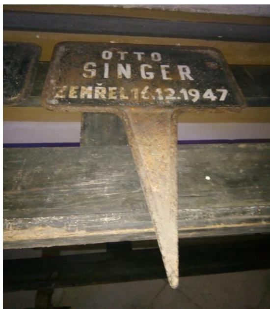
Obrázek 15 - Destička se jménem zemřelého

Poté následuje uložení těla do zcela obyčejné dřevěné prkenné rakve. Vykradači hrobů zcela jistě nebudou na židovském hřbitově slavit úspěch. Jako v jiných případech a rituálech se v případě Židů neukládají do rakve ani do hrobu žádné cenné předměty. Smuteční slova rabína pak doprovází spuštění dřevěné rakve do, v ten den přichystaného, hrobu. Další fází je jedenáctiměsíční nucený smutek a s tím spojené nezasahování do zasypaného hrobu zemřelého. Aby byly tyto měsíce striktně dodrženy a nedošlo k omylu, přikládá se k hrobu železná destička se jménem a datem úmrtí.