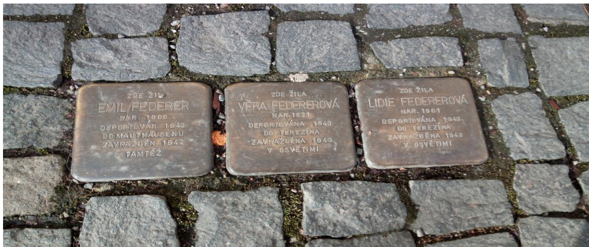
Obrázek 17 – Stolpersteine

Významnou událostí spojenou s připomínkou mladoboleslavských obyvatel transportovaných do koncentračních táborů je zcela jistě projekt Stolpersteine. Místa, jako právě Mladá Boleslav a Debř, se stali společně s nespočtem míst Evropy součástí programu, který podporuje vkládání krychlových kamenů do chodníků z dlažebních kostek před domy deportovaných Židů. Kameny jdou specifické vyraženým jménem členů židovských rodin, kteří v daném domě žili, jejich datum narození a úmrtí. Uvedeno je také místo skonu.