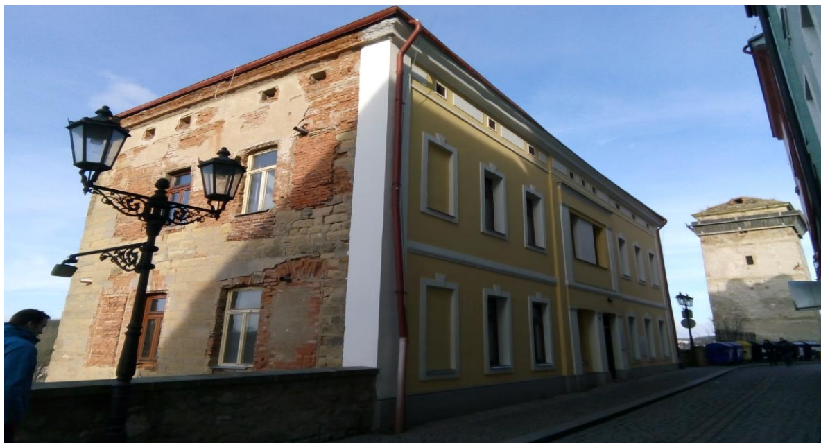
Obrázek 10 - Židovská škola