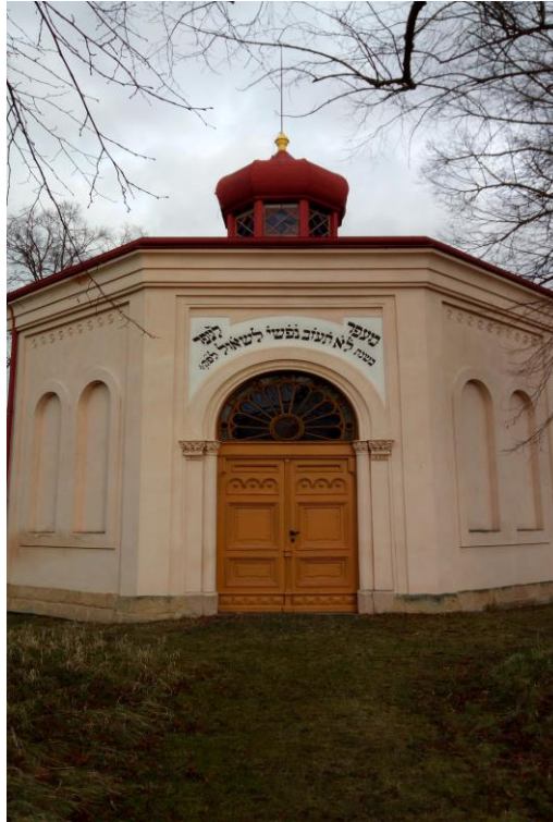
Obrázek 11 - Obřadní síň