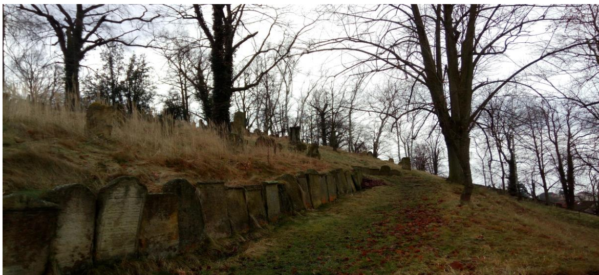
Obrázek 5 - Židovský hřbitov

Náhrobky jsou význačné především nápisy, převážně hebrejskými, které znázorňují velké množství informací. Ať už je to jméno zemřelého, jeho otce či u žen jméno jejich manžela. Na každém náhrobku nechybí ani den úmrtí, tedy i zároveň den pohřbu a povolání zemřelého. Některé obsahují také epitaf pozůstalých. 42 Kytice, které jsou symbolem vzpomínky příbuzných, na židovském hřbitově nenalezneme. Zde zármutek a vzpomínku představují kamínky položené na nebo u náhrobků zemřelého. V roce 1820 probíhá výstavba silnice v oblasti židovského hřbitova. Velmi nešetrným způsobem bylo zacházeno s náhrobky mrtvých. Některé posloužily jako stavební materiál, jiné byly poposunuty o několik metrů dále.