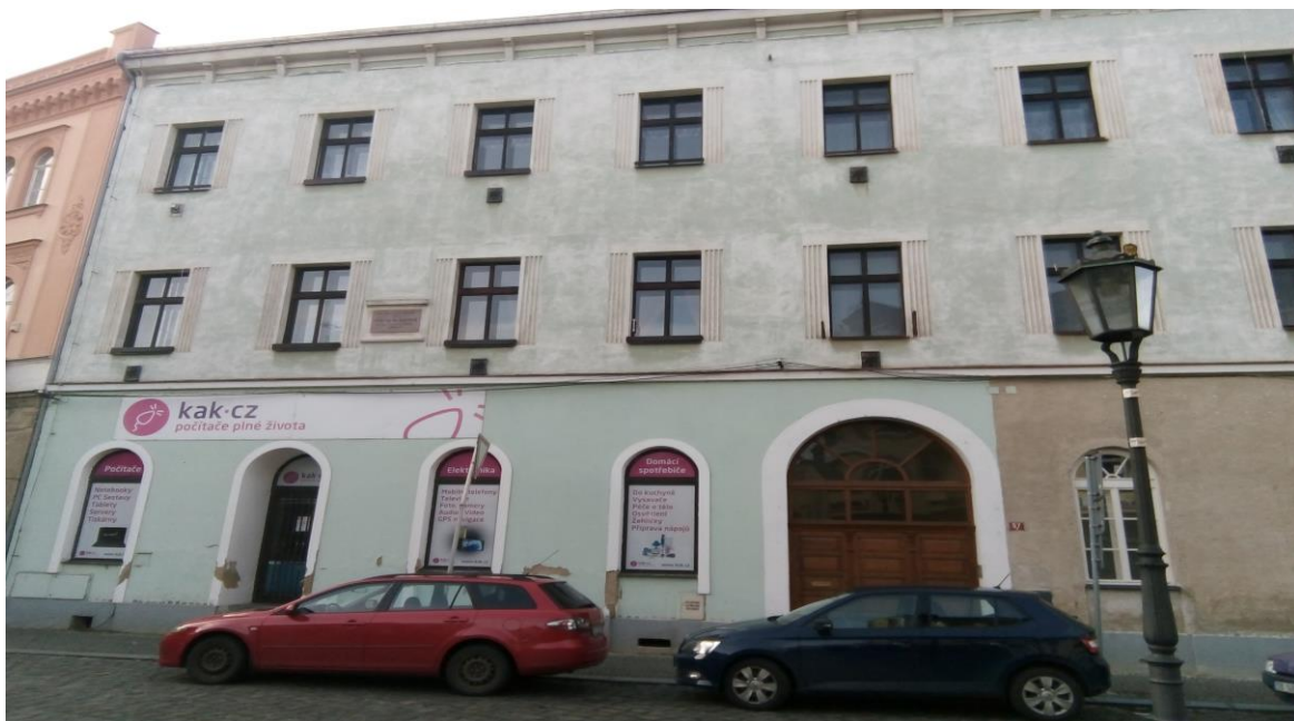
Obrázek 2 - Dům Siegfrieda Kappera