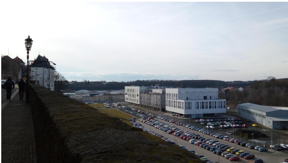
Obrázek 8 - Škoda Auto (technický vývoj)