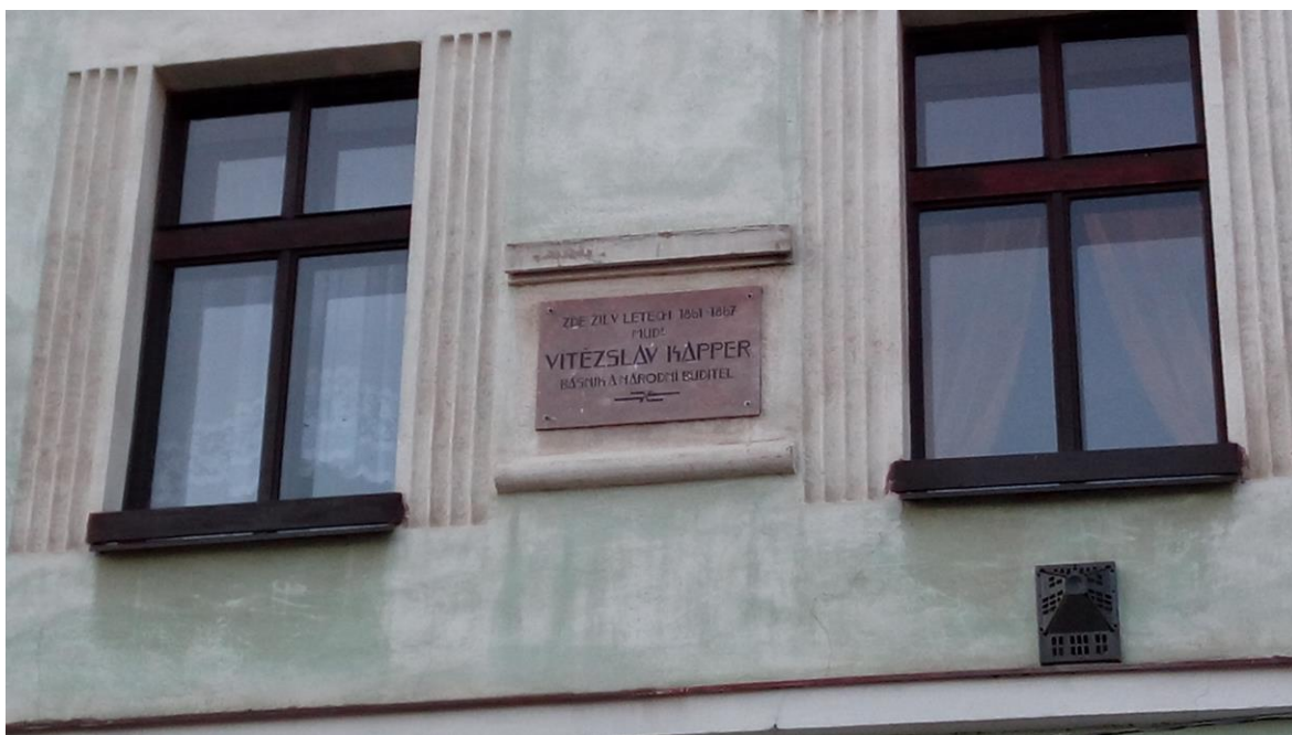
Obrázek 3 - Pamětní deska na době Siegfrieda Kappera