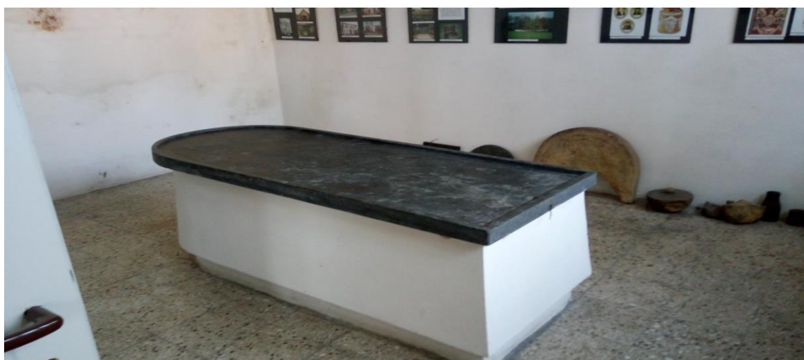
Obrázek 14 - Prostory márnice