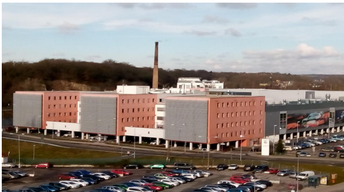
Obrázek 9 - Škoda Auto (Česana)

a 8 000 sdužovacích. 48 Důležitým pohonem se stalo 8 parních kotlů a dalších 5 parních strojů o obrovské síle 1830 HP. Tento podnik byl důležitým zaměstnavatelem, jež nabízel místa pro 2000 osob. V období poloviny 20. století zasahuje podnik stejný osud jako Ledererův lihovar. Mladoboleslavská automobilka zde staví další budovy, tentokrát technologické centrum. Zachoval se však název, který se prostřednictvím zaměstnanců automobilky a obyvatel Mladoboleslavska předává z generace na generaci. Pojem Česana, jež přikládá důraz na dříve fungující a prosperující přádelnu česané příze v tomto místě, je posledním přeživším článkem upozorňujícím na věhlas bývalého Klingerova komplexu.