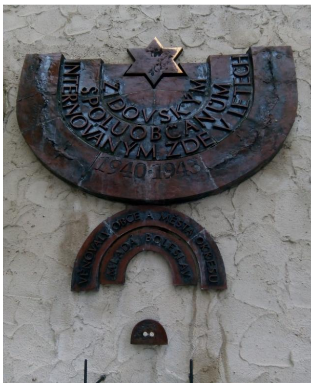
Obrázek 16 - Pamětní deska na mladoboleslavském hradě