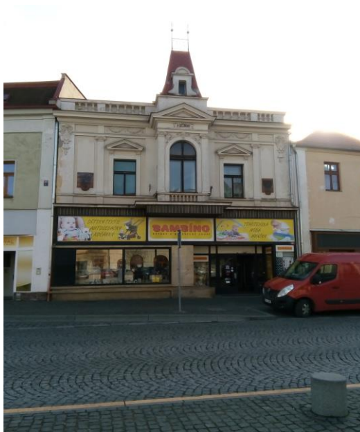
Obrázek 6 - Dům Františka Gellnera

Jak již bylo řečeno v úvodu kapitoly, teprve s koncem 18. století a s 19. stoletím přichází doba, kterou židovští obchodníci využili více než kdokoli jiný. S rokem 1848 nastává uvolnění obchodu a možnost provozování vlastních soukromých živností. V Mladé Boleslavi se židovští obyvatelé začínají věnovat převážně oblastem jako je například prodej a výroba textilu či potravin. Budovali se nové galanterie a železářství. Rozmach jejich obchodů byl opravdu značný a pružnost židovských podnikatelů opravdu unikátní. Rozlehlé podniky a společnosti vznikaly na okraji města u řeky Jizery v oblasti zvané Podolec a Pták. Menší soukromé obchůdky provozovali v přízemí svých domů na Starém městě. Právě Staré město v té době, stejně jako v době dnešní, hýřilo obchody či krámkami s jakýmkoliv zbožím. Židovští obchodníci se však v této oblasti věnovali převážně obchodu s textilem a galanterií. Jedněmi z nich byli např. David Elbogen, Joachim Heller, R. Klein, S. Melnik či A. Hönigsfeld. K prodejcům dámského a pánského prádla se řadila také rodina Gellnerů v domě s číslem popisným 26/I, ve kterém se narodil známý básník František Gellner. Dnes se v přízemí tohoto domu nachází společnost Bambule, zabývající se prodejem dětského oblečení a dalších potřeb souvisejících s těmi nejmenšími.