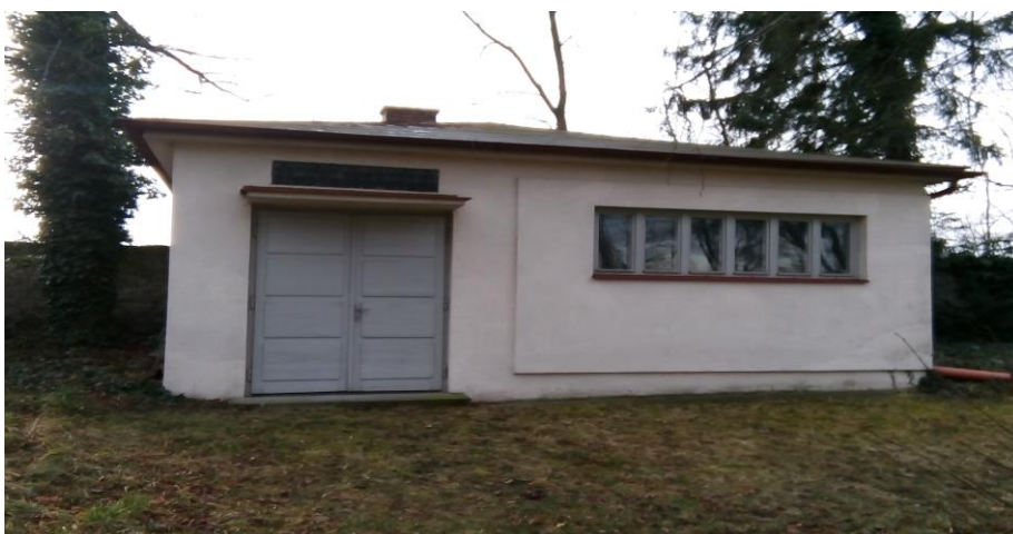
Obrázek 13 – Márnice

Proces začínal přivezením zemřelého do márnice, v níž proběhla značná očista, tedy základ celého rituálu. Důležitost s sebou neslo i pohlaví zemřelého. Přísně bylo střeženo, aby mrtvého omývaly vždy jen muži a mrtvou pouze ženy. Následovalo tedy kompletní omytí, oholení, zastříhnutí nehtů či ostříhání vlasů. Oděv zemřelého tvořil skromný šat bez jakéhokoliv zdobení a dalšího přikrášlování. Detailní očista končila přivedením pozůstalých, jež měli vzhled svého zemřelého otce, matky či jiného příbuzného zkontrolovat a odsouhlasit tak podobu, s níž tělo a duch vystoupá do nebe.