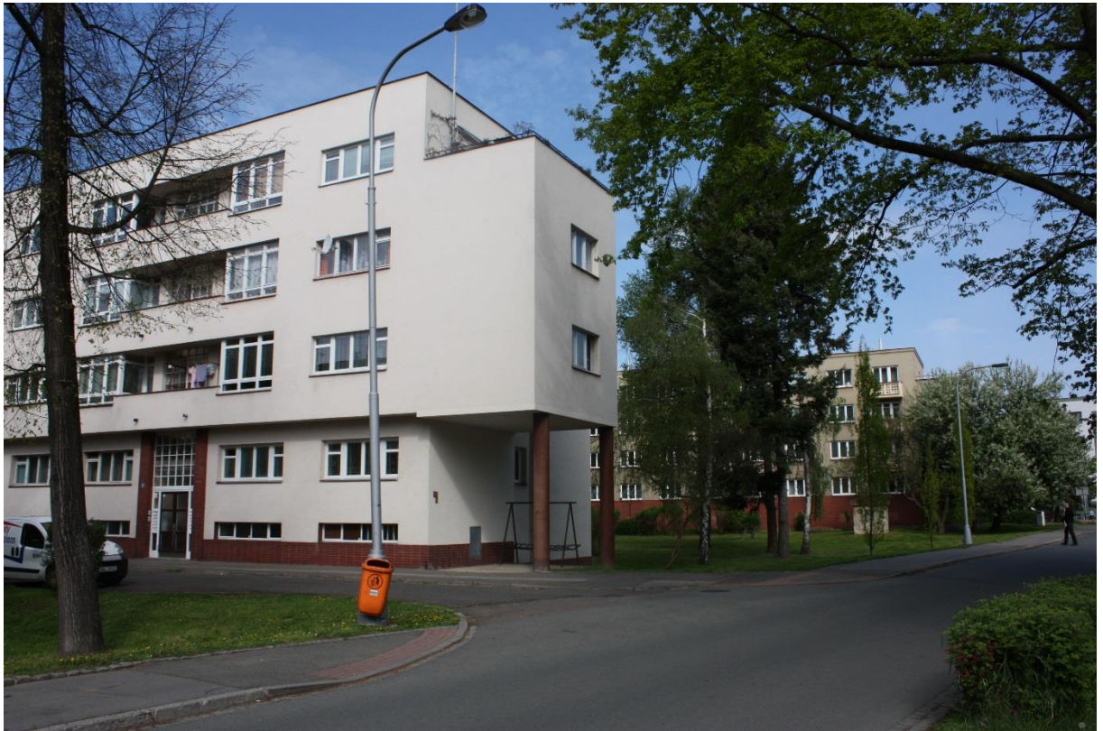
15. Hradec Králové, Řada solitérních třípatrových činžovních domů – pásy kachlíků, stav z roku 2015.