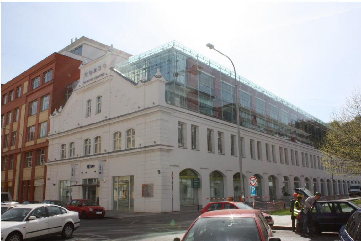
24. Praha 8 – Karlín, Corso Praha, stav k roku 2015