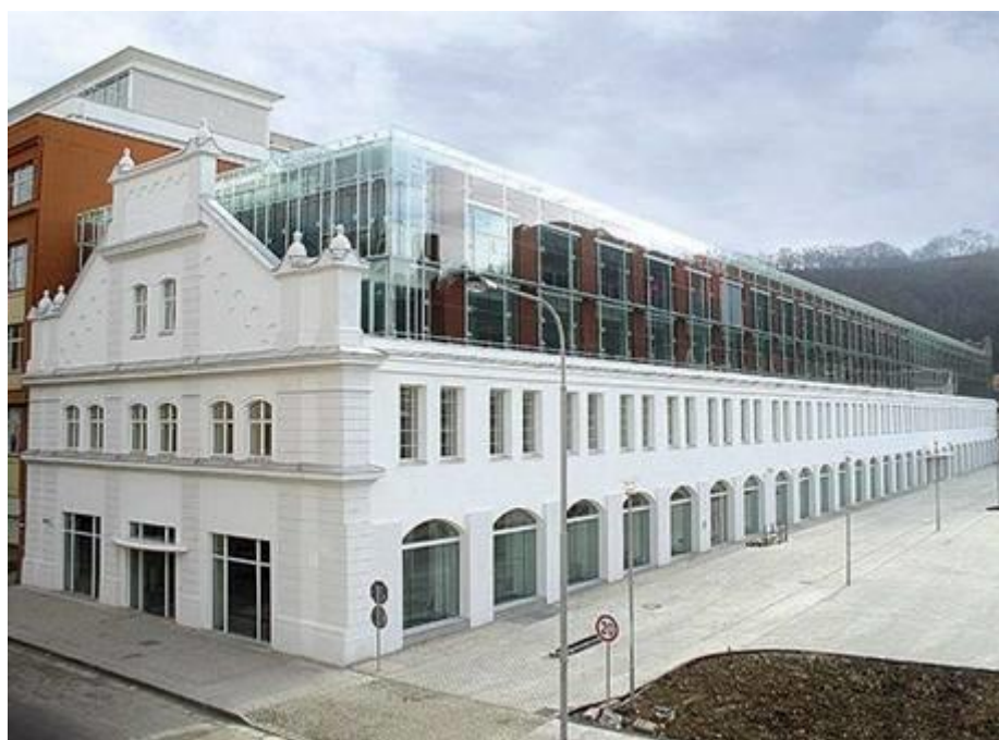
22. Praha 8 - Karlín, Corso Karlín, stav z roku 2009.