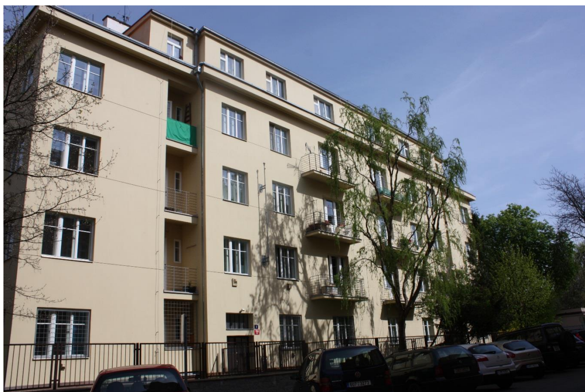
18. Praha 8 – Karlín, Dvojdům čp. 554 a 555, stav z roku 2015.