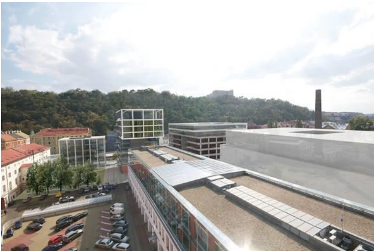
21. Praha 8 – Karlín, Návrh projektu Palác Praga z roku 2010.