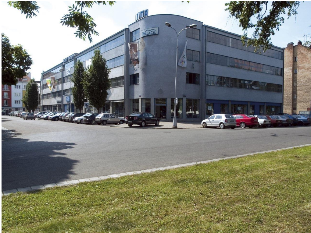
9. Hradec Králové, Novákovy garáže, stav z roku 2014.