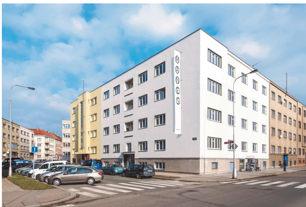
12. Hradec Králové, Bytové domy Mánes, stav z roku 2015.