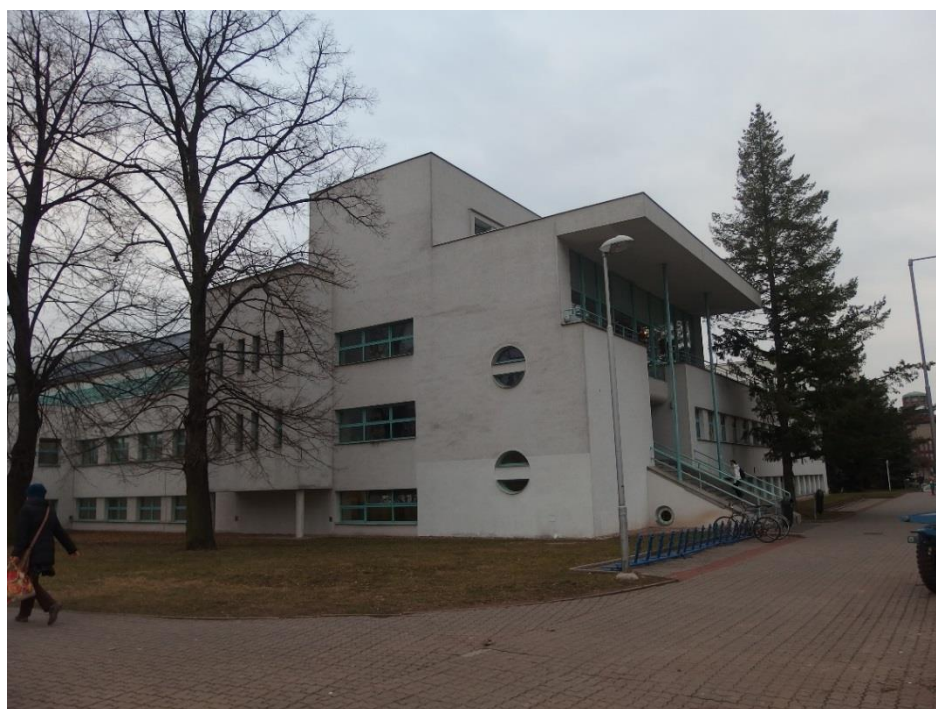
8. Hradec Králové, Budova Městských lázní, stav z roku 2015.