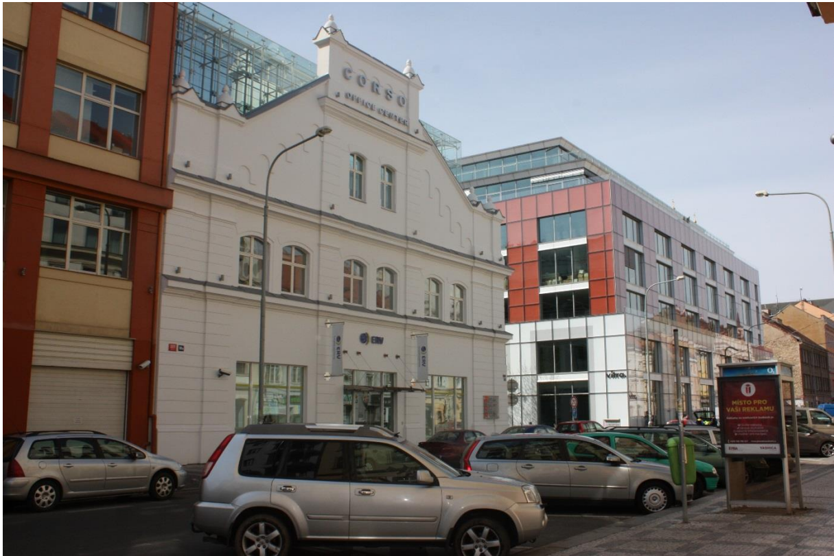
23. Praha 8 – Karlín, Corso Praha, stav k roku 2015.