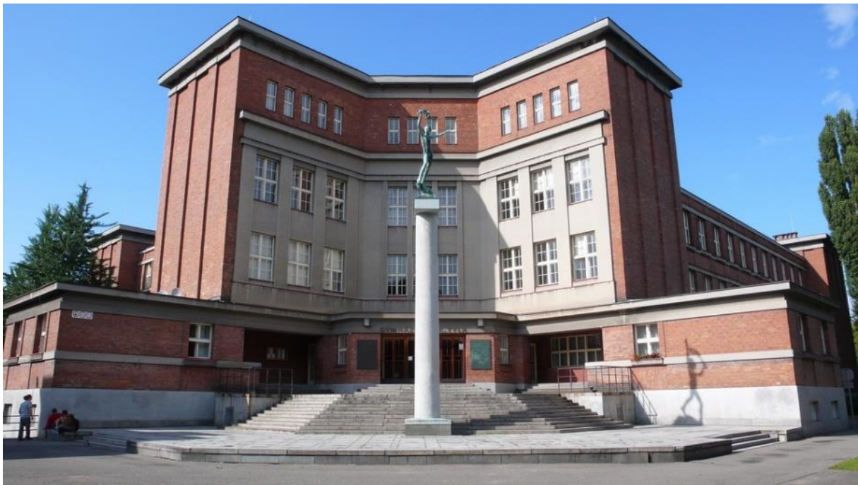
10. Hradec Králové, Gymnázium Josefa Kajetána Tyla, stav z roku 2015.