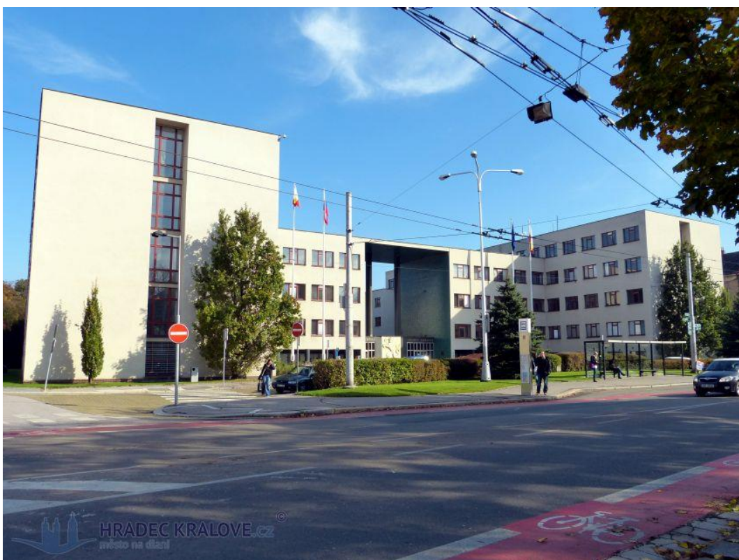
7. Hradec Králové, Bývalý okresní a finanční úřad (dnes Magistrát města Hradec Králové), stav z roku 2014.