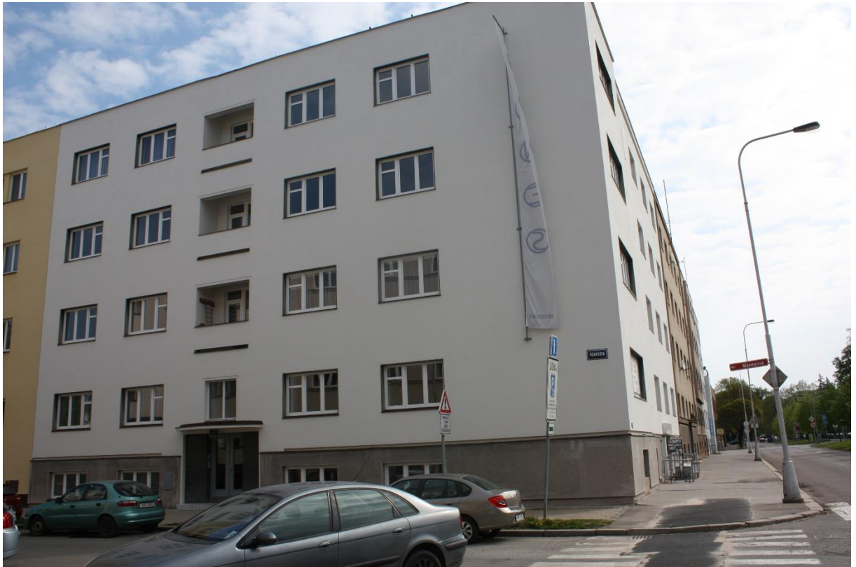
13. Hradec Králové, Bytový dům Mánes, stav z roku 2015.