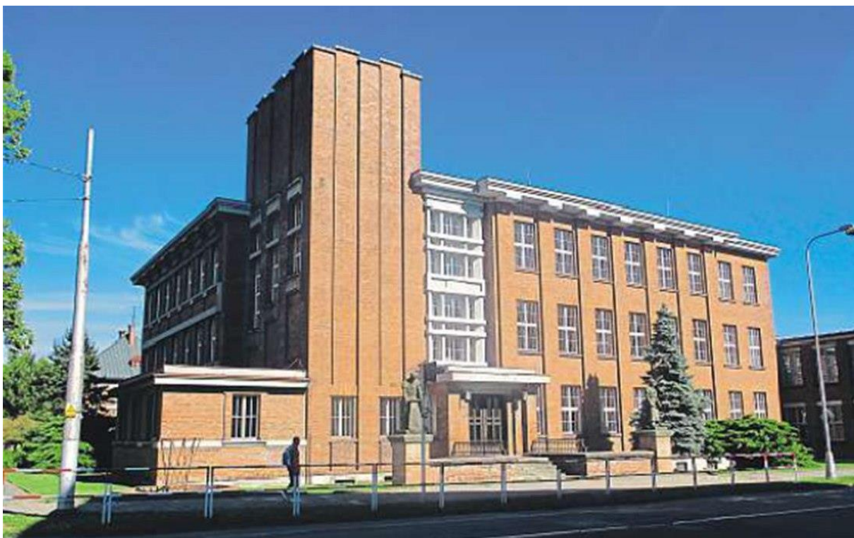
6. Hradec Králové, Bývalá koželužská škola (dnes Střední průmyslová škola strojnická), stav z roku 2014.