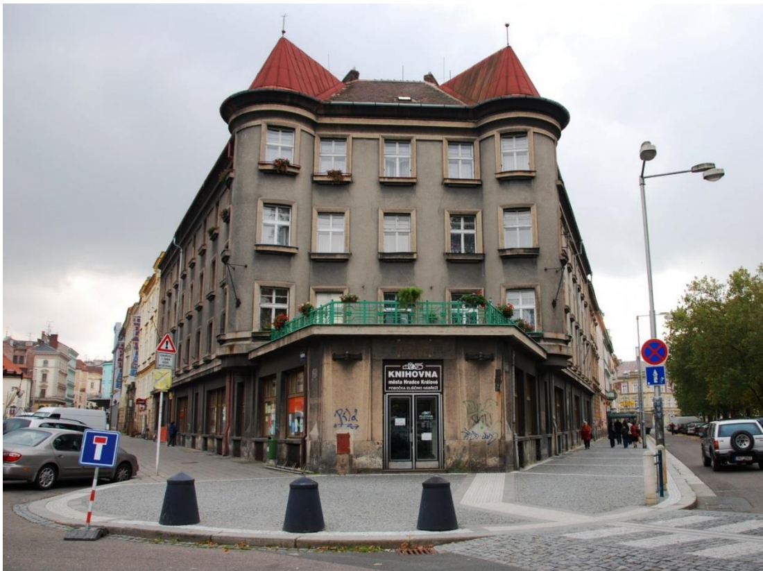
16. Hradec, Králové, Bývalý prostor městské knihovny, stav z roku 2012.