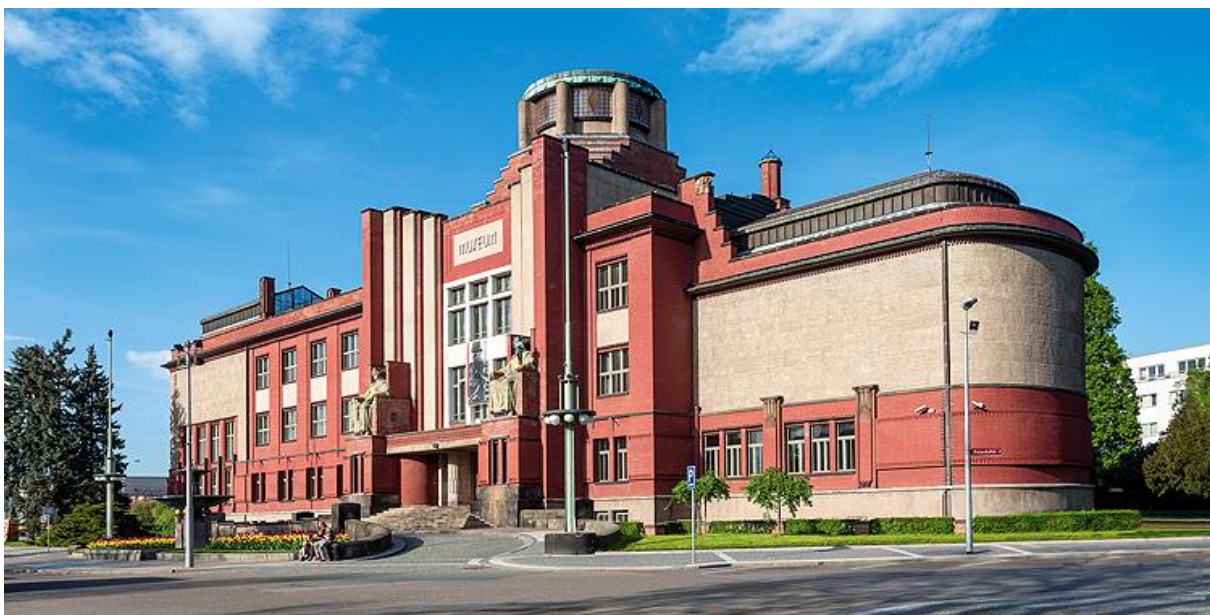
5. Hradec Králové, Muzeum východních Čech, stav z roku 2014.