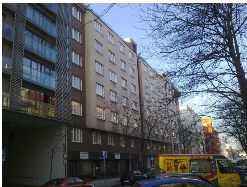
20. Praha 8 – Karlín, Řadový trojdům – uliční průčelím, stav z roku 2015.