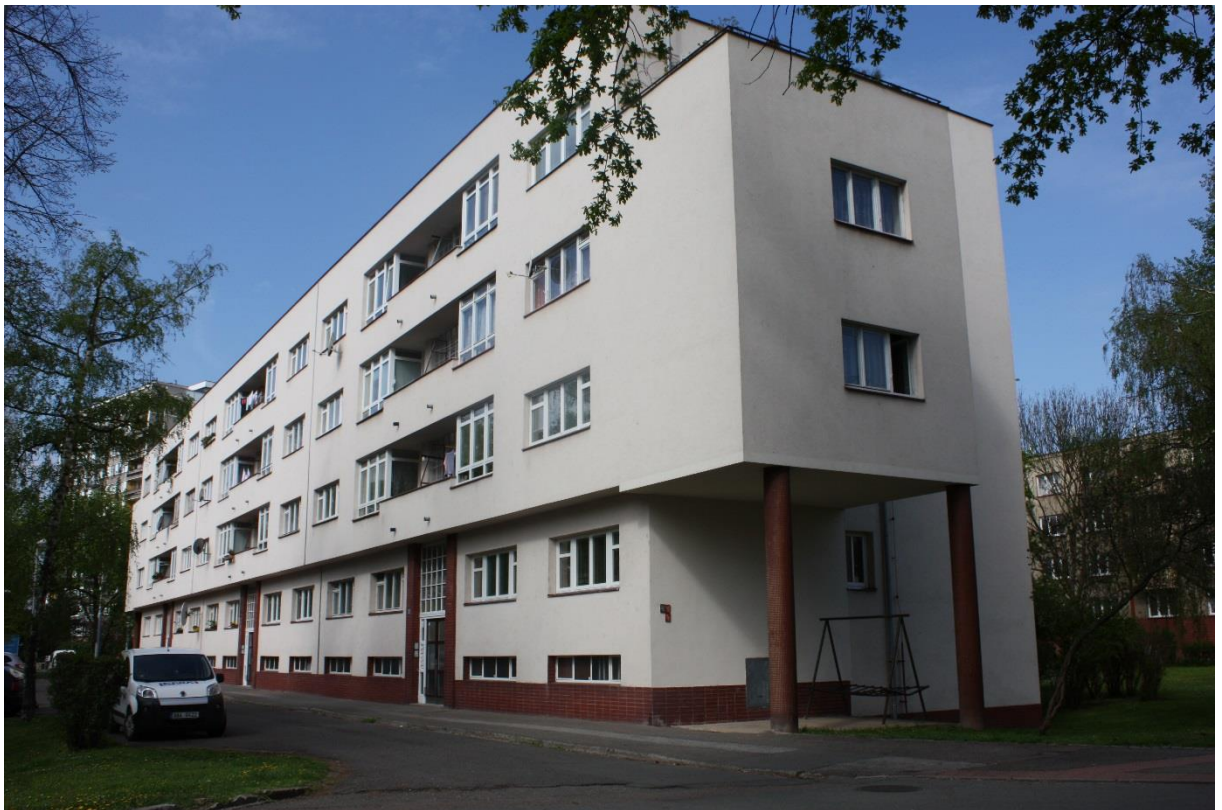
14. Hradec Králové, Labská kotlina I., stav z roku 2015.