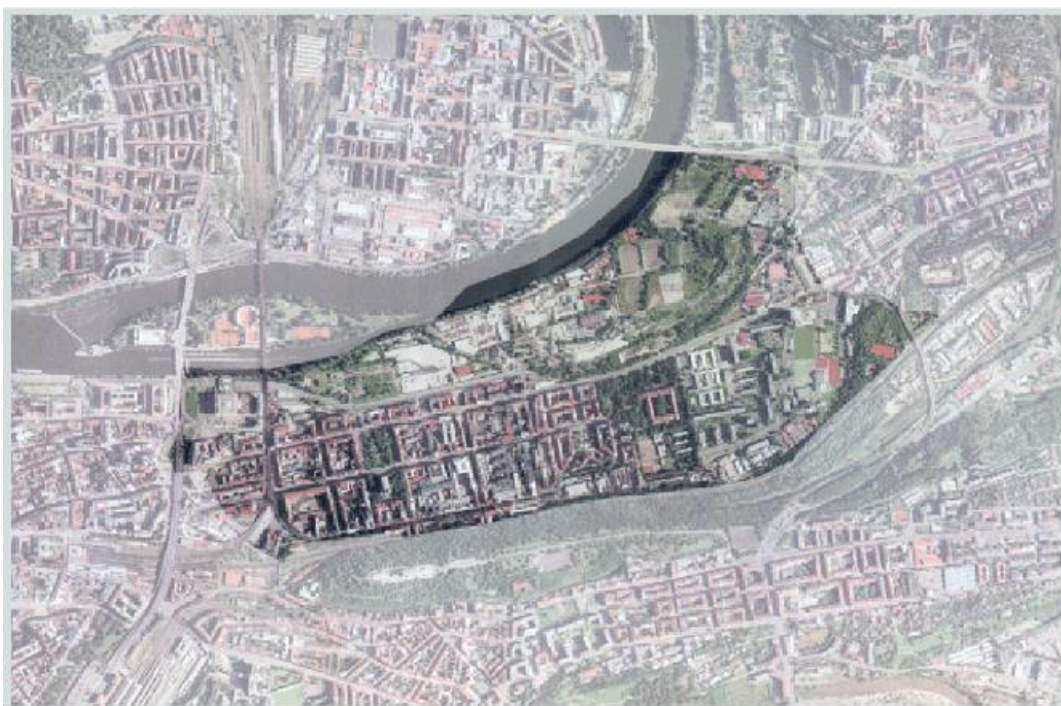
17. Praha, Letecký pohled na Karlín, stav z roku 2012.