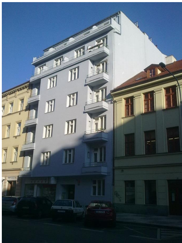
19. Praha 8 – Karlín, Sedmipodlažní činžovní dům s obchodními prostory, stav z roku 2015.