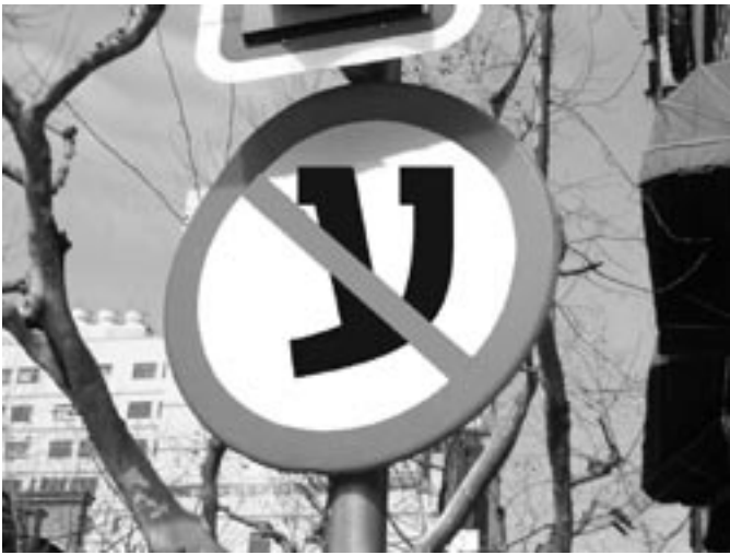
Création graphique à partir d'un cliché de SILANOC ©©

דאָס דאָזיקע ליד, וואָס זײַן טעמע איז אותיות 1 , האָט אונדז צוגעשיקט אַ תלמידה 2 פֿון די ייִדיש־קורסן אינעם פֿאַריזער ייִדיש־צענטער.