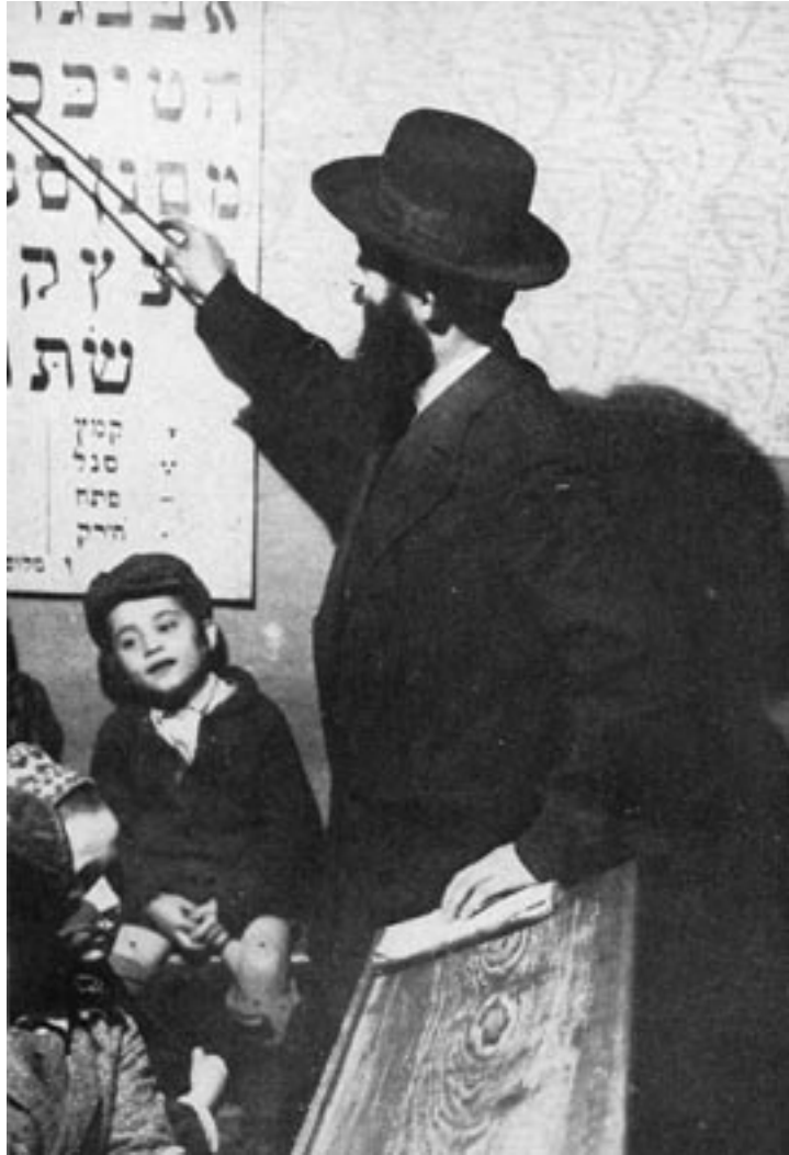
אַ רבי לערנט אין חדר - בילד פֿון ראַמאַן ווישניאַק D.R.

אַז איר וועט, קינדער, דעם גלות שלעפֿן 12 , אויסגעמוטשעט 13 זײַן, זאָלט איר פֿון די אותיות כּוח שפּען 14 , קוקט אין זיי אַרײַן !