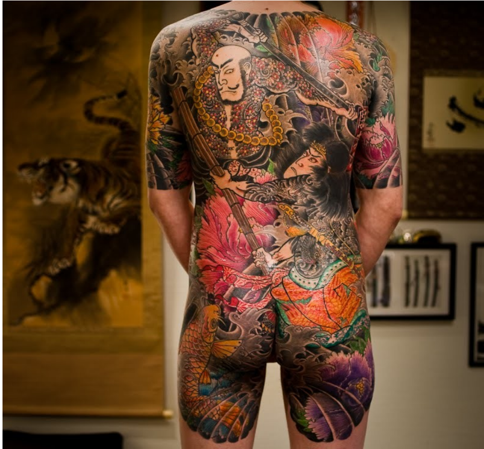
Obr. č. 2: Japonské tetování, tzv. „oblek“, s typickými motivy. Dostupné z: http://www.asianstyle.cz/kultura/11460-tradicni-japonske-tetovani , cit. 16. 5. 2015