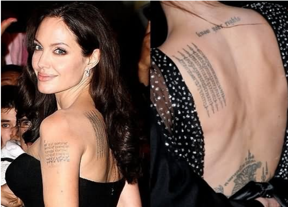
Obr. č. 9: Angelina Jolie.