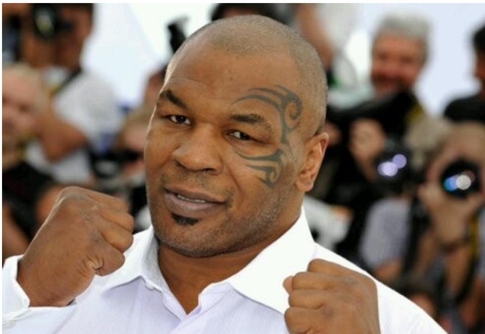
Obr. č. 8: Mike Tyson a jeho typické tetování. Dostupné z: http://athleternetworth.com/mike-tyson-net-worth/ , cit. 16. 5. 2015