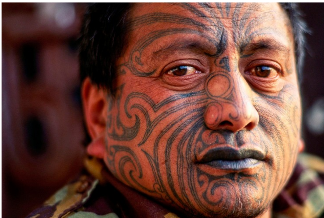
Obr. č. 5: Maorské tetování tzv. „moko“. Dostupné z: http://tattoo-trends.net/maori-tattoo-ideas/ , cit. 16. 5. 2015