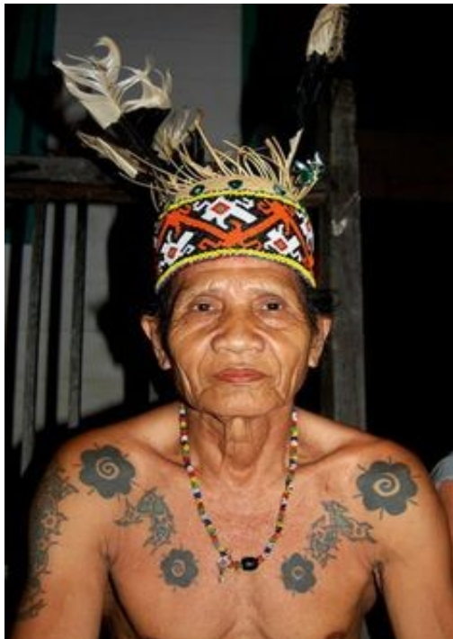
Obr. č. 3: Obyvatel Bornea s vytetovaným květinovým vzorem.