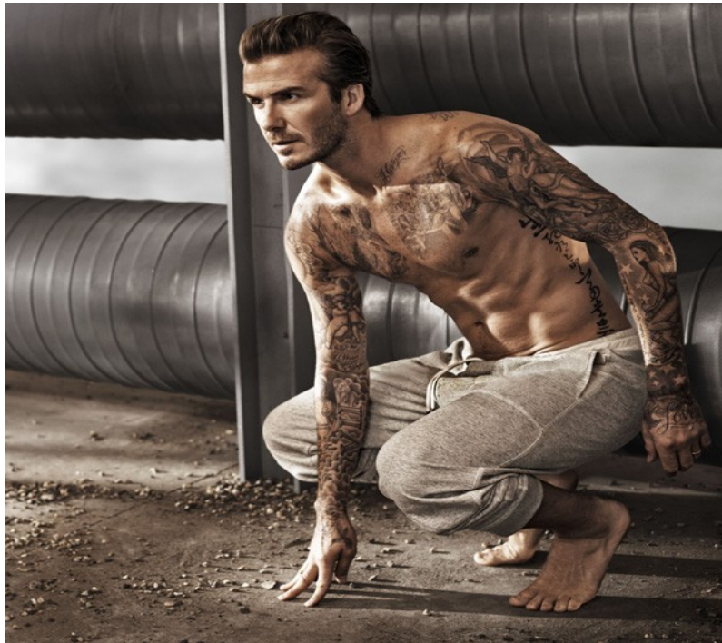
Obr. č. 7: David Beckham a jeho tetování. Dostupné z: http://www.instyle.co.uk/celebrity/news/hm-has-made-our-friday-with-these-new-david-beckham-pics , cit. 16. 5. 2015