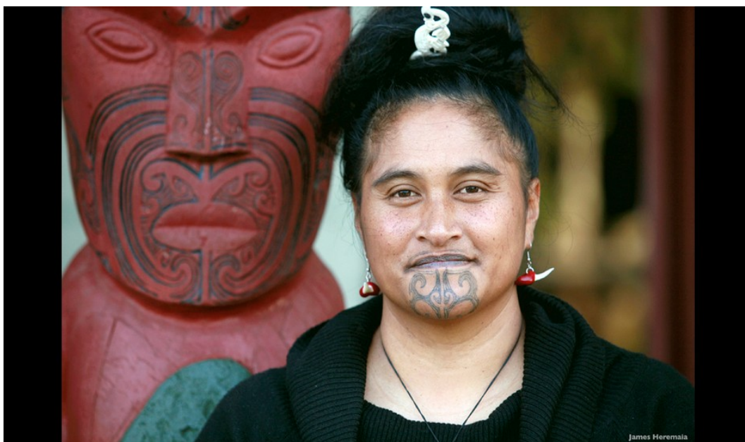
Obr. č. 6: Maorské tetování typické pro ženy.