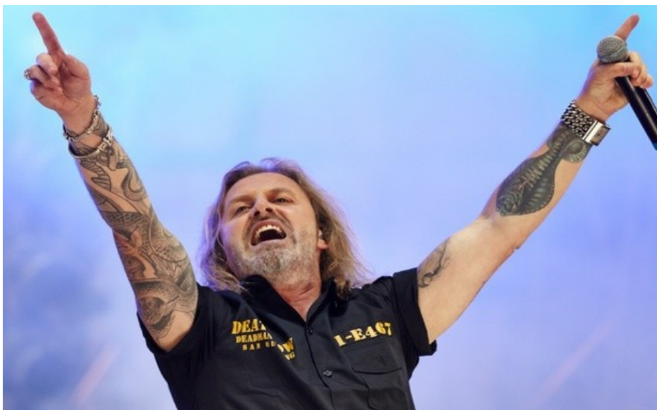
Obr. č. 10: Pepa Vojtek z kapely Kabát. Dostupné z: http://hudba.zoznam.sk/spravy/27-06-2014-topfest-2014-otvoril-vo-velkom-style-kabat-hlavna-hviezda-vystupi-v-sobotu/ , cit. 16. 5. 2015