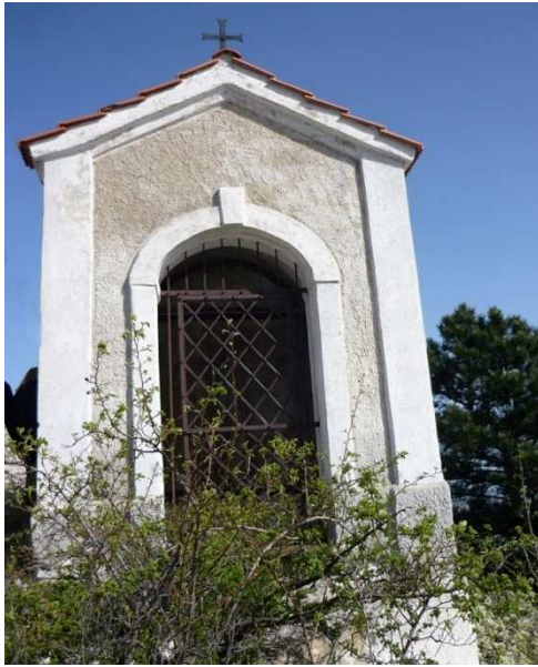
Obr. 9 – kaplička č. 9