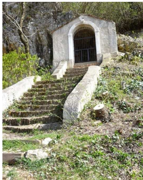
Obr. 2 – kaplička č. 2