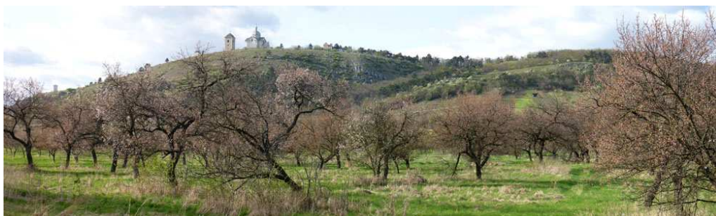
Obr. 17 – panoráma Svatého kopečku od jihovýchodu