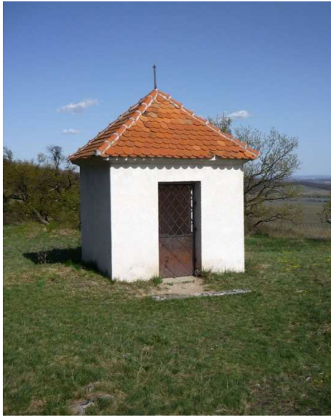
Obr. 13 – kaplička č. 13