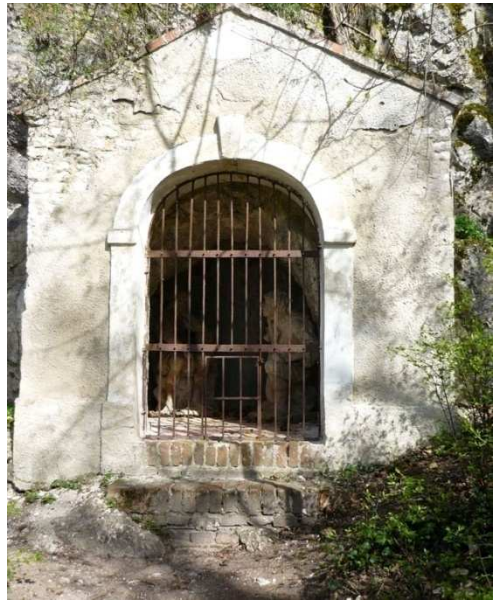
Obr. 6 – kaplička č. 6