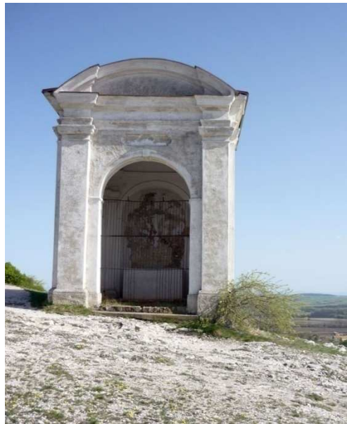
Obr. 8 – kaple č. 8