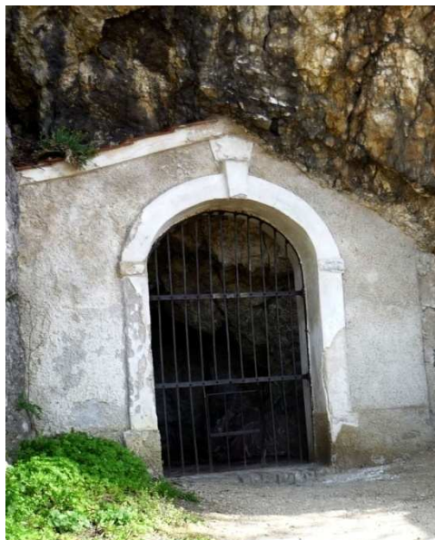
Obr. 3 – kaplička č. 3