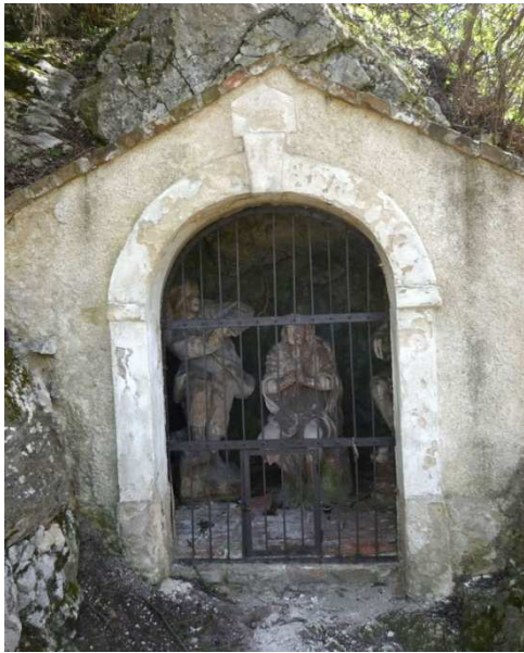
Obr. 5 – kaplička č. 5