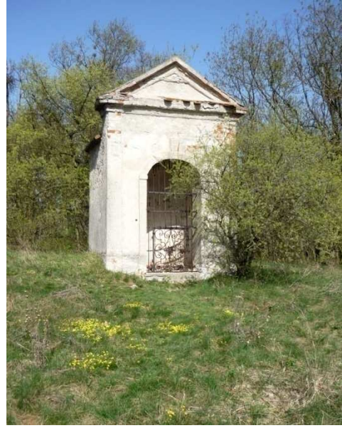
Obr. 14 – kaplička č. 14