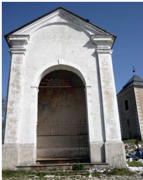
Obr. 11 – kaple č. 11