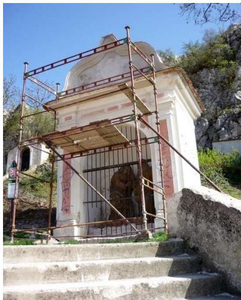
Obr. 1 – kaplička č. 1