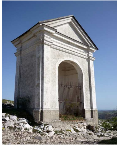
Obr. 10 – kaple č. 10