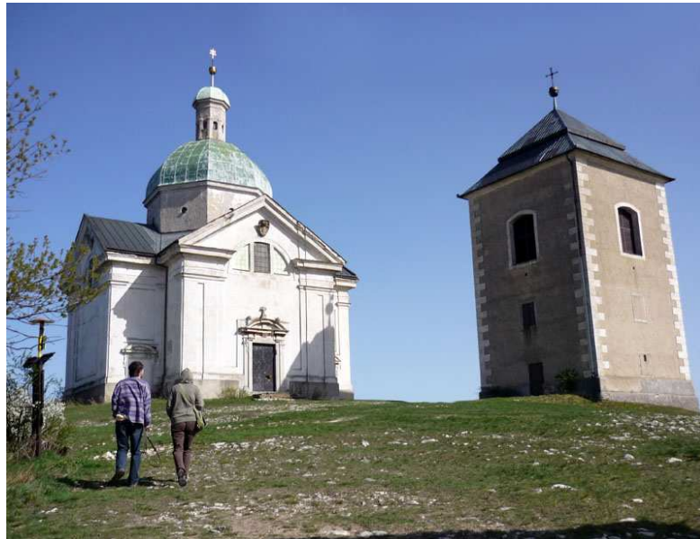
Obr. 15 – kostel sv. Šebestiána a zvonice