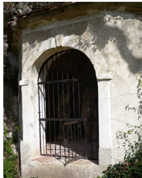
Obr. 4 – kaplička č. 4