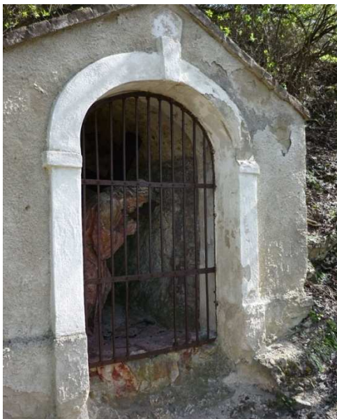
Obr. 7 – kaplička č. 7