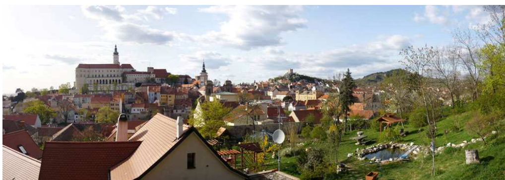
Obr. 18 – panoráma Mikulova ze západního svahu Svatého kopečku

Na fotografii jsou dobře patrné tři vrchy, vymežující město; zleva: Zámecký vrch, kopec s Kozím hrádkem a Turolď.