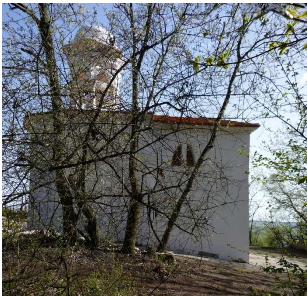
Obr. 16 – kaple Božího hrobu