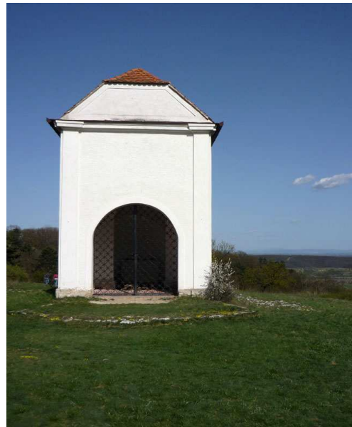
Obr. 12 – kaple č. 12