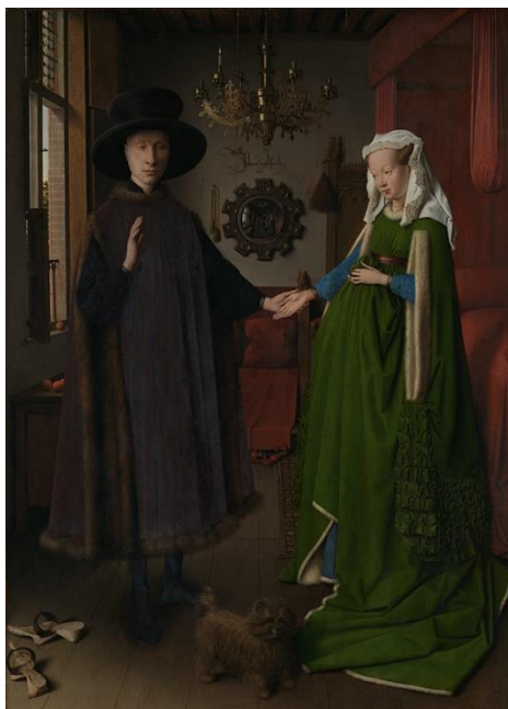
Obrázek 2. Jan van Eyck. Svatba Arnolfiniových . 1434.

Zrcadlo nebylo vždy jen předmětem každodenní potřeby. Zrcadlo, které je součástí malované scény, může být i tajemnější. Dává například divákovi možnost pohlédnout za scenerii tohoto díla, do koutů, kam by jinak oko nedohlédlo. Největším důkazem toho je obraz Svatba Arnolfiniových od Jan van Eycka. Vyobrazení manželského páru v jejich domě, který je plný předmětů se symbolickým podtextem. Mezi manželským párem se na zadní stěně nachází vypoukle zrcadlo, které odráží scénu na opačné straně místnosti. 18 Dále např. Probuzené svědomí od Williama Holmana Hunta, který namaloval manželský pár a za ním se na zdi nachází zrcadlo, které odráží pohled otevřeného okna do zahrady. Nebo Bar ve Folies-Bergere od Éduarda Maneta, který namaloval za barem číšnici Suzon. Celé pozadí je odrazem scenerie v taneční kavárně v Paříži. V pravém rohu se pak nachází muž Gaston Latouche, který mluví s číšnicí Suzon. 19