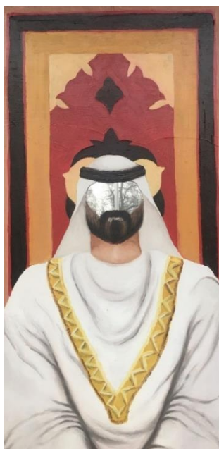
Obrázek 11. Šejk . 92 × 45. olejomalba na zrcadle. 2022.

Třetí zrcadlo jsem dostala od mladého ambiciózního muže, který čerstvě dostudoval právnickou fakultu a aktuálně si dodělává praxi v jedné právnické firmě. Mezi jeho koníčky patří cestování po světě s přáteli, u kterých je velmi oblíbený. Zrcadlo od tohoto muže je jednoduché obdélníkové bez jakéhokoli rámu. Při pohledu do zrcadla viděl mladík muže z Dálného východu, který působí velmi bohatě a mocně. Na zrcadle jsem vyobrazila postaršího šejka s černými vlasy a upravenými vousy.