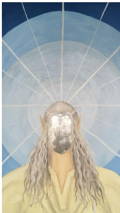
Obrázek 13. Elf . 58 × 35. olejomalba na zrcadle. 2022.

Páté zrcadlo jsem dostala od mladého muže, který pracuje jako strojírenský dělník v továrně. Ve volném čase čte fantasy knihy, dívá se na filmy a hraje počítačové hry. Zrcadlo od toho muže je obdélníkové se světlým dřevěným rámem. Mladík při pohledu do zrcadla viděl elfa, který prochází svým královstvím. S takovouto postavou se často setkával ve svých knihách. Elfa jsem na zrcadle vyobrazila s dlouhými bílými vlasy sepnutými na temeni dozadu. Mezi vlasy vyčnívají špičaté uši, které jsou pro elfy typické. Na hlavě má stříbrný diadém, který mu zasahuje do čela. Na sobě má lněnou košili ozdobenou jemným vyšíváním.