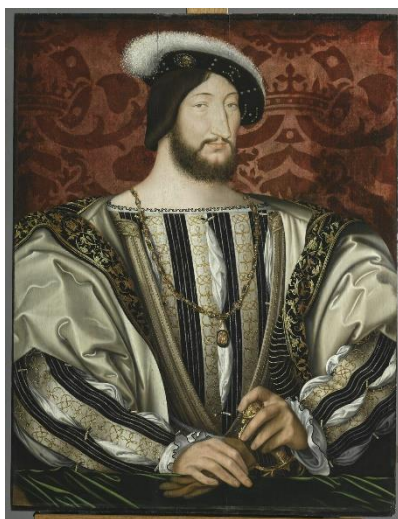
Obrázek 1. Jean Clouet. František I. 1547.

Ve středověku se umělec zaměřoval na vyobrazení modelu v co nejlepším světle. Zadavatelé byli bohatí a vlivní občané, kteří chtěli být zobrazeni krásněji a vznešeněji, aby byla zachycena podstata bohatství a moci. Důležitou součástí zachycení postavy bylo i její oblečení. Lidé si kvůli tomu brali nejlepší oblečení a šperky, které dokazovaly jejich společenské postavení. Jako na obraze František I. od Jeana Cloueta, Portrét infantky Dony Margarity Rakouské od Diega Vélazqueze nebo Portrét Kateřiny I. od Jeana-Marca Nattiera. Totéž platilo o prostředí a předmětech, kterými autor obklopil postavu. 8