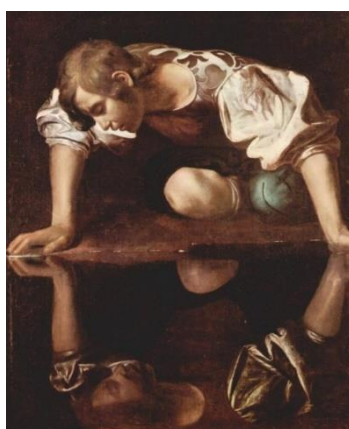
Obrázek 7. Michelangelo Merisi de Caravaggio. Narcis . 1599.

Inspirací pro zpracování tohoto tématu byl pro mě obraz od známého italského malíře Michelangela Merisiho, zvaného Caravaggio. Maloval převážně portréty, náměty všedního života obyčejných lidí nebo biblické výjevy. 33 Kolem roku 1598-1599 vytvořil obraz s názvem Narcis . Námětem pro jeho malbu mu byla řecká pověst o Narkisovi a nymfě Echo od básníka Publia Ovídia Nasa.