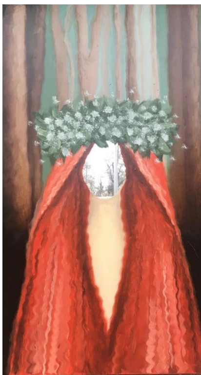
Obrázek 14. Víla . 82 × 48. olejomalba na zrcadle. 2022.

Poslední zrcadlo jsem dostala od staré sympatické paní, která je již v důchodu. Nejraději tráví čas na své chatě na vesnici, kde se stará o zahradu. Mezi její záliby patří luštění křížovek a výklad karet. Zrcadlo od této ženy je mohutné, obdélníkové, s tmavě hnědým dřevěným rámem. Paní při pohledu do zrcadla viděla sebe jako mladou ženu, která tančí v lese. Na zrcadle jsem vyobrazila mladou dívku, s dlouhými hustými rusými vlasy sahajícími až ke kolenům. Vlasy jí zakrývají části jinak nahého těla. Na hlavě má věnec z drobných bílých květů. Víla se nachází v potemnělém lese s vysokými stromy. Víla zosobňuje mládí a krásu. Stará paní, která se vidí jako víla, často vzpomíná na mládí, kdy si připadala krásná a obdivovaná. A jako by se nemohla smířit s tím, že stárne, snaží se alespoň mladistvým stylem oblékání a někdy i chováním vypadat mladě. Ne všichni z jejího okolí to ale chápou.