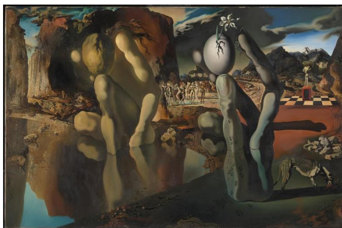
Obrázek 5. Salvador Dalí. Proměna Narcise . 1937.

Také významný představitel surrealismu, španělský malíř Salvador Dalí, se kolem roku 1937 rozhodl ztvárnit téma, týkající se Narcise. Jeho obraz s názvem Proměna Narcise je jakoby rozdělený na pravou chladnou a levou teplou stranu. Na levé straně sedí na břehu Narkissos opírající si hlavu o koleno. Postava je sytě žlutá a kontrastuje tak s rudě zbarveným pozadím skal. Narkissos je na pevnině vyobrazen ještě jednou ale v chladnějších modrých barvách, jelikož má evokovat jeho odraz na vodní hladině. Odraz má na první pohled stejnou polohu těla, nejedná se však o tělo ale o ruku držící místo hlavy vajíčko. Vajíčko má prasklinu, ze které roste květ narcisky. Uprostřed dvou postav v pozadí vede cesta, po které krácejí nápadníci, které Narkissos odmítl. Cesta vede dál do hor kolem šachovnicového pole, na kterém stojí uprostřed na červeném podstavci další postava v pozici sochy, otočené zády. Mezi vrcholky hor je zřetelná ještě další částečná podobizna Narkisse, která je ve stejné pozici jako je ruka na břehu. Nad celou touto scénérií se převalují mračna a obraz tak působí velmi truchlivě. Dnes se toto dílo nachází v muzeu Tate Modern v Londýně. 28