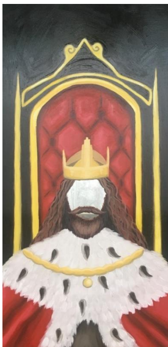
Obrázek 9. Král . 110 × 55. olejomalba na zrcadle. 2022.

První zrcadlo jsem dostala od staršího pána, který pracoval dlouhá léta jako hlídač v muzeu umění. Mezi jeho koníčky patří rybaření s vnukem a posezení s přáteli u piva. Zrcadlo, které jsem od něj dostala je dlouhé obdélníkové se zlatým dřevěným rámem.