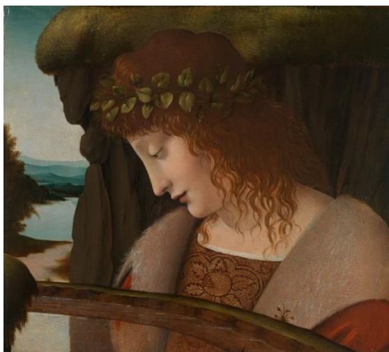
Obrázek 3. Giovanni Antonio Boltraffio. Narcis u fontány . 1516.

Dílo Narcis u fontány namaloval kolem roku 1500 italský renesanční malíř Giovanni Antonio Boltraffio, který pracoval v ateliéru Leonarda da Vinciho. V centru obrazu je postava mladého muže s delšími zrzavými vlasy, ve kterých má vavřínový věnec. Je oblečen do hnědé košile s dekorem a červeného kabátu s kožešinou. Před hochem se nachází fontánka, na jejíž hladině se zrcadlí chlapcův odraz. Studánka však není vyobrazena celá, tudíž si divák poměrnou část musí domyslet. Narkissos jakoby zasněně hledí na svůj odraz na hladině a hlavu sklání na pravou stranu do profilové pozice. Na pravé straně pozadí se nachází travnatý útes. Na levé straně pozadí se pak nachází pohled do krajiny s cestou, která vede k jezeru obklopenému horami. Dnes se kopie tohoto díla nachází v Národní galerii v Londýně. 24