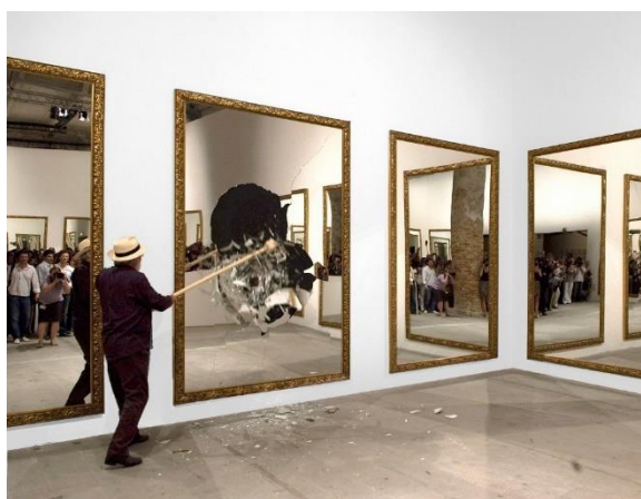
Obrázek 8. Michelangelo Pistoletto. Twenty-Two Less Two . 2009.

Jakožto umělec, který pracuje s neobvyklým materiálem, mi byl inspirací italský výtvarník a jeden ze zakladatelů hnutí Arte povera, neboli chudé umění, Michelangelo Pistoletto. Na Benátském bienále v roce 2009 představil Pistoletto svou instalaci s názvem Twenty-Two Less Two , které předcházela akce, kdy podél výstavních zdí na začátku trasy umístil dvacet dva velkých zrcadel se zlatým rámem. Před davem návštěvníků, kteří se odrazili v zrcadlech, rozbíjel zrcadla velkým kladivem, čímž vytvořil na zrcadlech velké nepravidelné černé díry. Na konci této akce byla zrcadla i popadané kusy vystaveny jako instalace. Podle Pistoletta má zrcadlo pevný fotografický obraz, který se nemění. Zároveň ale poukazuje na skutečnost, která je proměnlivá. Rozbitím zrcadel dokumentuje skutečnost, která byla přítomná a zároveň zůstává jako vzpomínka. Tento umělec mě inspiroval používáním netradičních a starých předmětů denní potřeby, kterými propojuje svoji myšlenku s uměním. 36 Stejně jako on, i já jsem použila zrcadlo, které považuji za jeden ze symbolů narcismu.