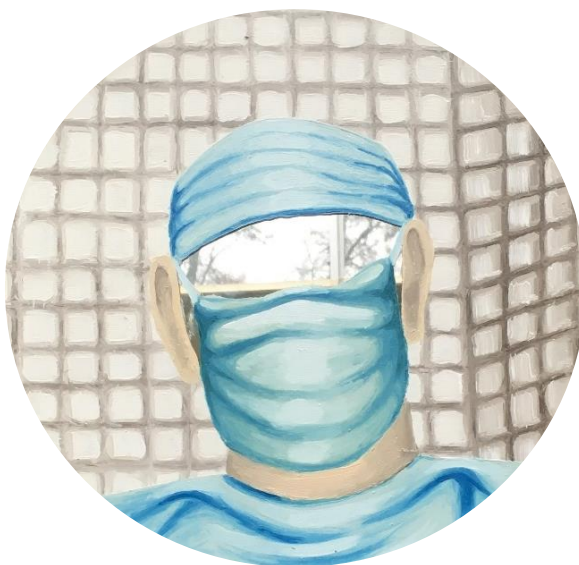
Obrázek 12. Doktor . Ø 30. olejomalba na zrcadle. 2022.

Doktor znázorňuje profesní úspěch. Tento muž jako jediný viděl v zrcadle svůj skutečný obraz. Je si vědom svého úspěchu, kterého dosáhl v profesním životě a v postavení ve společnosti, a občas to také dokáže náležitě dávat najevo, což se nesetkává s kladnými ohlasy v jeho okolí. Snaží se proto obklopovat lidmi, kteří jsou podle něj minimálně stejně úspěšní jako on.