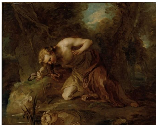
Obrázek 4. Francois Lemoyne. Narcis . 1725.

Kolem roku 1728 namaloval francouzský malíř Francois Lemoyne obraz s názvem Narcis . Toto dílo je oproti předešlým dvěma obrazům temnější, s ponuřejší náladou. Středem obrazu je Narkissos, klečící a sklánějící se nad vodní hladinou. Na sobě má mladý muž šaty hnědobílé barvy, delší blond vlasy mu padají po jedné straně tváře. V pravé ruce drží šíp, o který se opírá. Na dolní části obrazu je viditelný chlapcův odraz na vodní hladině jezírka. Kolem Narkisse je vyobrazena příroda se skálou a lesem. Atmosféra krajiny působí velmi ponuře, jako podvečer podzimního dne. Dnes se toto dílo nachází v Muzeu výtvarného umění v Lyonu. 26