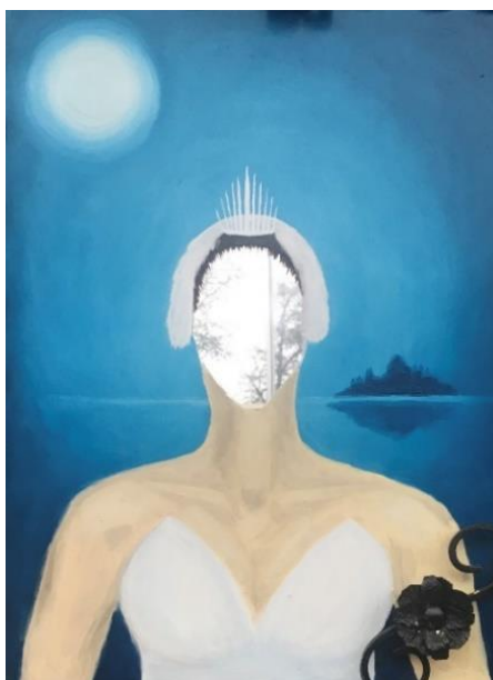
Obrázek 10. Baletka . 65 × 40. olejomalba na zrcadle. 2022.

Další zrcadlo jsem dostala od mladé ženy na mateřské dovolené, která se stará o dva malé chlapce. Zrcadlo od této maminky je obdélníkové, s umělecky kovaným rámem. Při pohledu do zrcadla maminka viděla mladou baletku, která se připravuje na baletní představení. Stejně jako ona, když byla malá a její maminka ji doprovázela do tanečních kroužků. Na zrcadle je vyobrazena baletka, která je připravena na večerní vystoupení. Na sobě má bílý kostýmek s pěřovými doplňky. Za baletkou se nachází scénérie z Labutího jezera, která je tónována do tmavě modrých barev. Jedná se o jezerní království se svítícím měsícem v úplňku. Baletka zosobňuje exhibicionismus a úspěch.