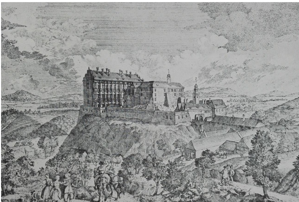
Příloha č. 4 – Plumlovský zámek s hradem. Rytina A. Delsenbacha z roku 1718

Zdroj: KÜHNDEL, J. Plumlovský zámek a jeho knížecí architekt. Prostějov: Městské museum, 1937. s. 13.