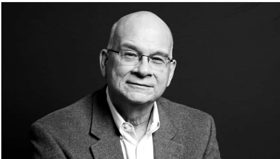
Obrázek II. Timothy Keller a Collin Hansen

https://cdn.theatlantic.com/thumbor/Xh_JhJLJ7ZS3BDQ8tgcy9wmsyL4=/0x0:2000x1125/1952x1098/media/img/mt/2019/12/1219_Wehner_Keller/original.jpg >)