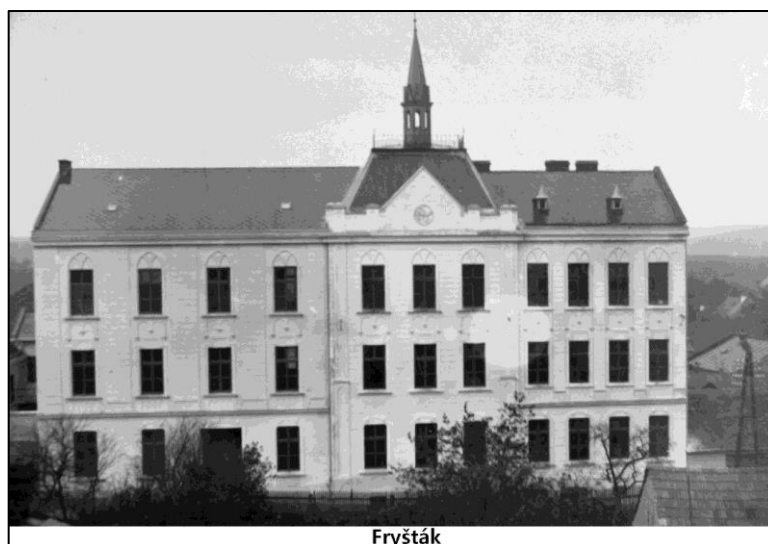
Obrázek 2: Salesiánský ústav Fryšták