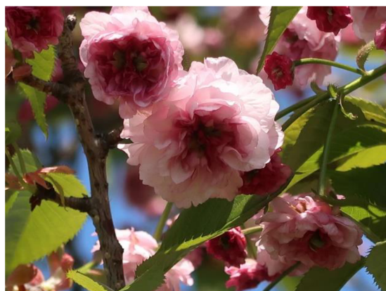
Obr. 4. Kvet kikuzakury

lístkov na kvet. 87 Na porovnanie je pripojený obrazový materiál stromu kikuzakura (prvý obrázok) a sakury Jošino (druhý obrázok), ktorá je najrozšírenejším typom sakury. Ďalší známy háj v záhrade Kenrokuen je plný stromov slivky, ktoré kvitnú na začiatku jari.