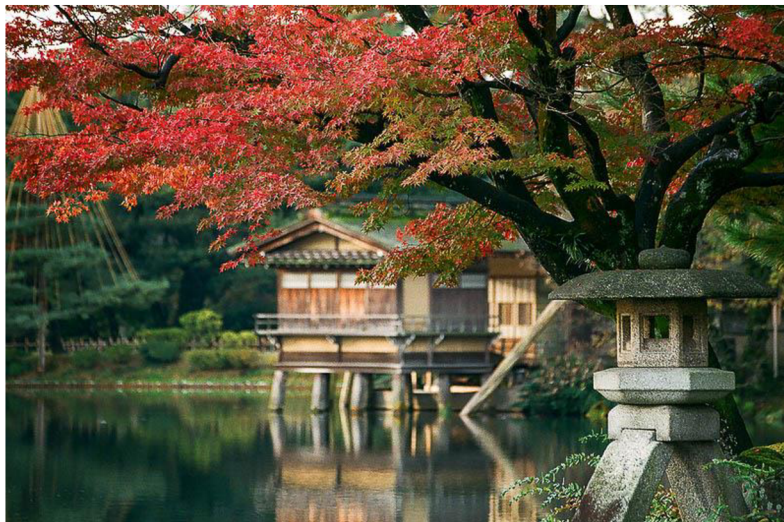
Obr. 3. Kamenný lampáš Kotodži s pozadím čajového domu Učihašitei