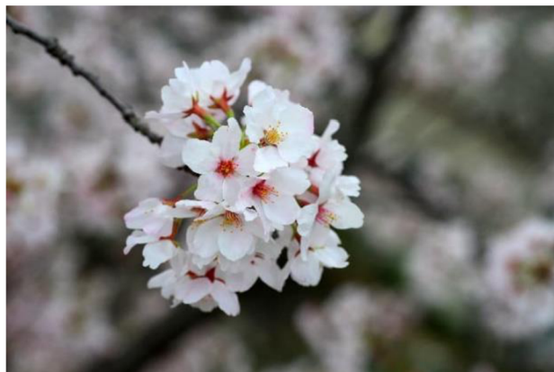
Obr. 5. Kvet sakury Jošino