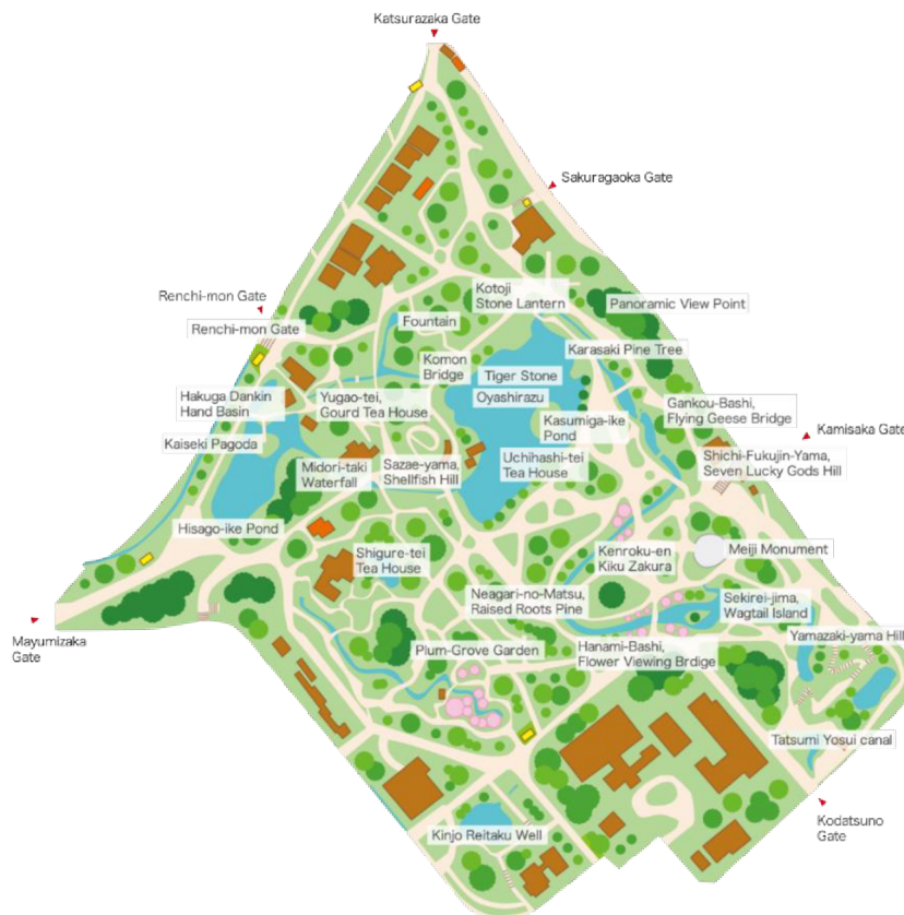
Obr. 2. Mapa Záhrady Kenrokuen

Táto kapitola konkrétnymi záhradnými prvkami a miestami záhrady Kenrokuen a analyzovať ich z hľadiska nielen vzhľadu, ale aj priradenia do jedného zo šiestich atribútov. Na úvod je taktiež pripojená mapa, ktorá pomáha lepšie sa zorientovať v jednotlivých pamiatkach a celkovom rozložení záhrady. Miesta a prvky záhrady však nebudú predstavené postupne podľa mapy, pretože existuje mnoho spôsobov ako záhradu prejsť. Namiesto toho budú prvky predstavené podľa toho, o aký druh prvku alebo miesta sa jedná.