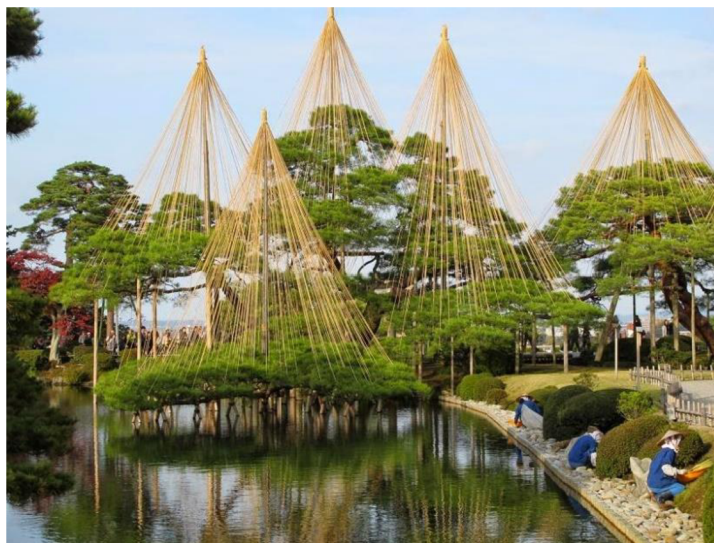
Obr. 6. Jukicuri

Monochromatický vzhľad záhrady v období zimy predstavuje čistotu a jednoduchosť. 99 Navyše, záhrada Kenrokuen návštevníkovi, ktorý príde v zimnom období, ponúka výhľad na jukicuri . Jukicuri je technika uväzovania konárov pomocou lán tak, aby sa konáre pod váhou snehu nezlomili. 100 Pohľad na zasnežené, lanami podopreté koruny stromov je jedným z najznámejších vizuálov záhrady Kenrokuen.