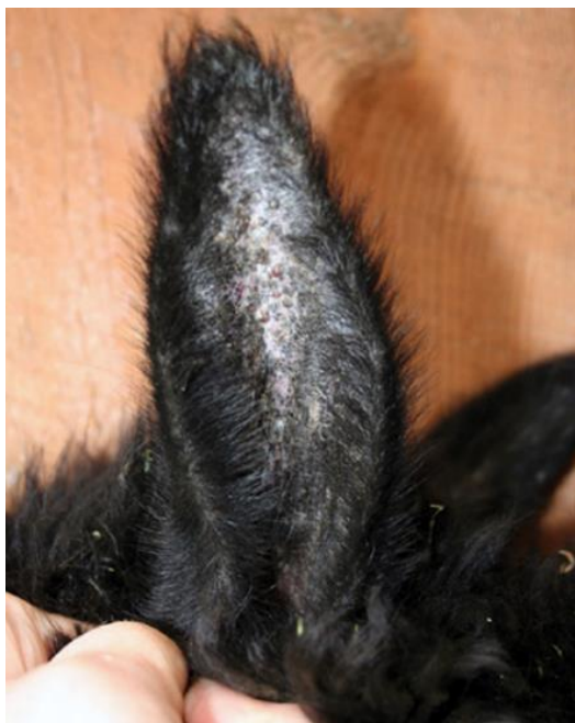
Obrázek 3 - Krusty a šupiny na konkávním povrchu boltce, způsobené kousnutím mouchy z čeledi Simuliidae (Scott 2007).

Samice těchto much potřebují ke zrání vajíček krev hostitele, což může představovat velký problém, obzvláště, když se kolem zvířete vytvoří jejich celé hejno (Adler & McCreadie 2019). Čeleď Simuliidae je známá zejména z toho důvodu, že se řadí mezi vektory viru vezikulární stomatitidy. U nemocných se objevují vezikulární léze připomínající puchýřky, které se vyskytují především na jazyku, pysku a čenichu. Mohou se ale objevit i na mléčných žlázách a pochvě (Timoney 2016; Pelzel-McCluskey 2021).