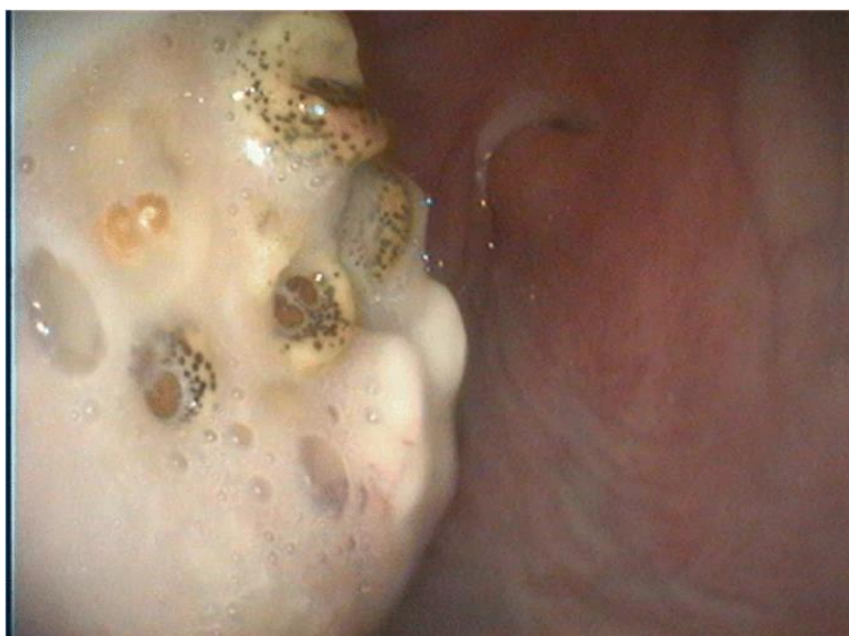
Obrázek 4 - Endoskopický snímek pravého ventrální nosního průchodu alpaky napadeného larvami střečka ovčího (Punsmann et al. 2018).

Dospělci střečků rodu Cephenomyia jsou nepatrně větší než střečka ovčího. Larvy mají 3 stádia a dostávají se až do nosohltanu (Samuel et al. 2000; Wernery & Kaaden 2002; Fowler & Bravo 2010). Podle Fowlera & Bravo jsou primárními hostiteli sudokopytníci čeledi jelenovití. I když jsou známy případy přenosu na lamy, není zatím známo, zda zde jsou schopni dokončit svůj životní cyklus (2010). Napadená zvířata mají velmi nápadné projevy. Může docházet až k otoku postižené oblasti, dále k pokašlávání a kýčání (Wernery & Kaaden 2002; Fowler & Bravo 2010).