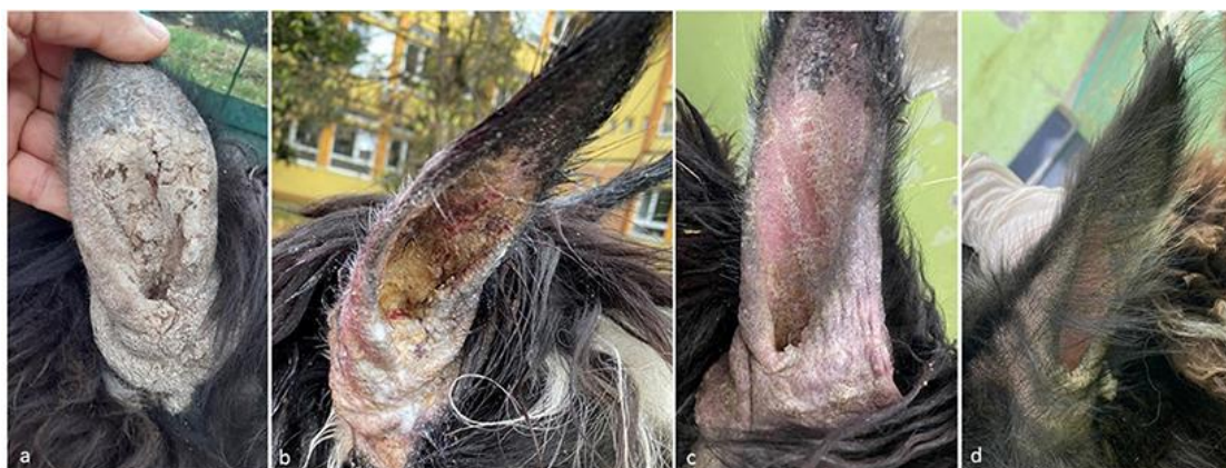
Obrázek 1 - Postupné hojení ucha alpaky napadeného sarkoptovým svrabem (Deak et al. 2021).

Článek od Geurdena et al. (2003) popisuje neobvyklý případ paralelního nakažení vešmi třemi druhy svrabu u stáda v Belgii. Byl prováděn odběr vzorků z hlavy, břicha a vnitřní strany stehna. Testovalo se 11 dospělých samic, 2 mláďata a 1 hřebec. Na hlavě byl nalezen sarkoptový svrab pouze u jedné samice (společně s psoroptovým) a u dvou mláďat. U jednoho mláďete byl rovněž rozpoznán i choriptový svrab. Stěry na břicho prokázaly sarkoptový svrab u 9 samic, pouze u jedné byl objeven choriptový svrab. Sarkoptový svrab byl prokázán u 9 samic po stěru z vnitřního stehna, přičemž u dvou z nich se objevil i svrab choriptový. Hřebec byl postižen pouze sarkoptovým svrabem, a to v oblasti vnitřního stehna. U nakažených jedinců byly pozorovány příznaky v podobě pruritu, alopecie a kachexie (Geurden et al. 2003).