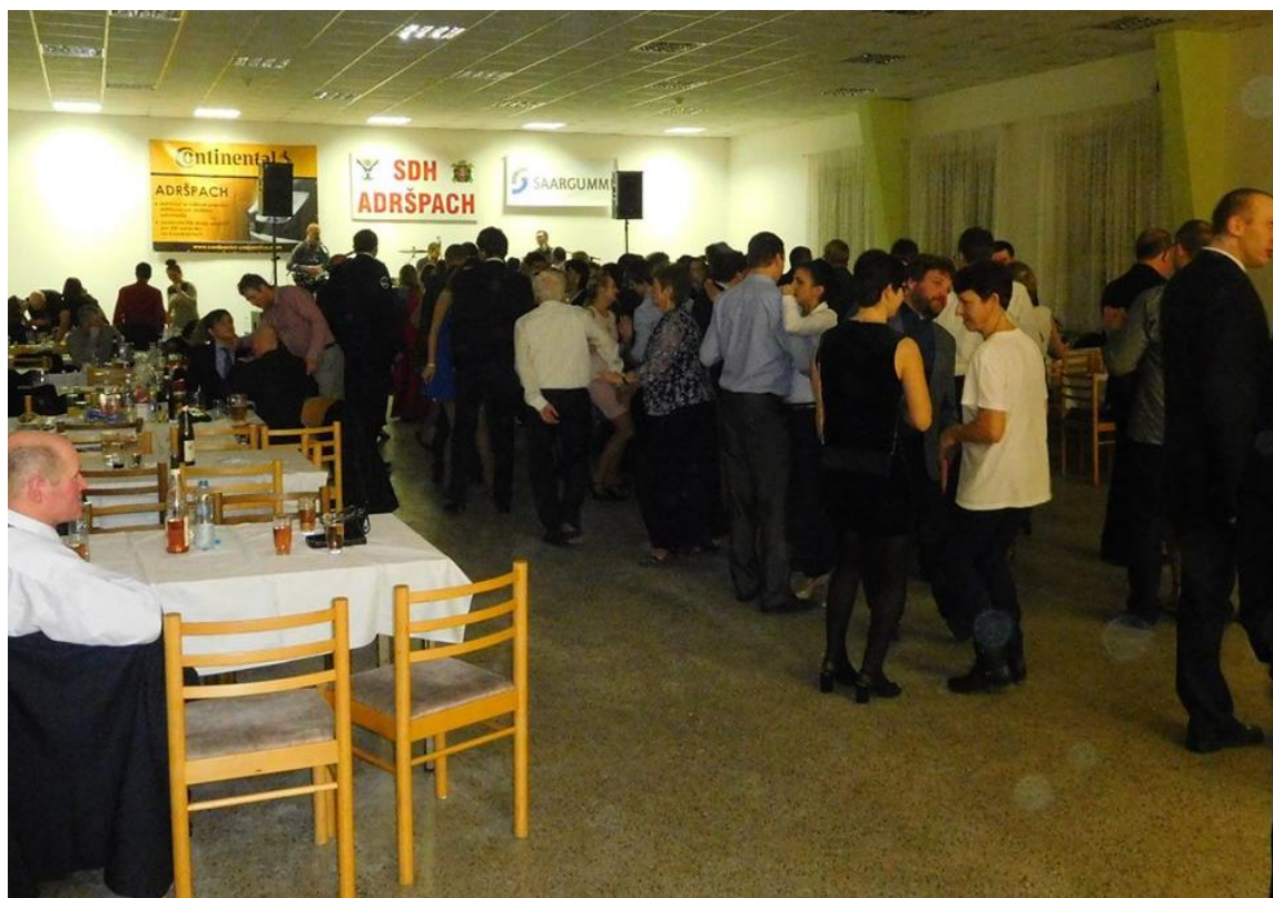
Obrázek 6 – Taneční parket na hasičském plese