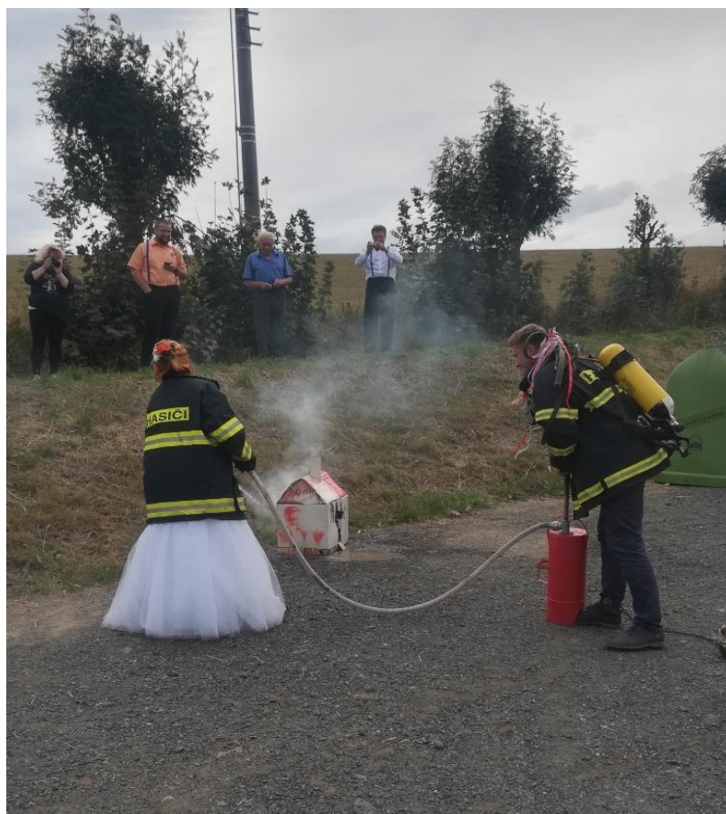
Obrázek č. 4 – Zásah na svatbě jedné členky sboru