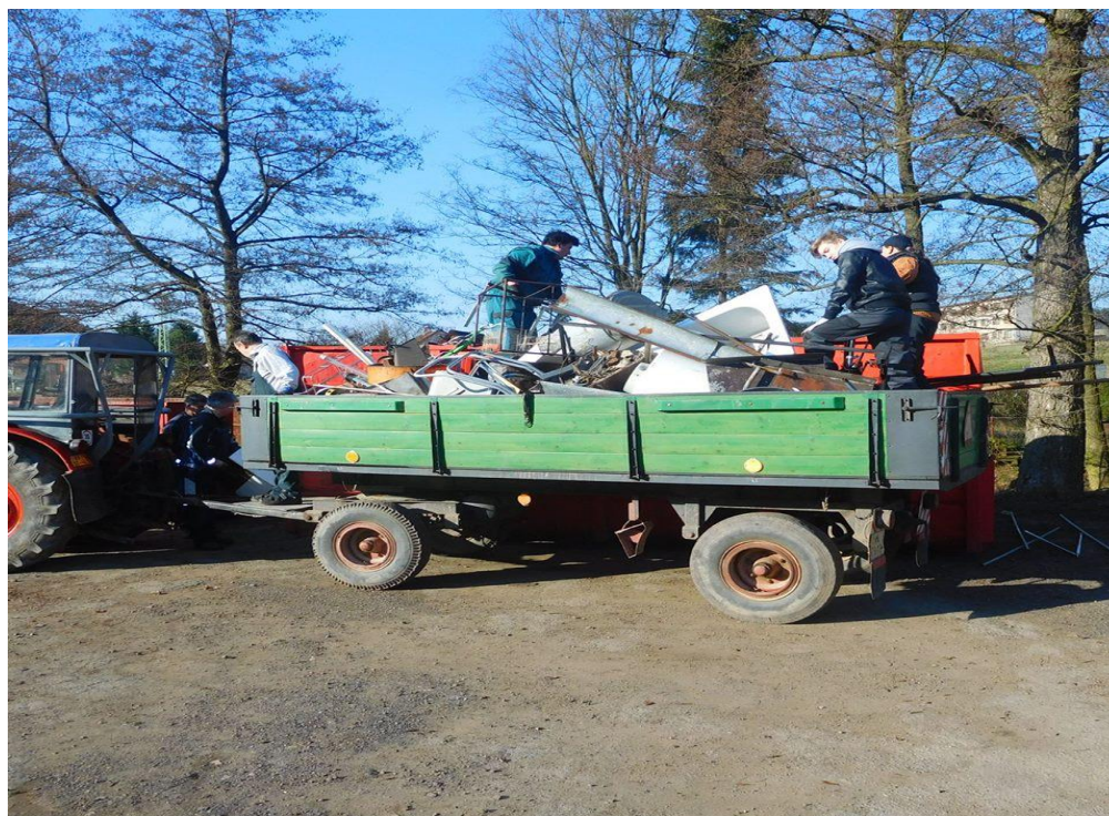
Obrázek 2 – Sběr železného odpadu