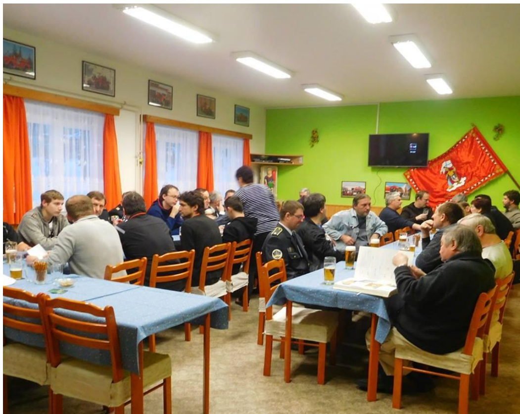
Obrázek 1 – Zasedání na Valné hromadě v klubovně sboru