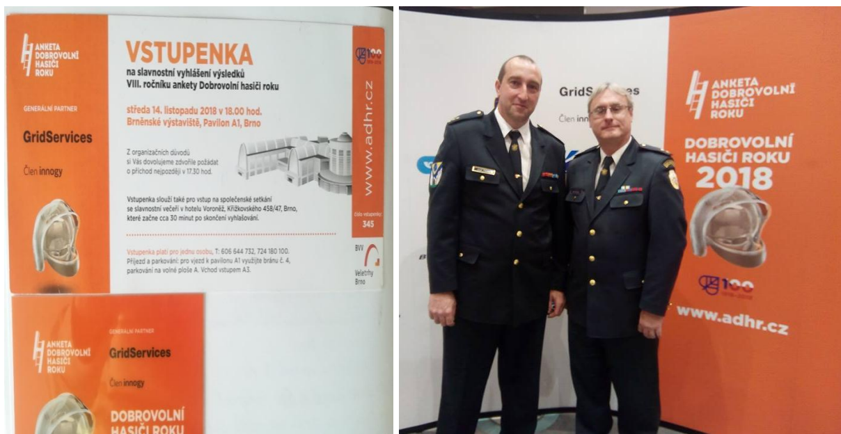
Obrázek 3 – Účast na galavečeru Ankety dobrovolných hasičů roku