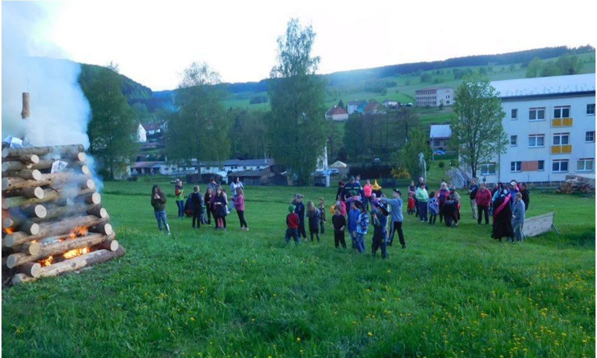
Obrázek 7 – Zapálení hranice na čarodějnicích