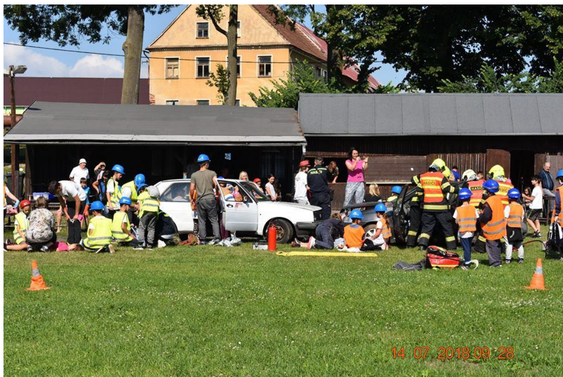
Obrázek 10 – Dětský hasičský tábor Soptík: fingování nehody a nácvik poskytnutí první pomoci