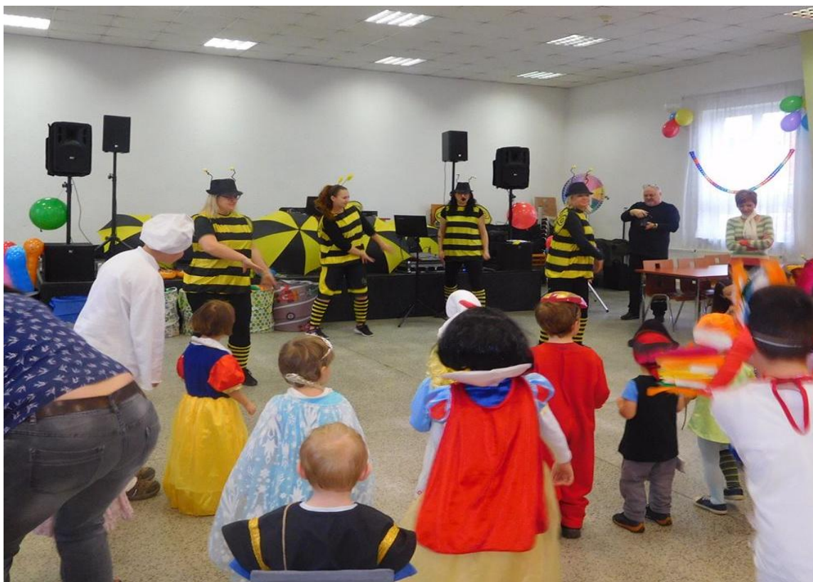
Obrázek 8 – Animační program na dětském dni