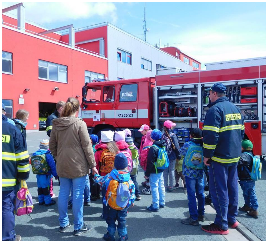
Obrázek 9 – Den dětí: výlet s mateřskou školkou k profesionálním hasičům do Hradce Králové