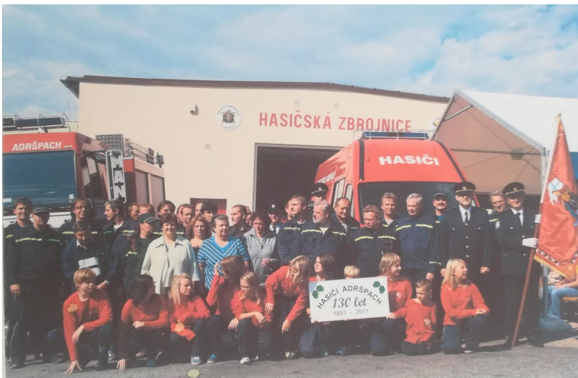
Obrázek č. 5 – Oslava 130. let od založení sboru: nástup členů sboru v uniformách a s vlajkou sboru před hasičskou zbrojnicí