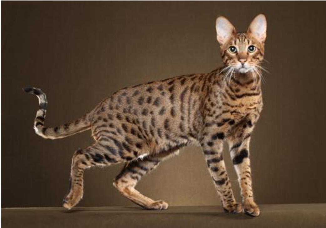
Obrázek 2: Kočka Savannah (Carey, 2018)

Dále díky křížení kočky domácí známe například hybridy kočky divoké ( Felis silvestris ) nebo kočku bengálskou, která má původ u kočky leopardí ( Prionailurus bengalensis ) (Gabryš et al., 2021).