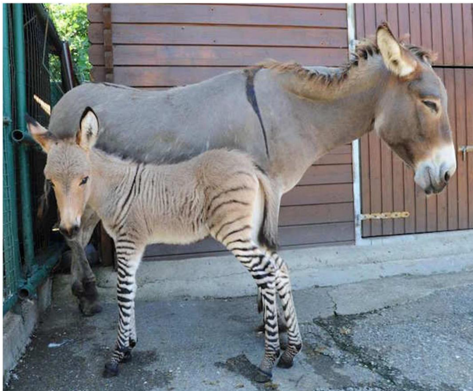
Obrázek 3: Zebroid s oslicí (Massimo, A., Iannuzzi, A., et al. 2017)

Pokud se spáří zebra s oslem ( Equus asinus ) narodí se tzv. „zonkey“, „zedonk“ čili „dokra“ (Patel, 2014). V roce 1913 proběhla hybridizace u zebry Grévyho s oslem (Gabryš et al., 2021). V současné době existuje několik kříženců po celém světě, přičemž nejbližší žije v záchraném centru ve Florencii. Hybridy mají světle šedé zbarvení s výraznými pruhy na nohou a hlavu osla (Iannuzzi et al., 2017).