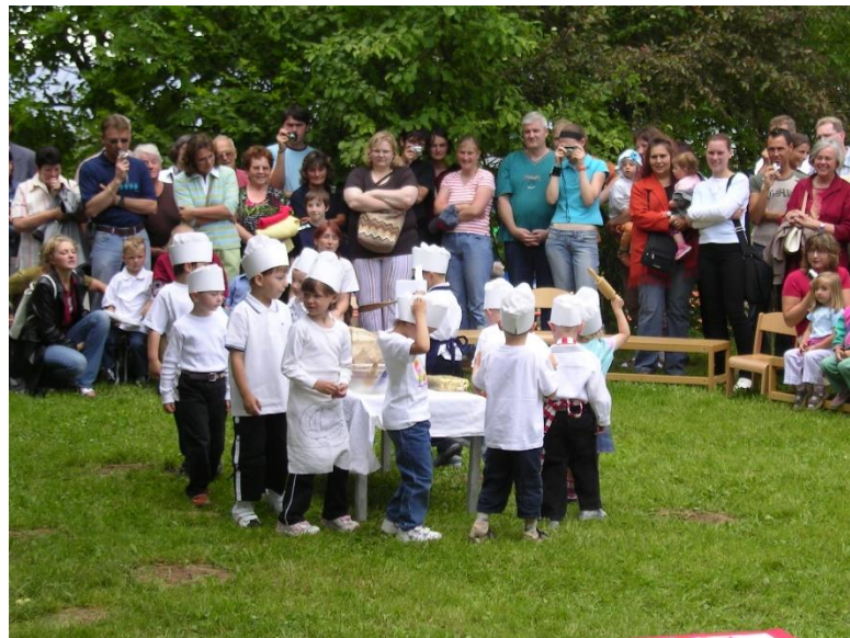
(Fotka z německé mateřské školy)

Výhod je určitě z mého pohledu mnoho. Samotná výhoda je ta, že ovládám druhý jazyk na úrovni roditelého mluvčího, což mi otevírá v budoucnu mnoho dveří. Díky tomu, že umím německy na této úrovni, jsem udělala státní maturitní zkoušku z němčiny, udělala jsem si jazykové diplomy a účastnila se mnoha soutěží v Goethe institutu. V pracovním životě je tato znalost samozřejmě také výhodou, již od osmnácti let doučuji děti německý jazyk a pracuji jako lektorka německého jazyka v jazykové škole. Ráda bych také měla možnost uplatnit mé znalosti v oboru učitelství v mateřských školách. Další výhodou, kterou pro mě bilingvní výchova měla, bylo rychlé učení dalších jazyků, nikdy jsem s učením jazyků neměla problém a naučila jsem se také bez problémů anglický jazyk.