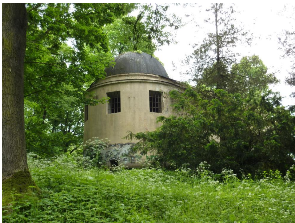
Pohled z Michalského výpadu