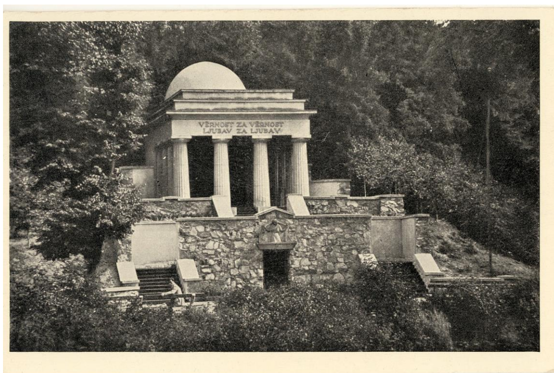
Fotografie mauzolea z 30. let