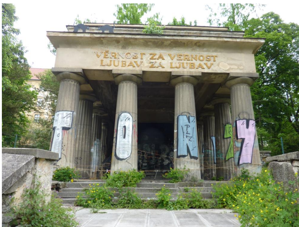
Pohled od Mlýnského potoka