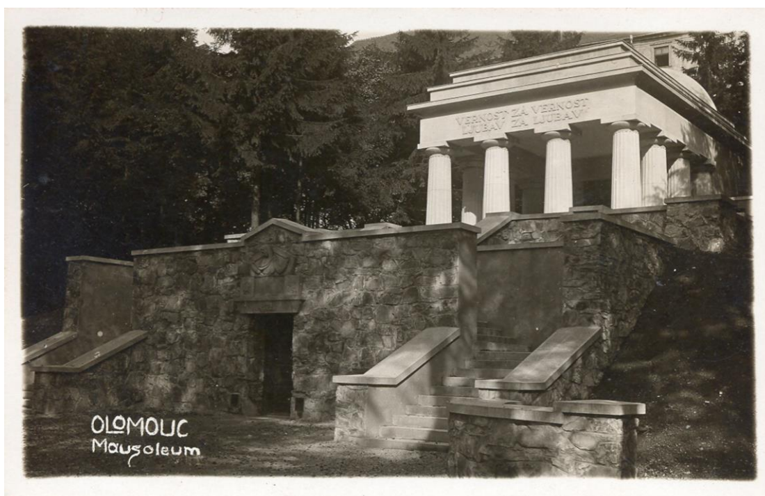
Fotografie mauzolea ve 20. letech