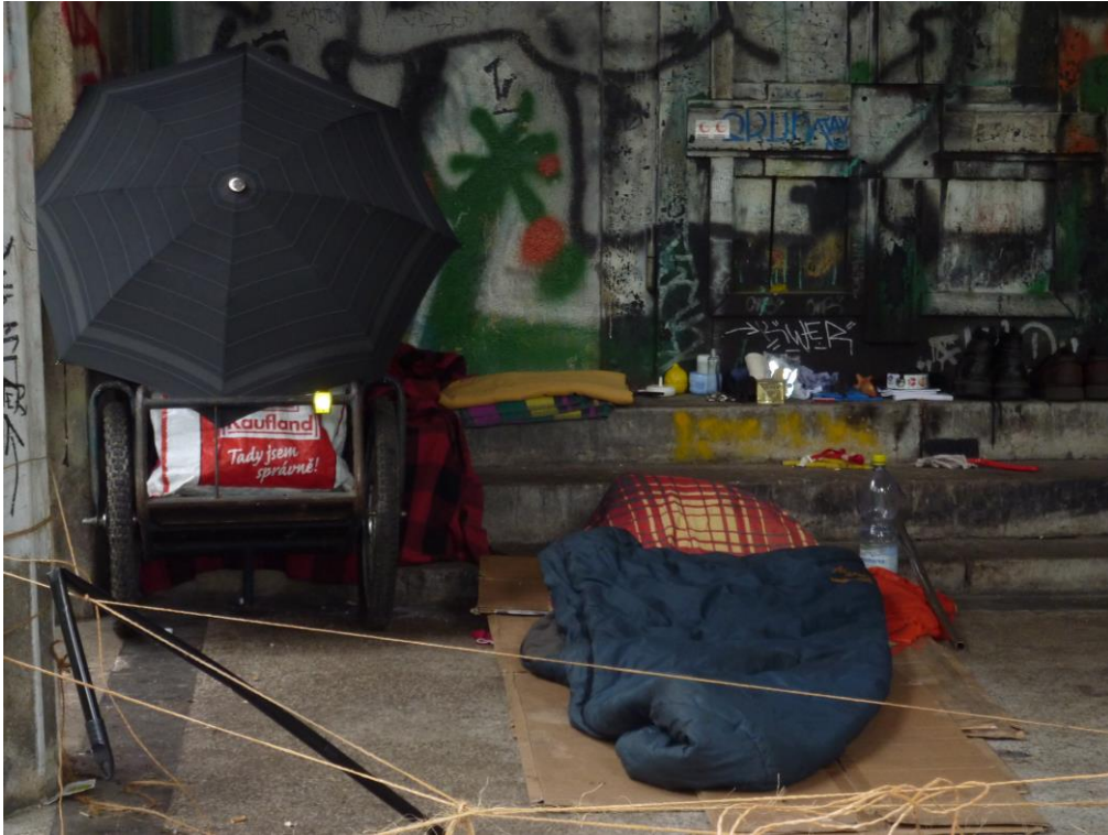
Vstup do mauzolea