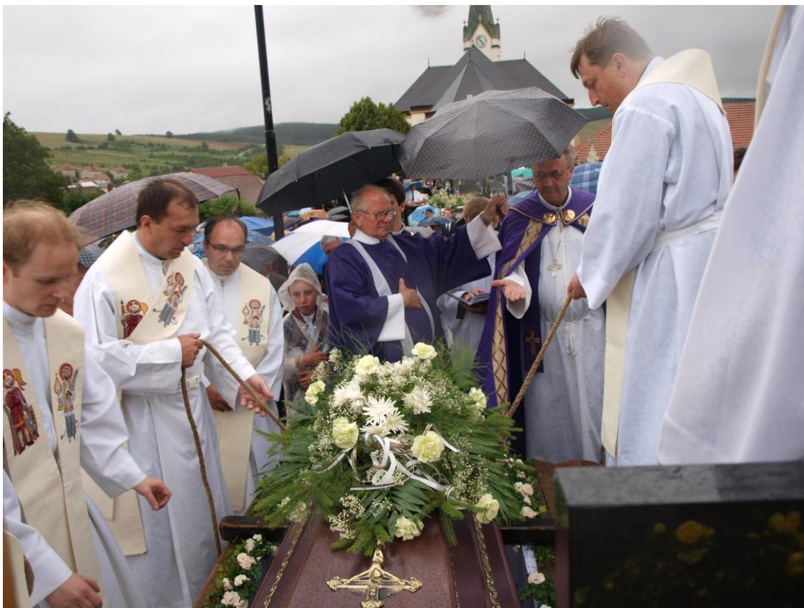
Z pohřbu ve Strání, 18. července 2009