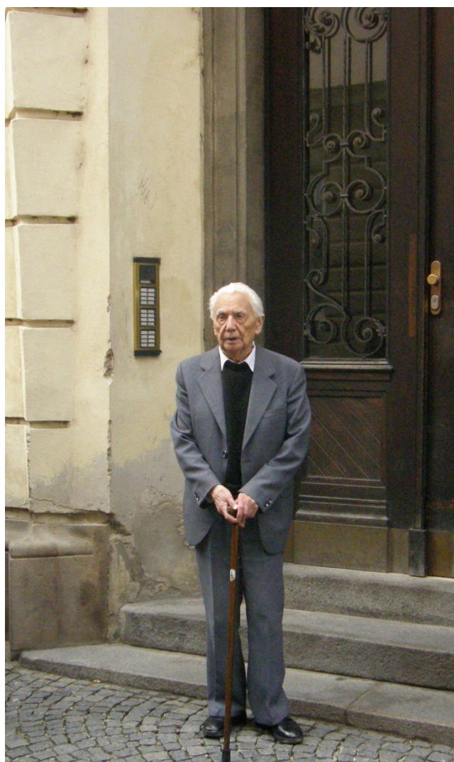
Před svým bytem v Olomouci, 15. listopadu 2008