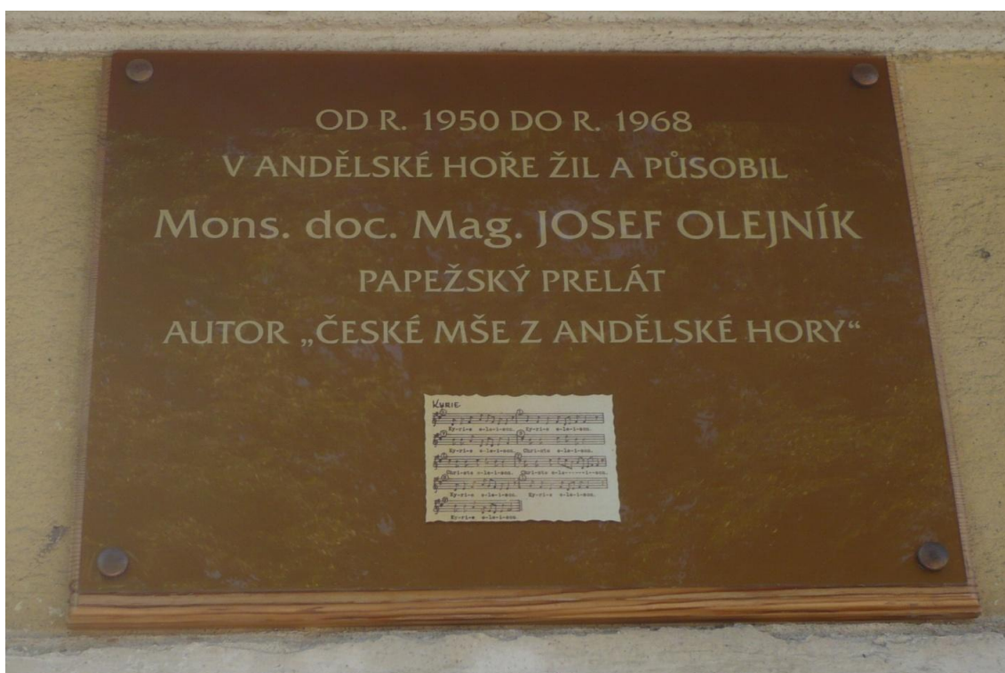
Pamětní deska na kostele v Andělské Hoře, odhalena 5. září 2010