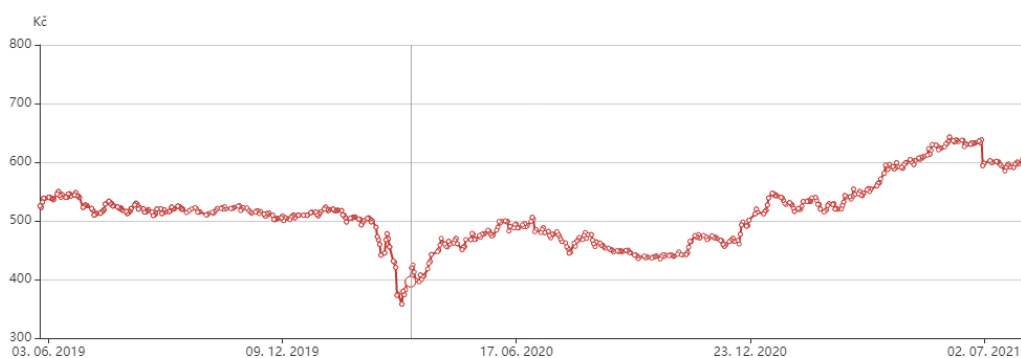
Graf 2 Vývoj cen akcií společnosti ČEZ