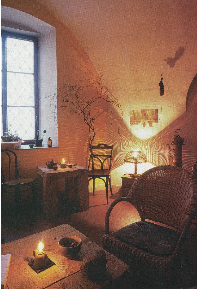
4/ Univerzitní klub – čajovna Bludný kámen, 90. léta 20. století, pohled do prostoru klubu, Univerzitní klub – čajovna Bludný kamen v Opavě.