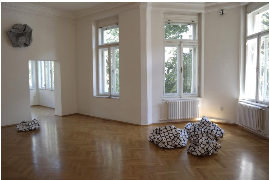
2/ Esther Stocker, 2016, pohled do expozice, Výstavní síň Sokolská 26 v Ostravě.