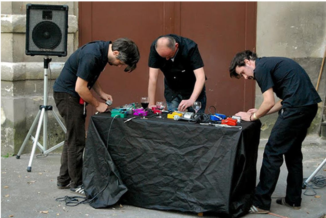
8/ Rafani, 2010, performance, Galerie Cella v Opavě.