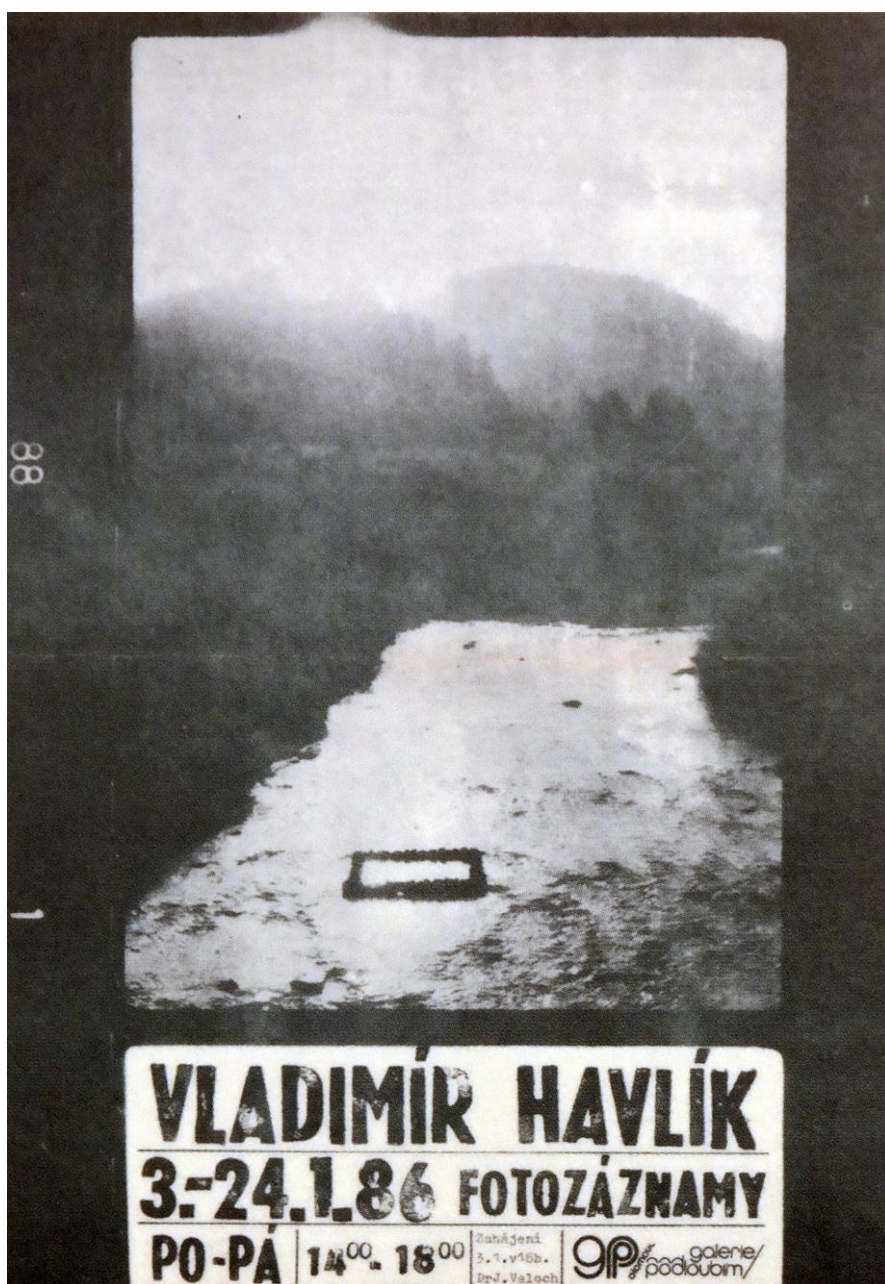
3/ Oldřich Šambera, Plakát pro výstavu Vladimíra Havlíka, 1986, Muzeum umění Olomouc.