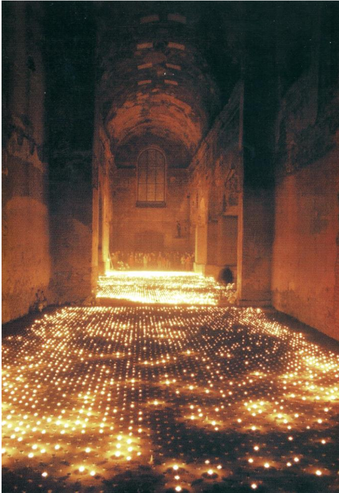
5/ Jan Lastomírsky, Světelný koberec, 2000, pohled na instalaci, Kostel sv. Václava v Opavě.