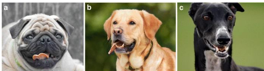
Obr. 1 Fotografie zachycující zástupce brachycefalických (A), mezocefalických (B) a dolichocefalických (C) plemen psů (Byosiere et al. 2018).

Rozsah zorného pole se u psů liší podle plemene kvůli výrazným rozdílům v umístění očí na lebce (Murphy & Pollock 1993). U brachycefalických plemen jsou oči více laterálně umístěny a rozsah pole binokulárního vidění se pravděpodobně liší od pole binokulárního vidění mezocefalických a dolichocefalických plemen, u nichž jsou oči orientovány více dopředu (viz obr. 1). Také délka čenichu může ovlivňovat velikost pole binokulárního vidění (Miller & Murphy 1995; Evans & De Lahunta 2013).