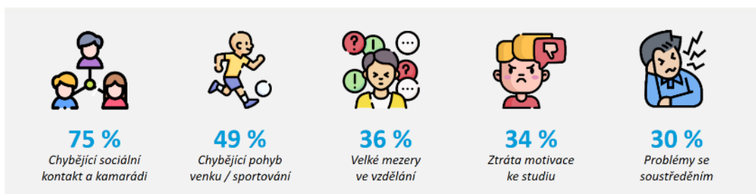
Obrázek 1: Pět nejčastějších problémů, které rodiče považují z hlediska vzdělávání svých dětí za nejzávažnější v souvislosti s pandemií covid-19