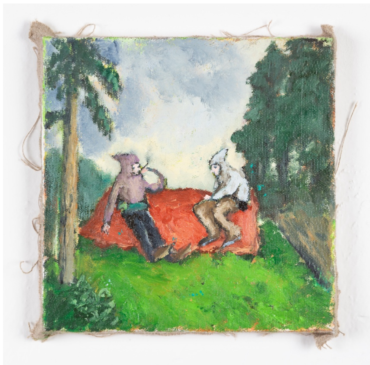
Na výhledu , olej na plátně, 20 x 20 cm, 2020