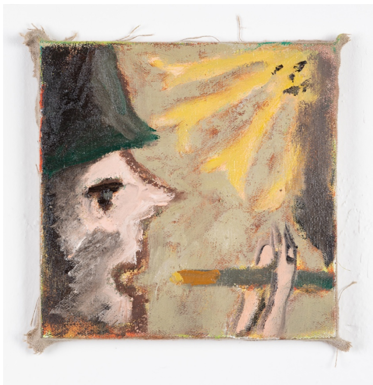
Pauza , olej na plátně, 20 x 20 cm, 2020