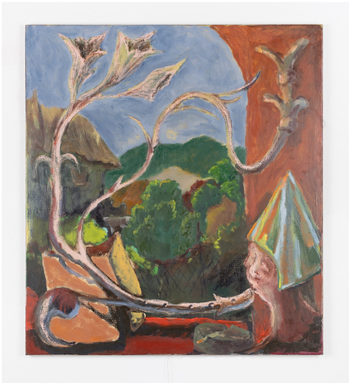
Birthday party , olej na plátně, 100 x 110 cm, 2020