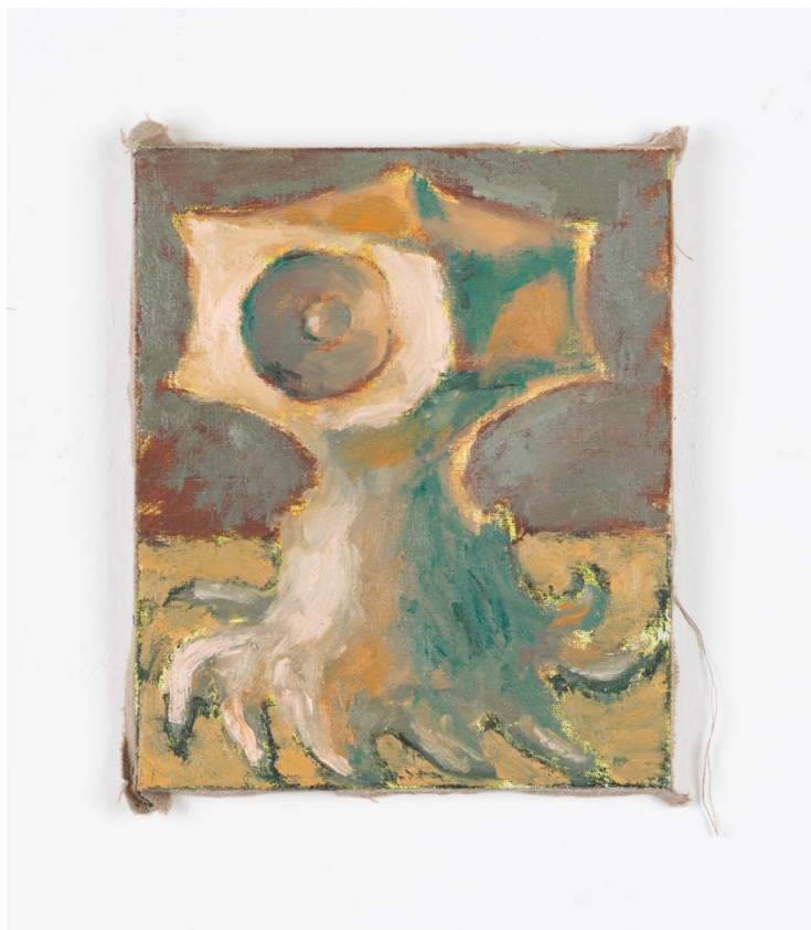
Soundworm , olej na plátně, 25 x 30 cm, 2020