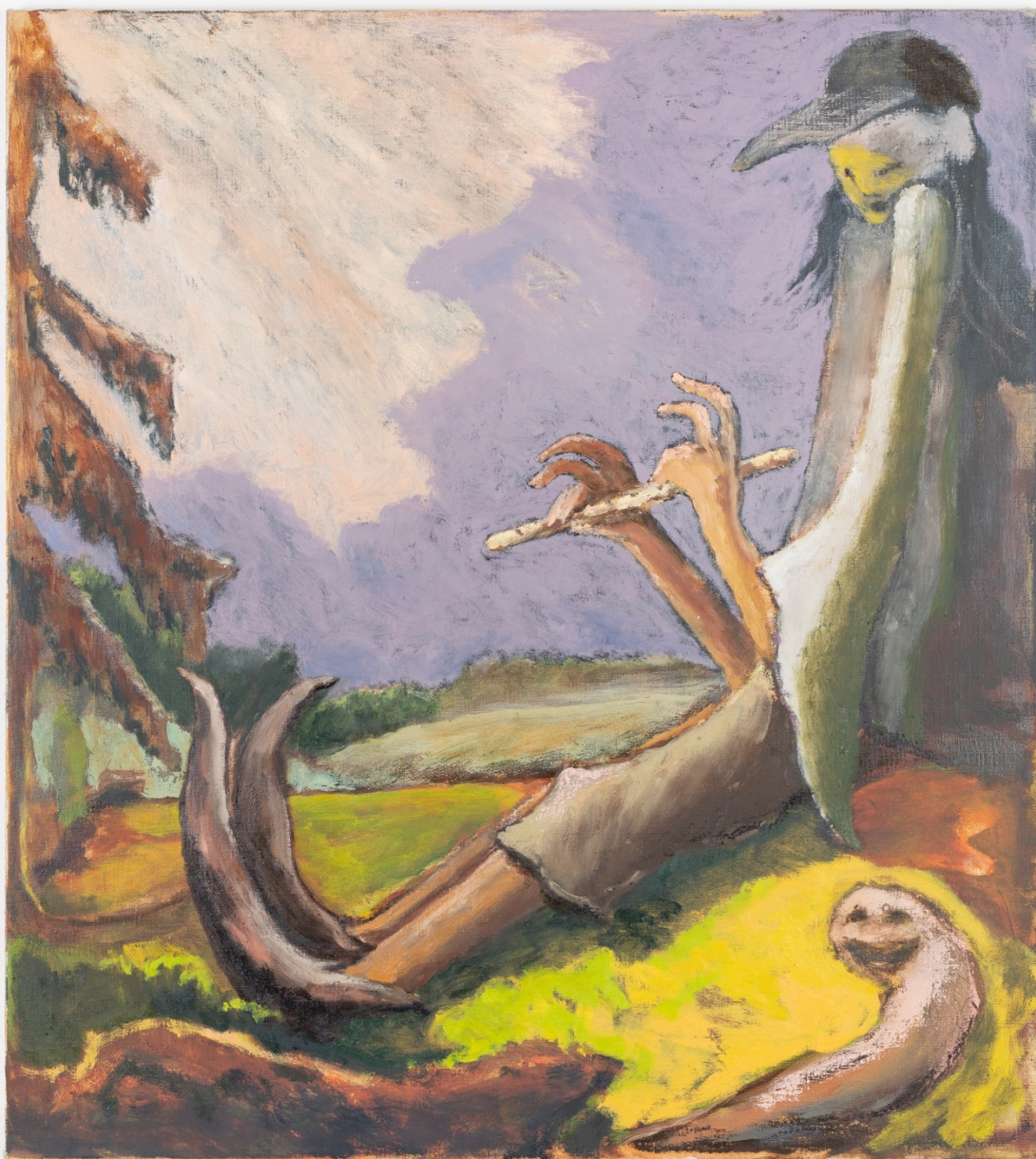
Pištec , olej na plátně, 100 x 110 cm, 2020