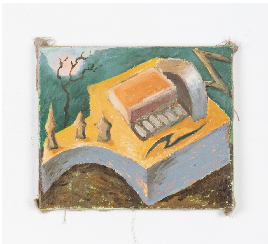
Niněra , olej na plátně, 30 x 25 cm, 2020