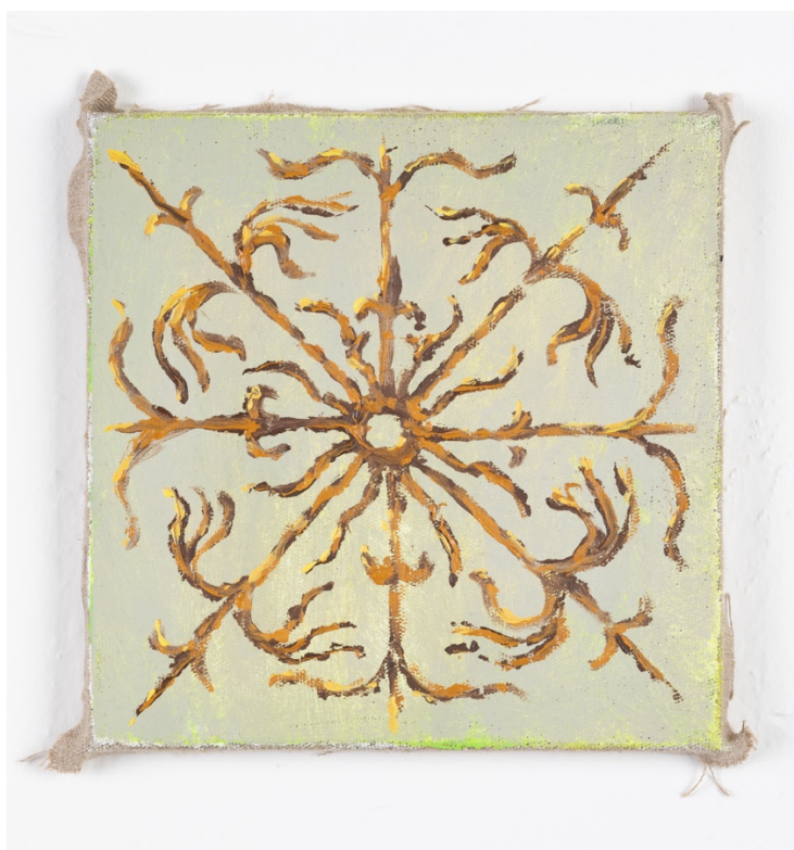
Monstrance , olej na plátně, 20 x 20 cm, 2020