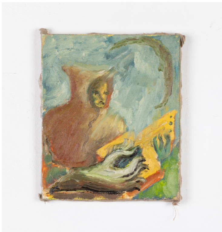
Midnight melodies , olej na plátně, 25 x 30 cm, 2020