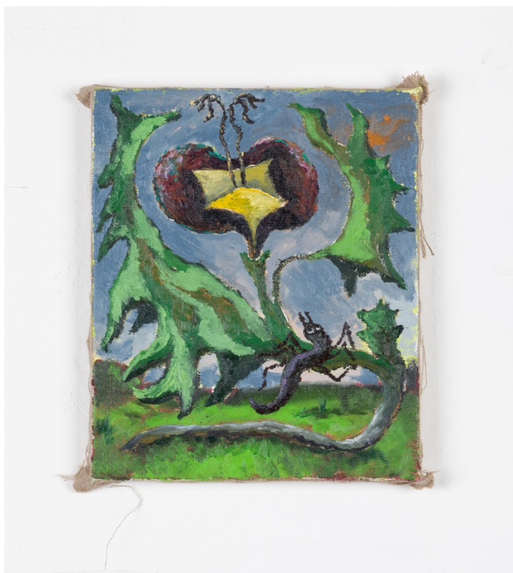
Swampy alliance , olej na plátně, 25 x 30 cm, 2020