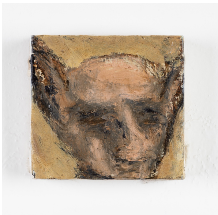
Skřet , olej na plátně, 15 x 15 cm, 2020