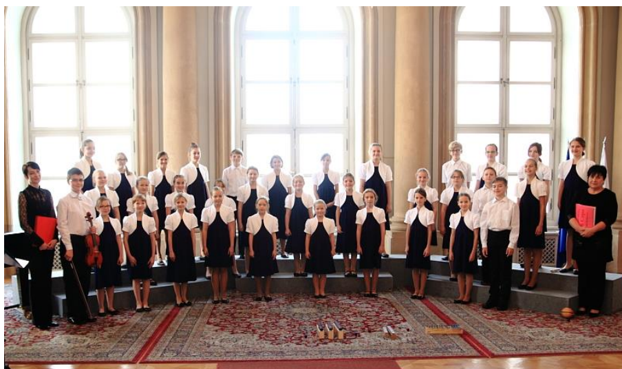
Obr. 5: Dětský pěvecký sbor Da Capo