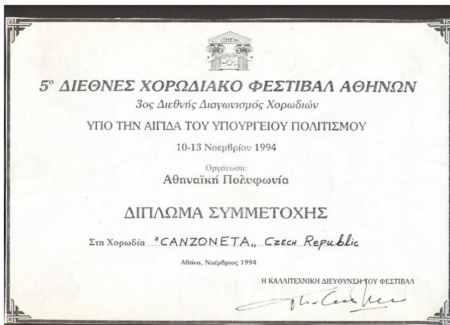
Obr. 6: Diplom ze soutěže v Řecku (1994)