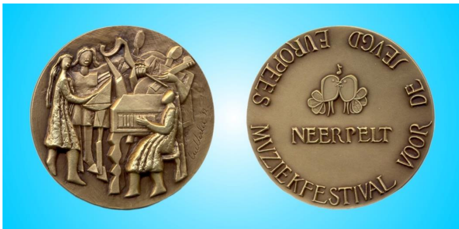
Obr. 7: Cena ze soutěže v Belgii (2006)