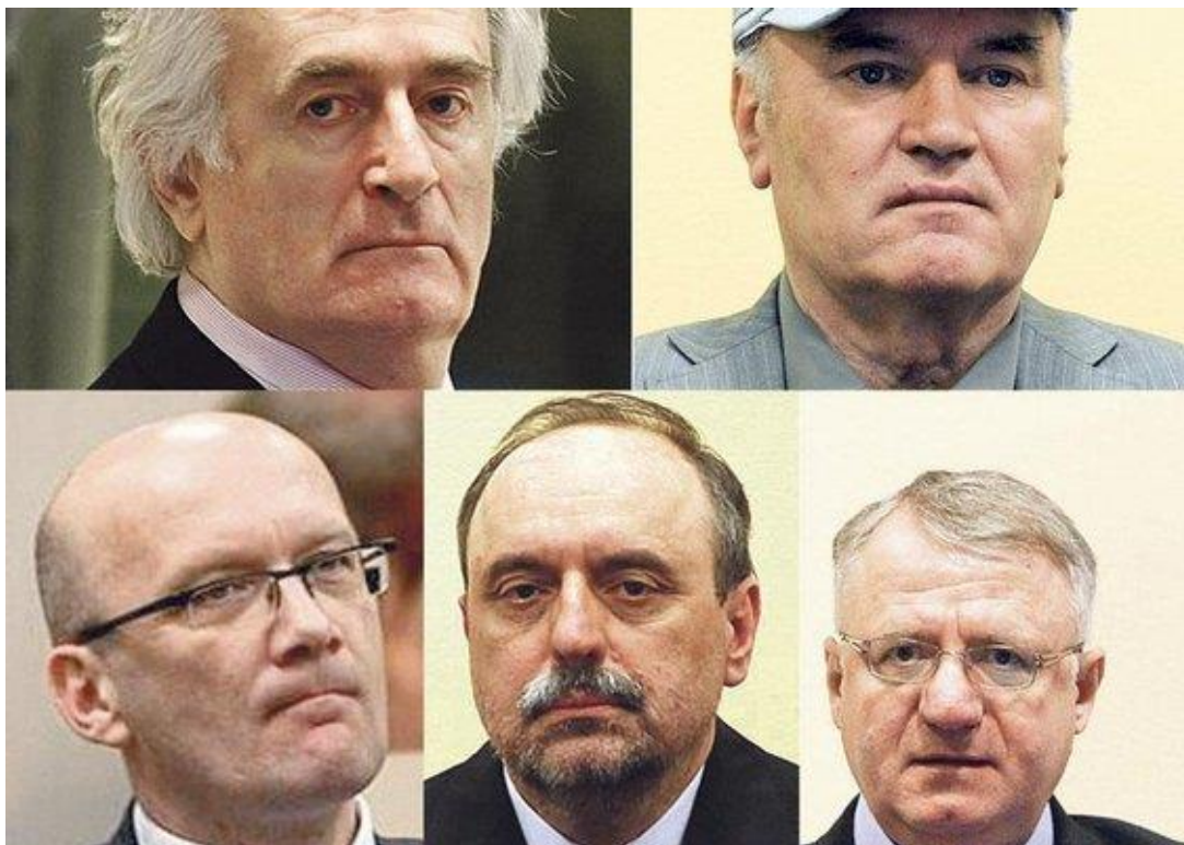
Obrázek 1- Hlavní obžalovaní, kteří čekají na rozsudek ICTY: Radovan Karadžić a Ratko Mladić (nahore zleva), Jadranko Prlić, Goran Hadžić a Vojislav Šešelj (dole zleva)