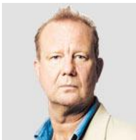
Zdroj: Ed Vulliami - Údobí pekla