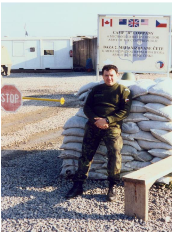
Obrázek 14: Oficiální označení SFOR