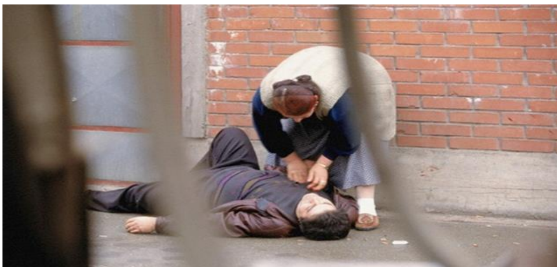
Obrázek 42. První den genocidy, 31 března 1992. Bijeljina