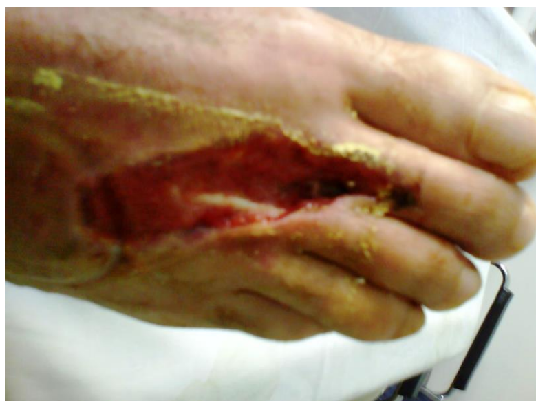
Obrázek 43. Mé zranění (Průstřel chodidla)