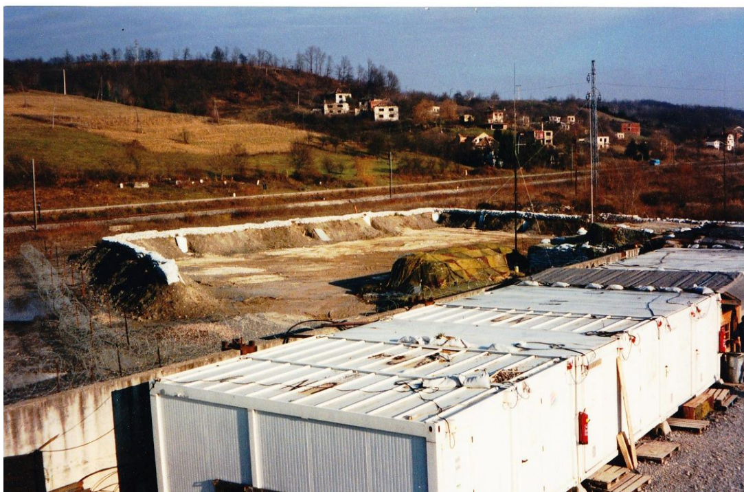
mise SFOR – 1997-1998. 2 mechanizovaná brigáda.