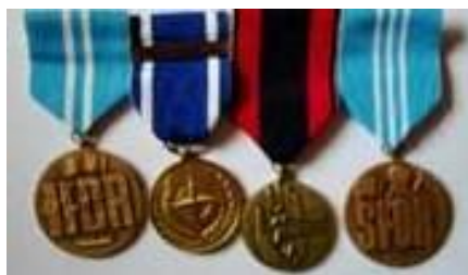
Obrázek 48. Medaile udělené příslušníkům mise IFOR, SFOR