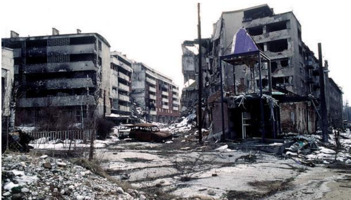
Obrázek 36. Mostar