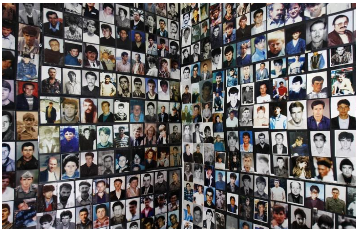
Obrázek 38. Zeď ztracených. (foto lidí, jenž jsou pohřešováni – Sarajevo)