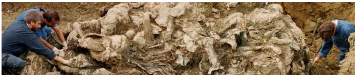
Obrázek 41. Společný masový hrom ve Srebrenici