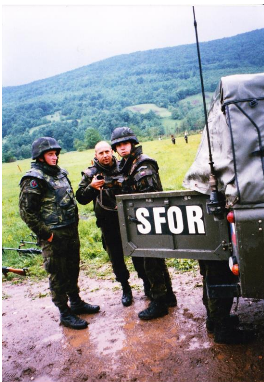
Obrázek 17: Naše auto najelo těsně vedle miny