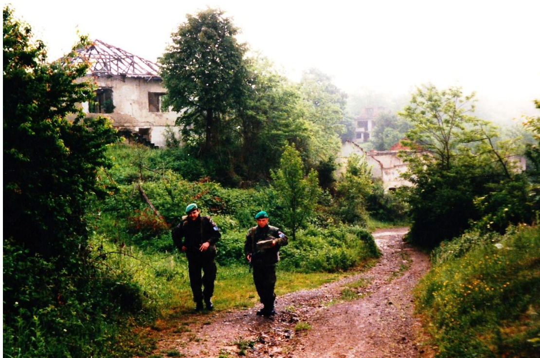
Obrázek 22: Pěší patrola v prostorech zájmu.