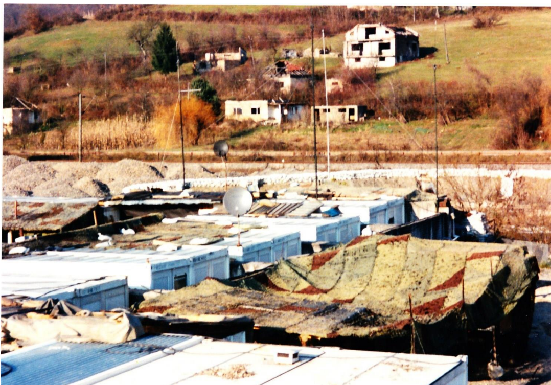
Obrázek 21: Základna roty „B“ na Blagaj Japra.