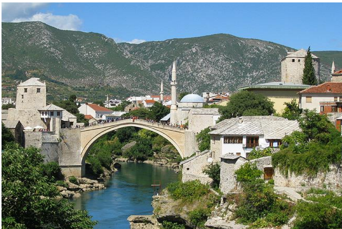
Obrázek 39. Most ve Starém Mostaru