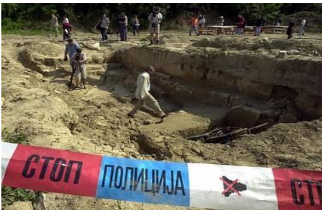
Obrázek 40. Otvírání masového hrobu u Srebrenice