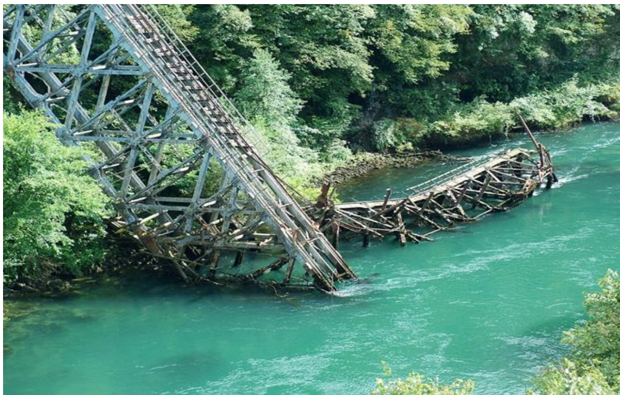
Obrázek 37. Zničený Jablanický most