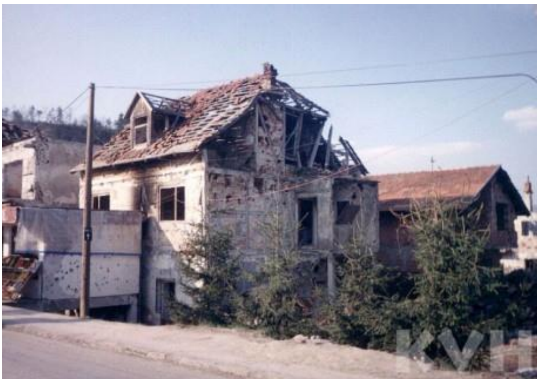
Obrázek 29: Bosanská Krupa