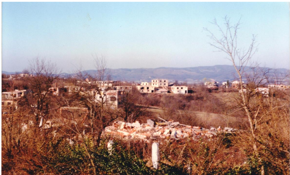
Obrázek 32. Hambarine - muslimská část města Priedor