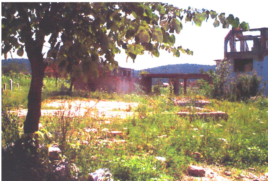
Obrázek 30: Novi Grad