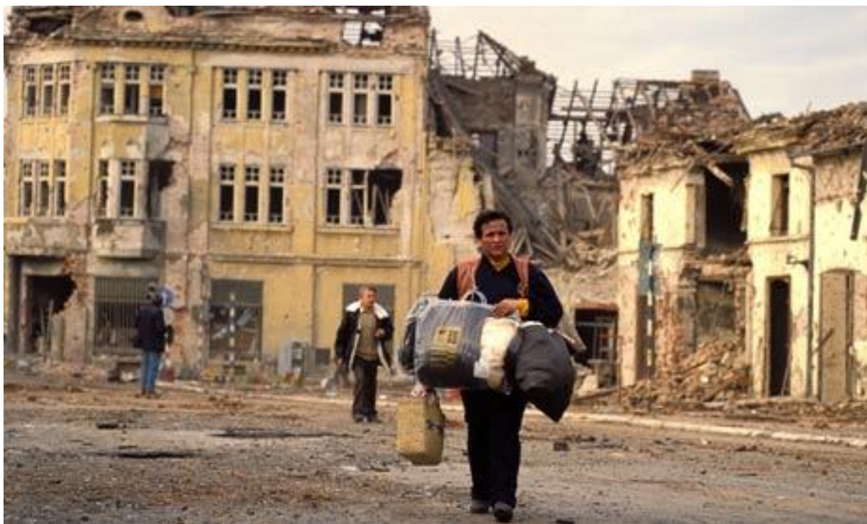
Obrázek 35. Vukovar