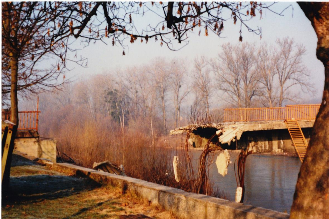
Obrázek 31. Most u města Kněžica