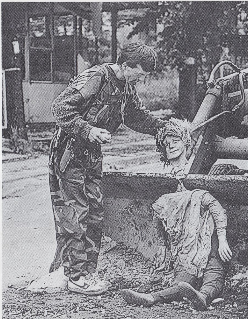
Na silničních zátarasech se za bosenské války často používalo k zastrašení protivníků všelijak uzpůsobených figurín