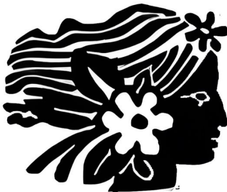
Obrázek 2 Logo České písně