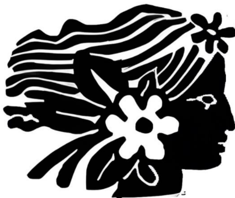
Obrázek 2 Logo České písně