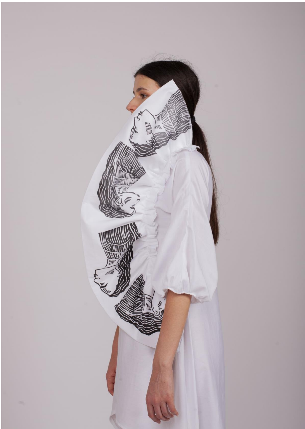
Druhá fáze procesu hledání identity 6, detail linorytového potisku