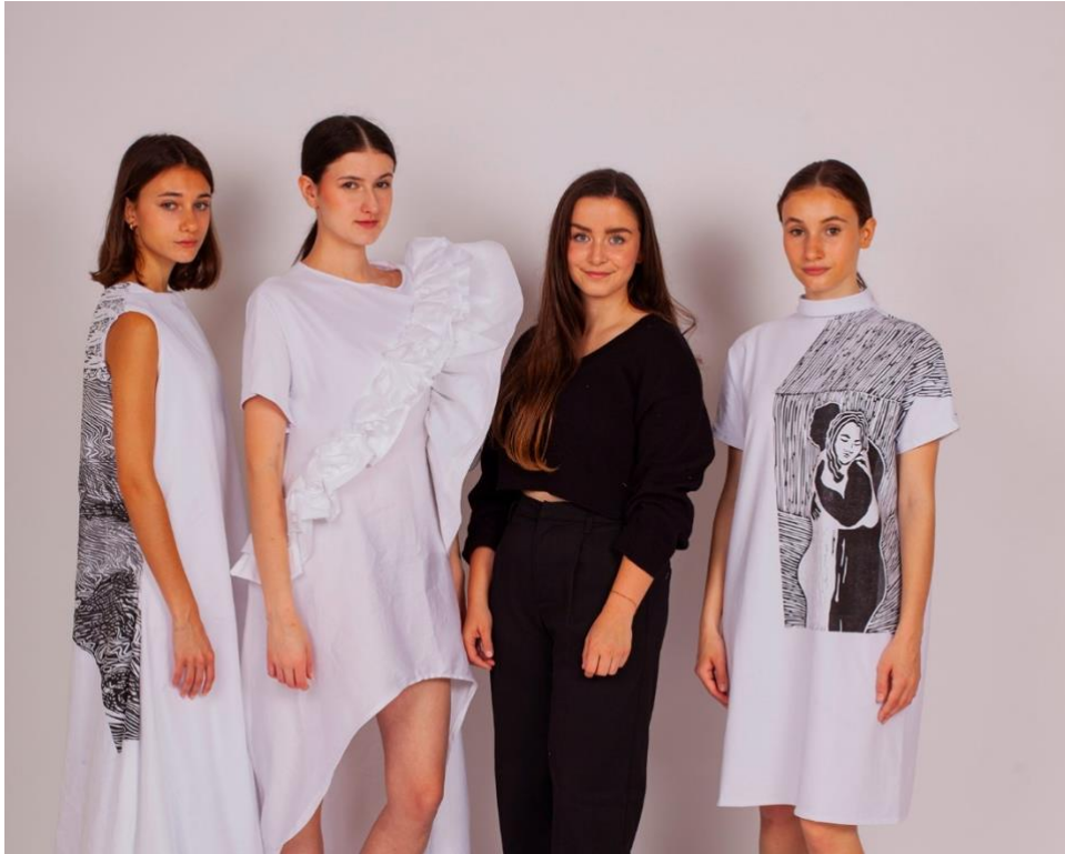
Kolekce tří oděvů – Hledání identity v oděvu a autorka 4 – vlastní zdroj