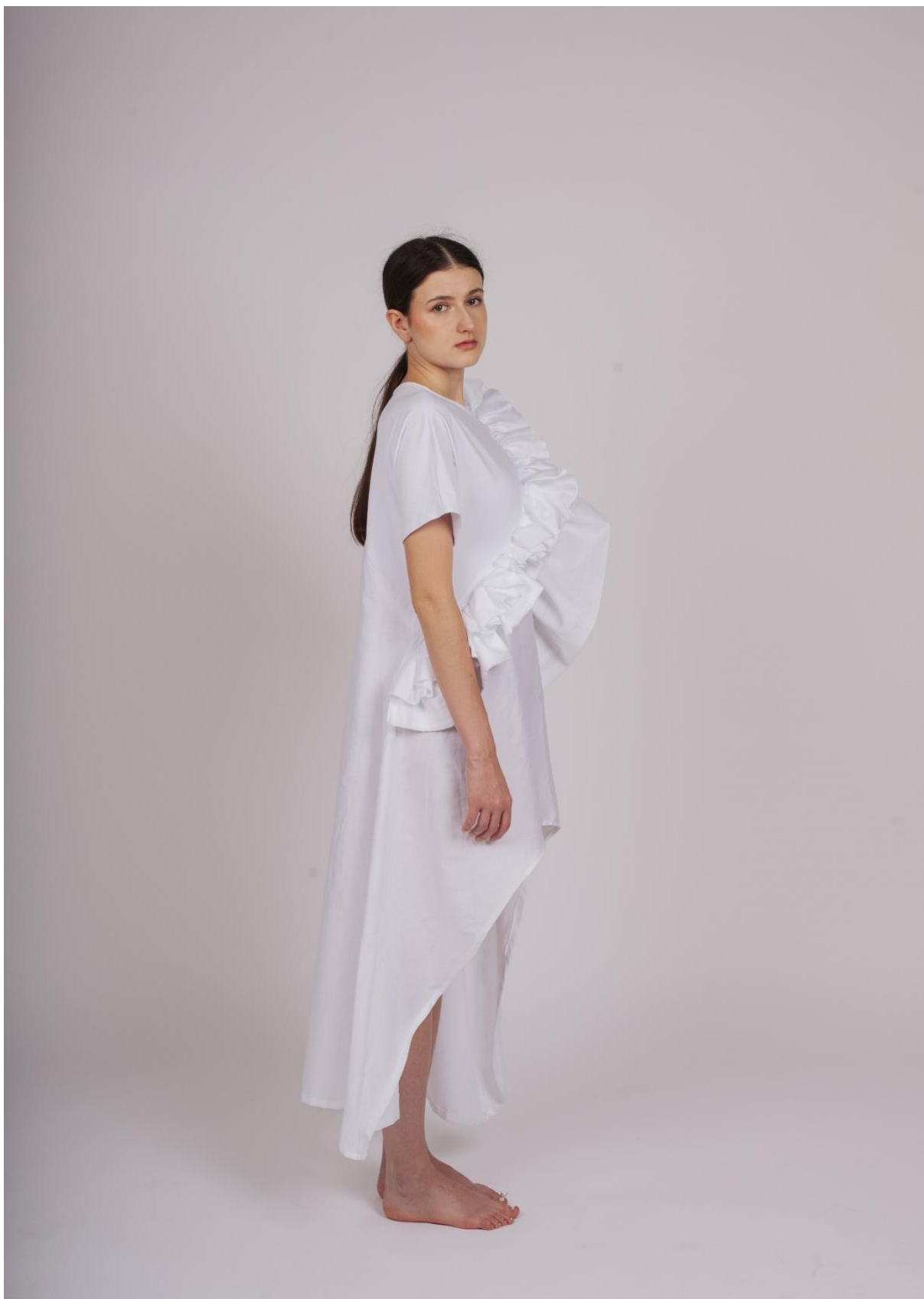
Druhá fáze procesu hledání identity 1, pohled z boku