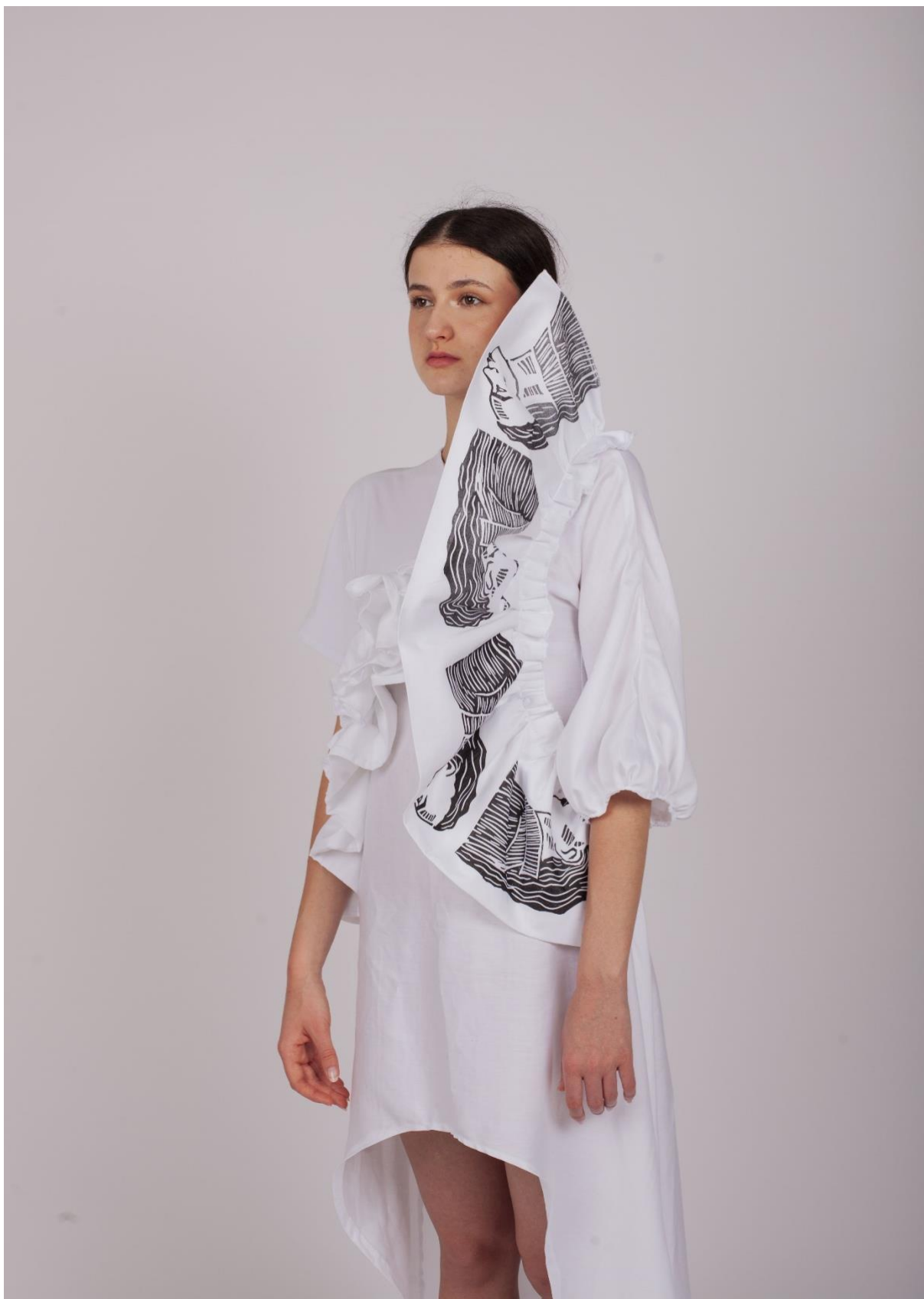
Druhá fáze procesu hledání identity 5, detail linorytového potisku