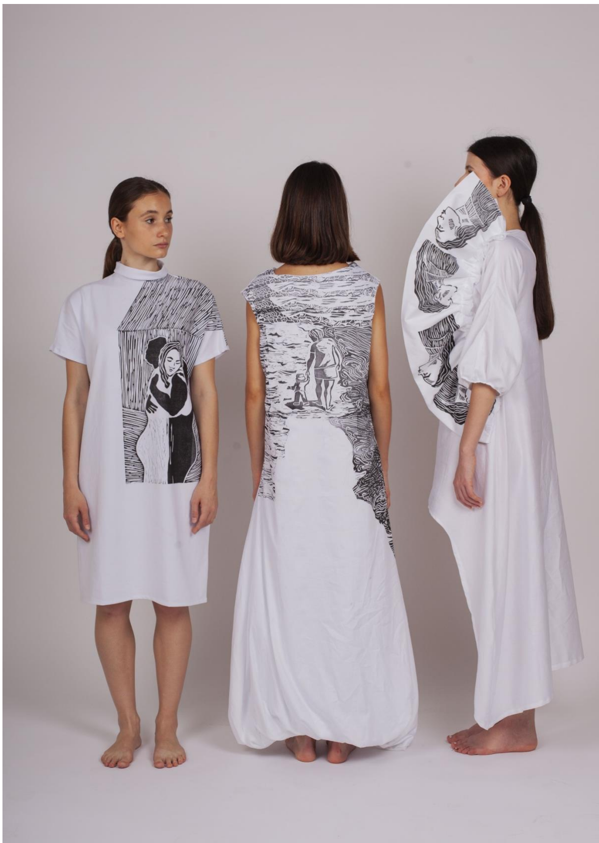
Kolekce tří oděvů – Hledání identity v oděvu 1