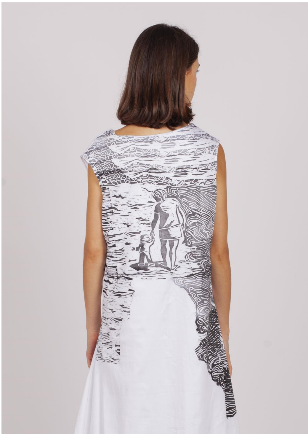
První fáze procesu hledání identity 7, detail linorytového potisku