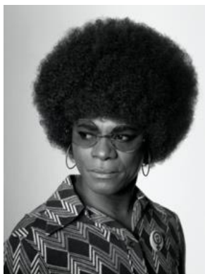
Obrázek 7: Samuel Fosso – African Spirits (2008)

rozhodnutí, ale i vnějších faktorů, nad nimiž nemáme kontrolu. Jeho tvorba představuje zkoumání procesu, jakým si lidé formují svou identitu pomocí různých prostředků. Jeho díla ukazují, že identita je mnohoznačný koncept.