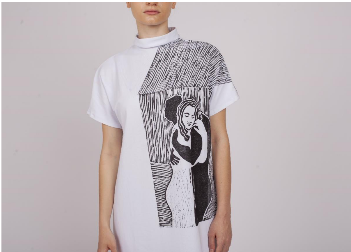
Třetí fáze procesu hledání identity 5