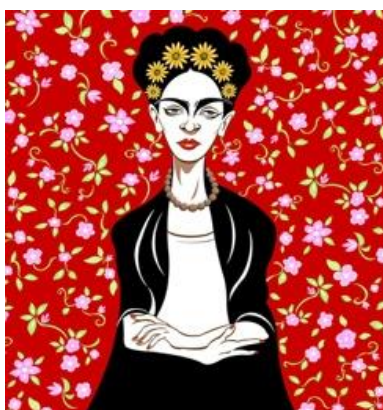
Obrázek 10: Neale Osborne – Portrait of the Mexican artist, Frida Kahlo (2018)

Osbornův přístup k identitě postav se nicméně obvykle více soustředí na realistické a humorné zachycení atmosféry a charakteru městského života. Oba umělci tak přistupují k tématu identity z různých úhlů pohledu, prostřednictvím podobného média. Zatímco Neale Osborne se soustředí na realistické vyobrazení, Catherine Abel se zaměřuje na stylizaci a expresivitu. Oba umělci mají své jedinečné přístupy k uměleckému vyjádření a jejich tvorba je oceňována pro svoji originalitu a kvalitu.