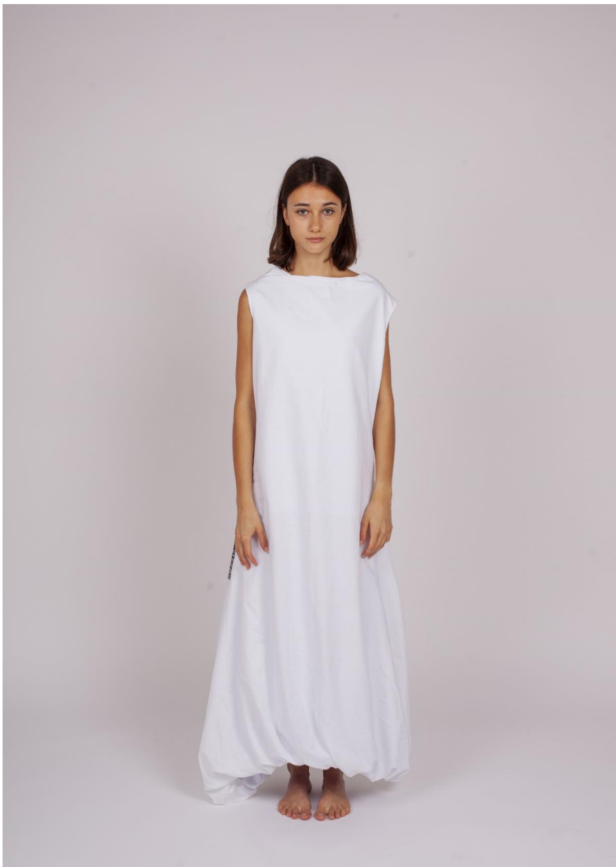
První fáze procesu hledání identity 4