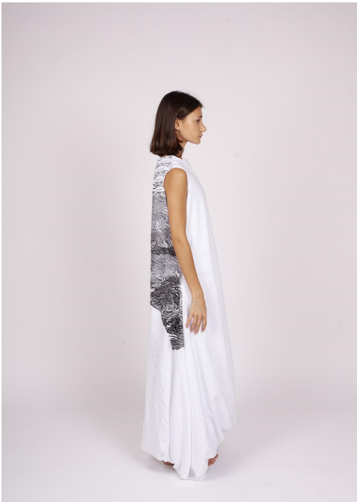
První fáze procesu hledání identity 5, pohled z boku