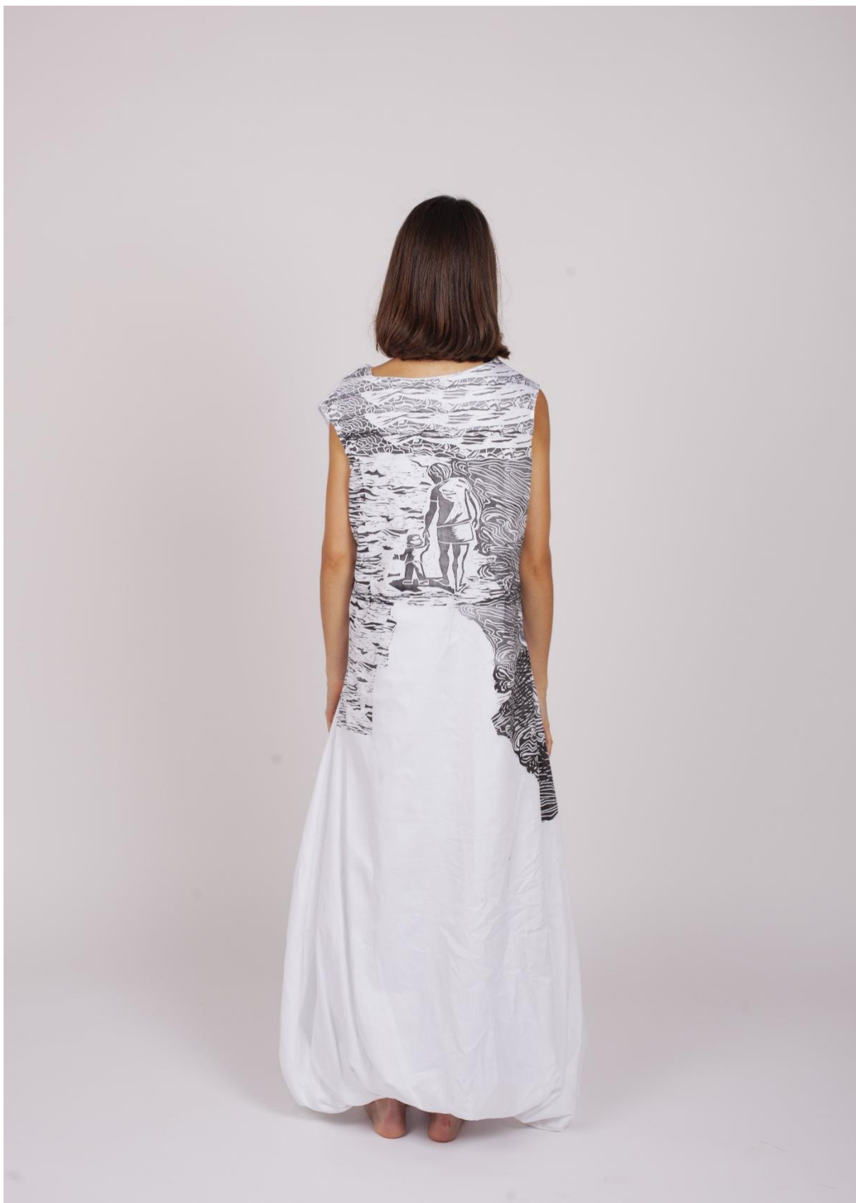
První fáze procesu hledání identity 6, pohled zezadu – vlastní zdroj