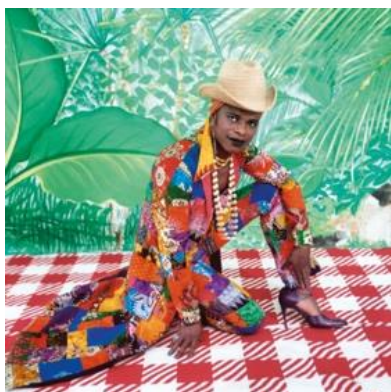
Obrázek 8: Samuel Fosso – TATI (1997)