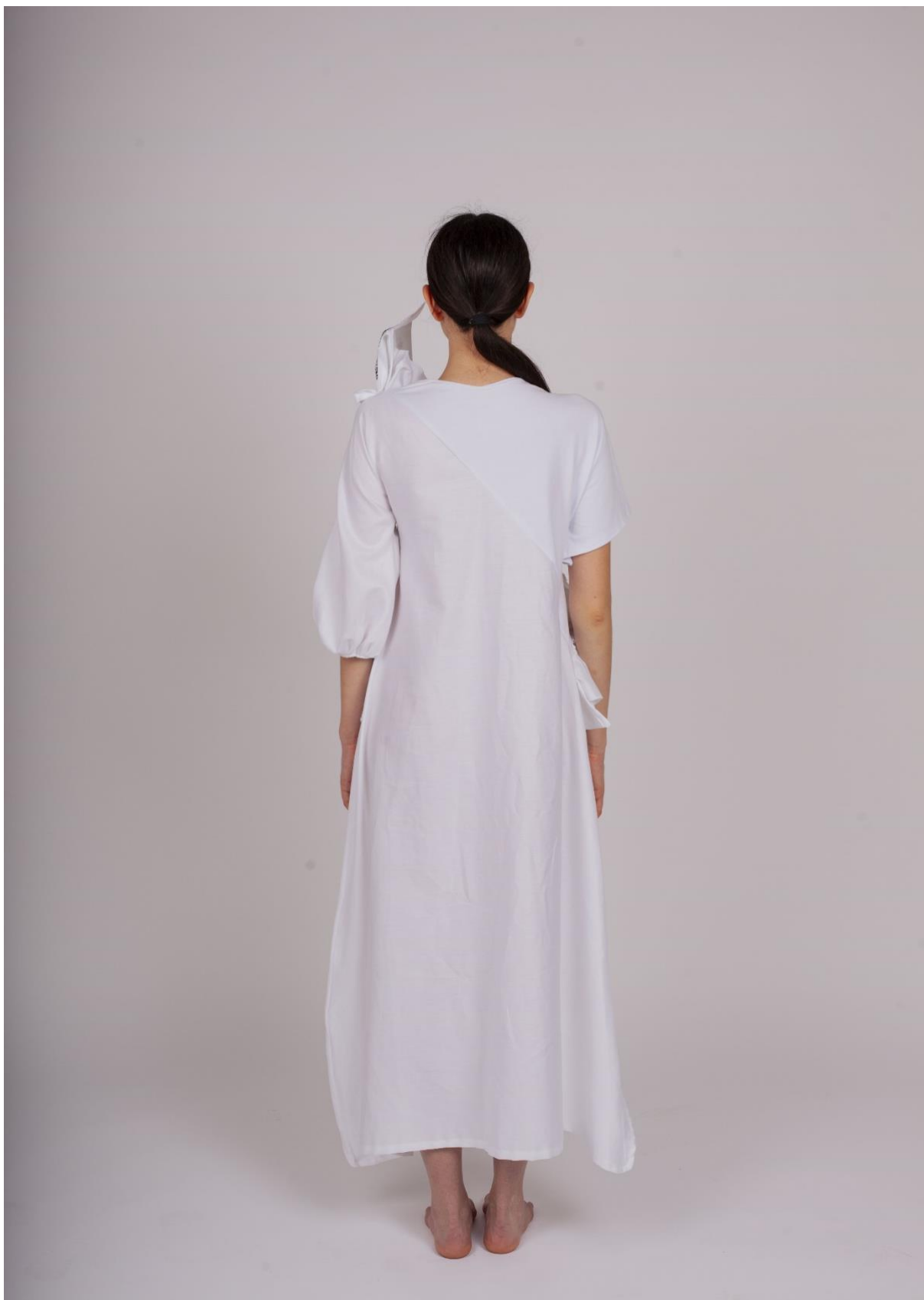
Druhá fáze procesu hledání identity 2, pohled zezadu