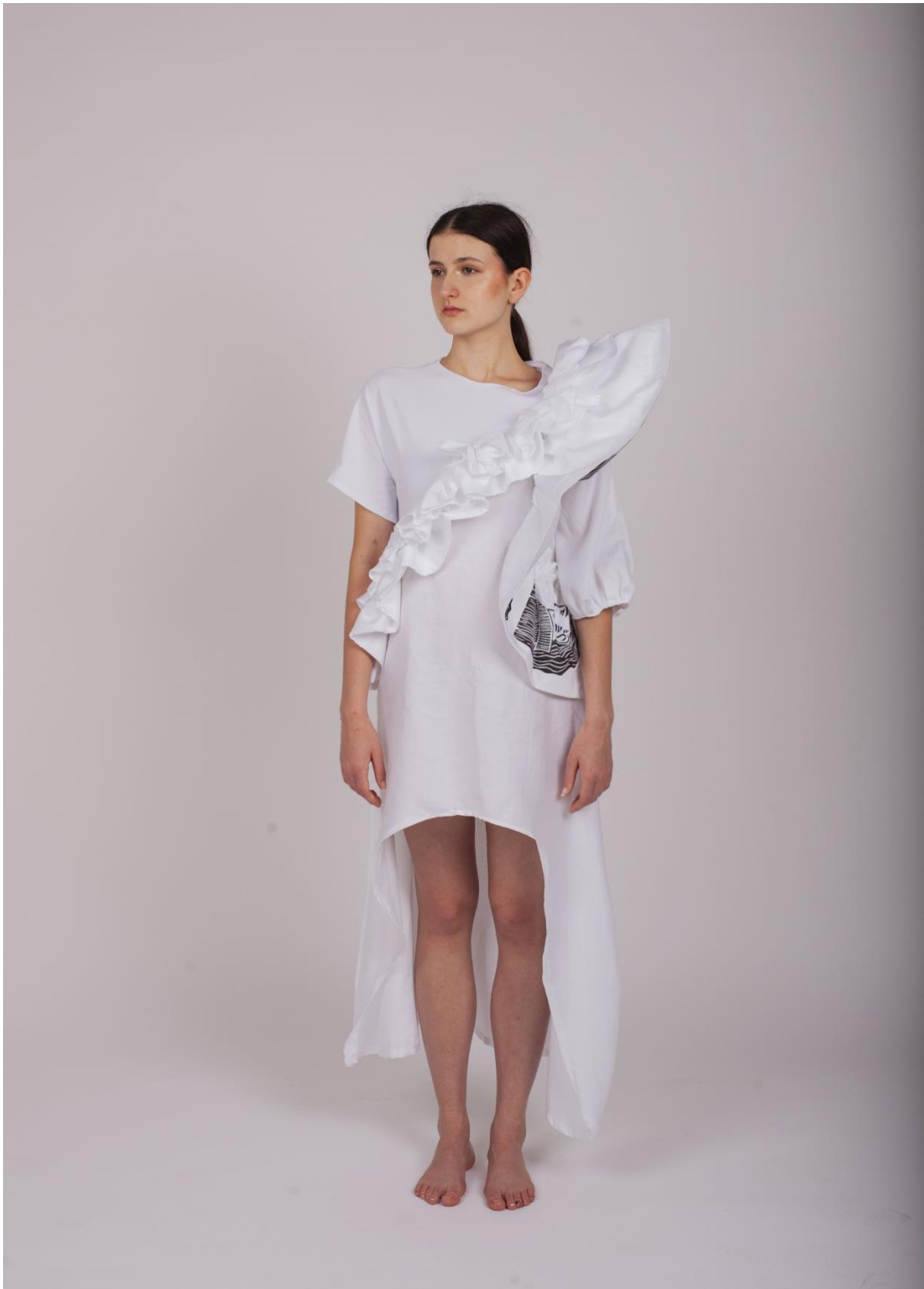
Druhá fáze procesu hledání identity 3