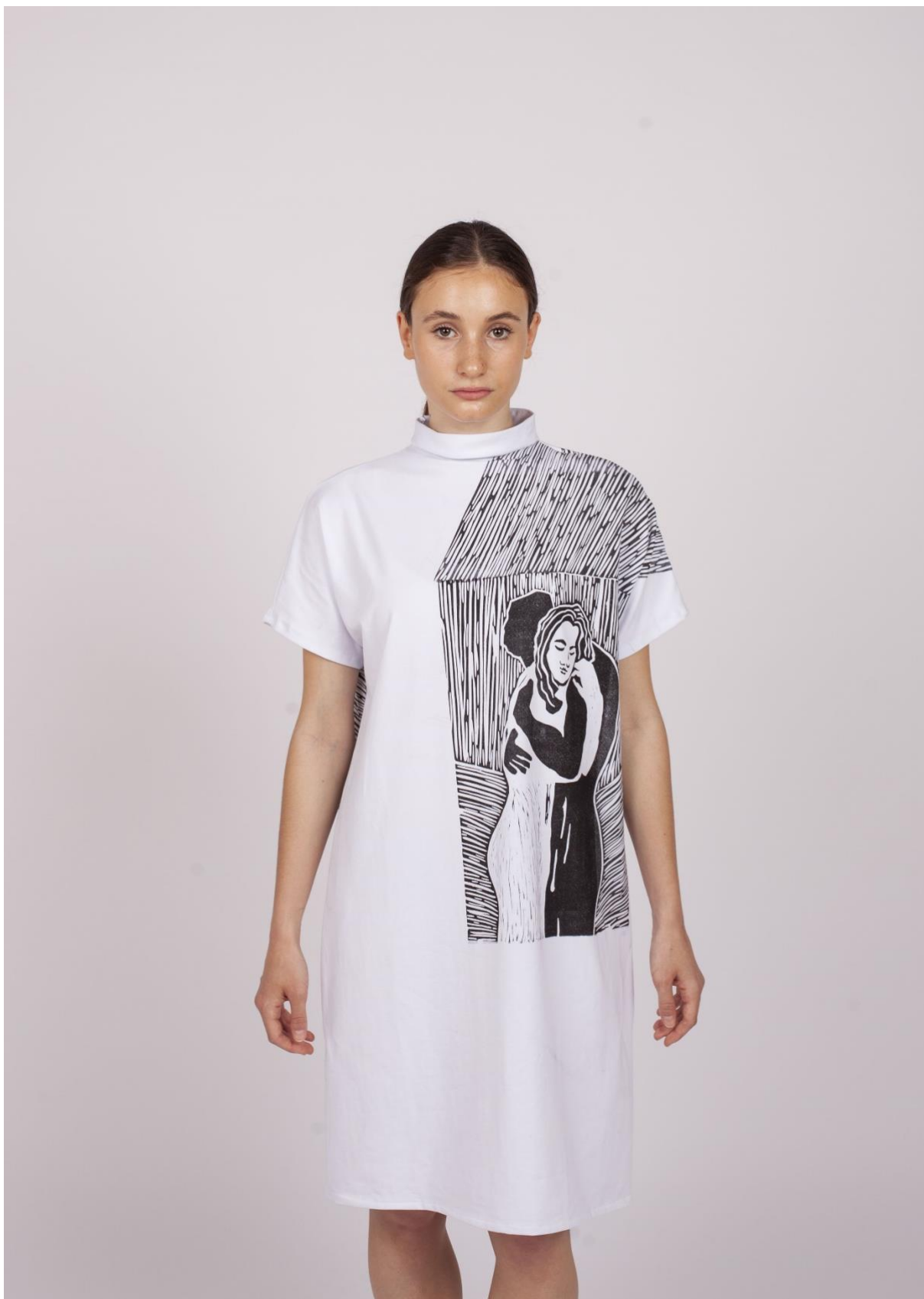
Třetí fáze procesu hledání identity 1