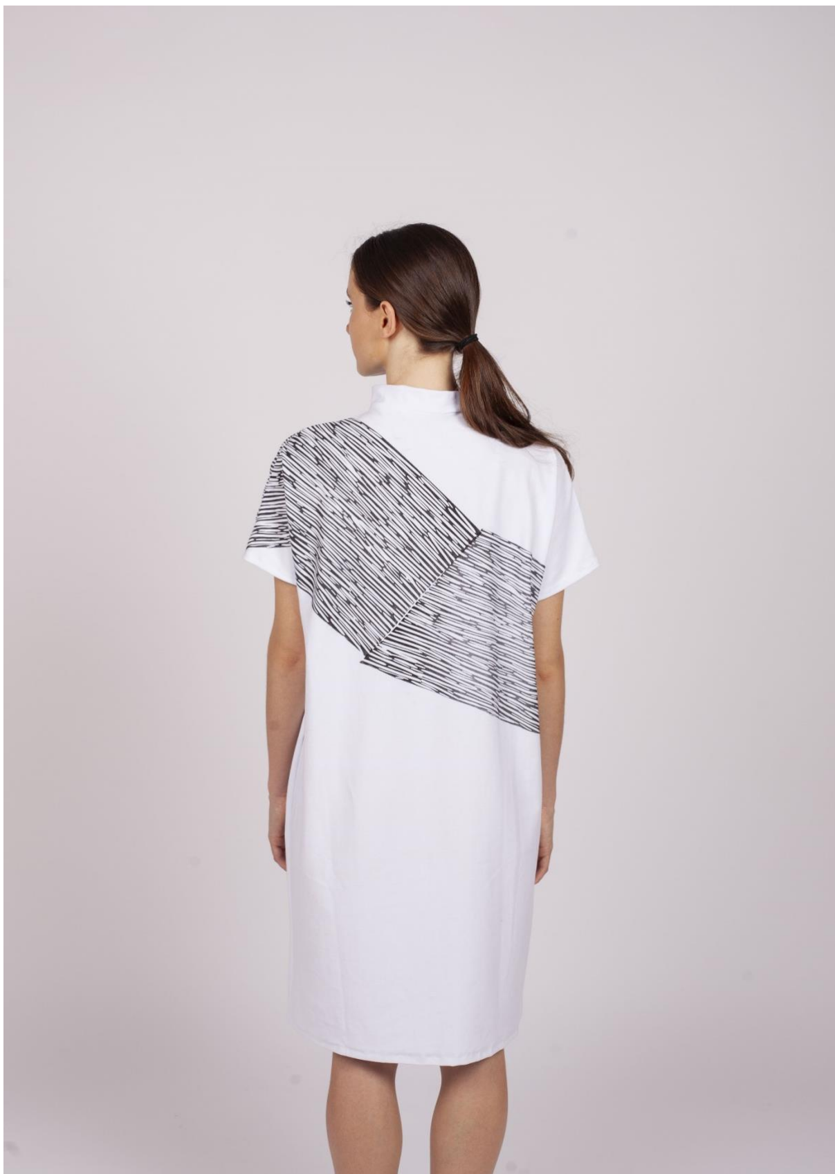
Třetí fáze procesu hledání identity 4, pohled zezadu