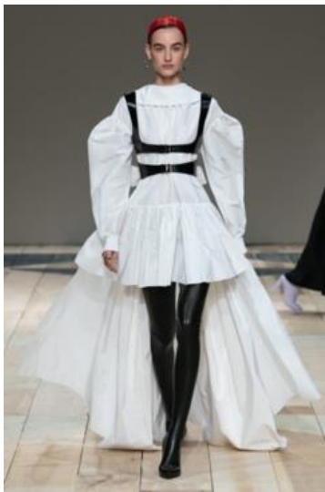
Obrázek 2: Alexander McQueen – přehlídka Fall (2020)