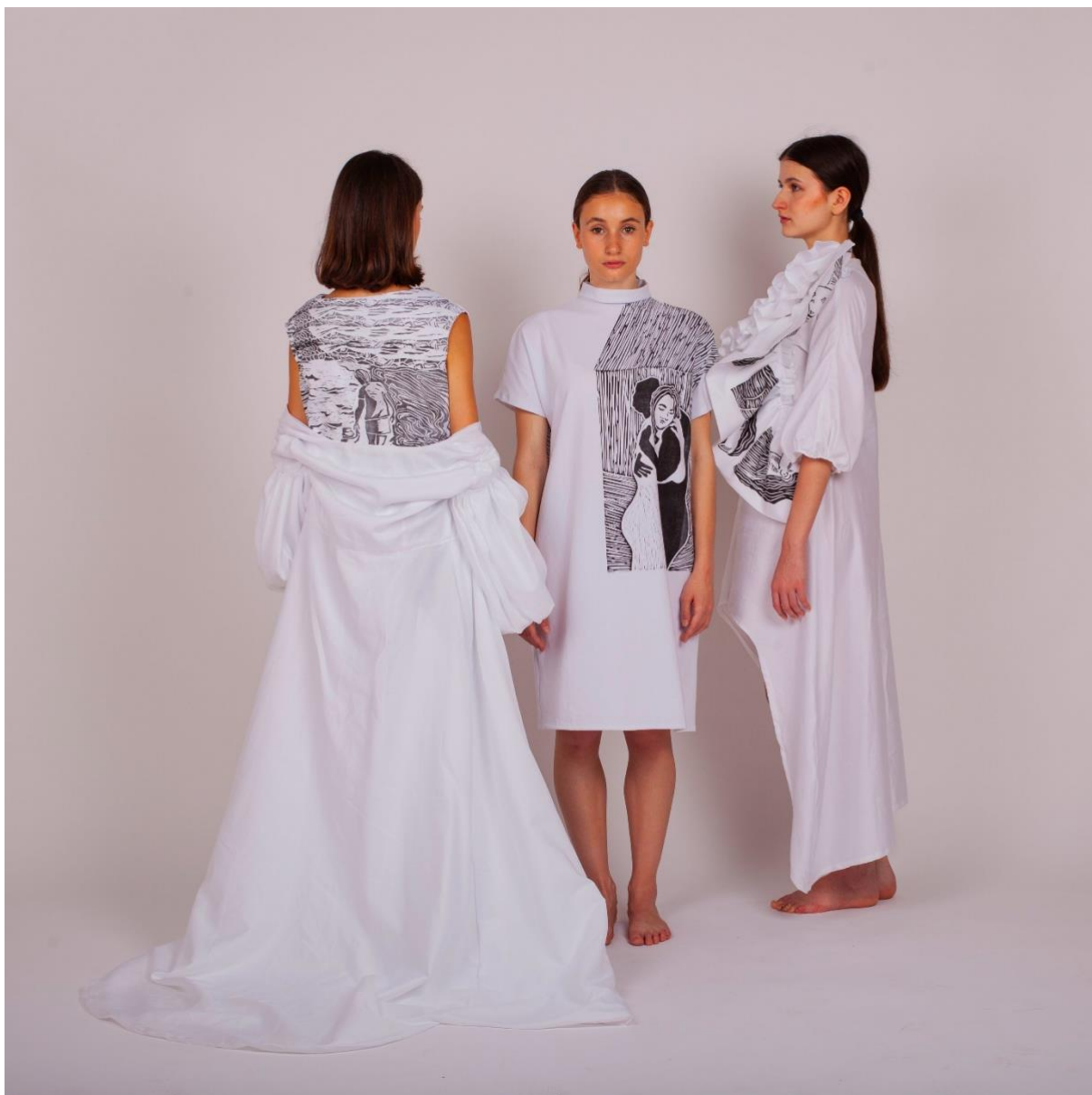
Kolekce tří oděvů – Hledání identity v oděvu 3