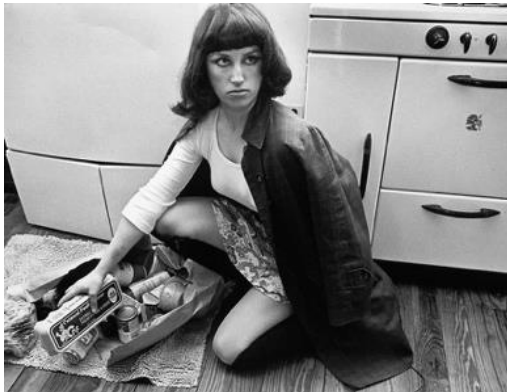
Obrázek 5: Cindy Sherman – Untitled Film Stills (1978)

a vlivu médií na vnímání ženského těla. Cindy Sherman pokračovala ve zkoumání tématu identity i v dalších sériích, v nichž mění image a přetváří se do různých postav od historických ikon, surrealistických postav, klaunů až po zajímavé osobnosti, které si vymyslí. 44 Na začátku 90. let 20. století vydavatelství Harper's Bazaar oslovilo Cindy Sherman, aby vytvořila pět obálek pro časopis zvaný „New York Fashion Week“. Sherman tedy fotila pouliční styl newyorského Fashion Weeku, kdy oblékala ikonické módní značky například Pradu, Dolce & Gabbana aj. a fotila své identické fotografie. 45