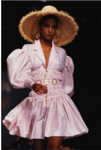
Obrázek 1: Karl Lagerfeld – přehlídka pro Chanel (1988)