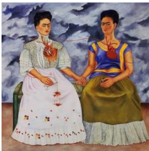
Obrázek 3: Frida Kahlo – The Two Fridas (1939)

Frida chodila učit děti do školy La Esmeralda (dříve známá jako Škola malířství a sochařství ministerstva veřejného školství). 38 Jak vysvětluje autor Hayden Herrera v knize Frida: The Biography of Frida Kahlo : „Frida zbožňovala děti. Zacházela s nimi jako se sobě rovnými a jak ve svém umění, tak v životě jim dopřála jejich vlastní zvláštní důstojnost... její přístup k žákům byl jak přístupem dítěte mezi vrstevníky, tak přístupem dospělého, který nechce ‚kazit‘ kreativitu mládí.“ 39 Děti velice respektovala a snažila se je vést k samostatnému poznávání vlastní identity. 40 Klíčové pro její tvorbu bylo chápání vlastní identity a sebe samé. Frida Kahlo zemřela 13. července 1954, ve věku 47 let. 41