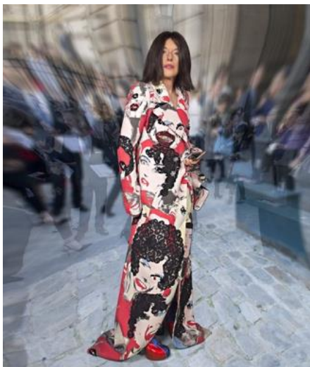
Obrázek 6: Cindy Sherman – fotografie pro Harper's Bazaar , kabát od Marca Jacobse (1993)