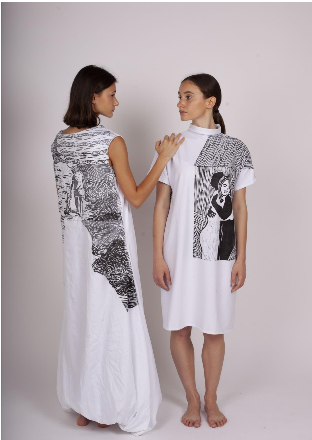
První a třetí fáze procesu hledání identity 1