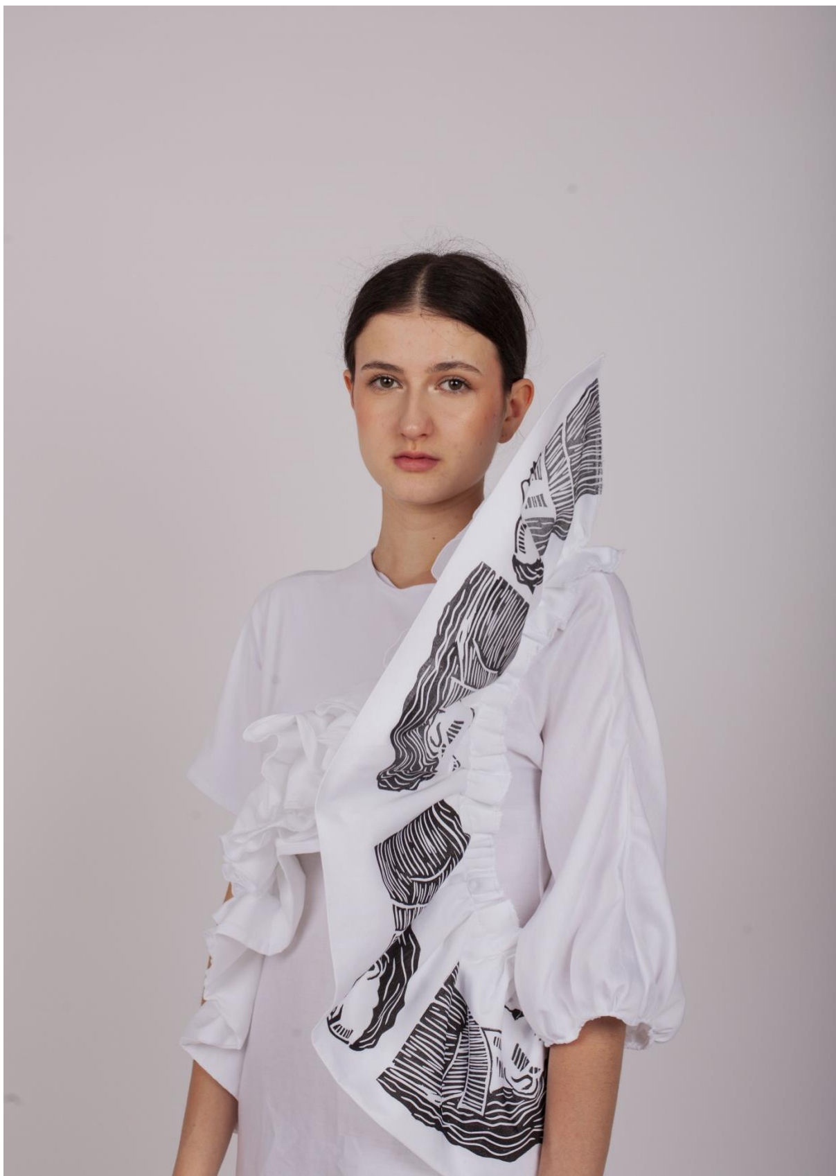
Druhá fáze procesu hledání identity 4, detail linorytového potisku