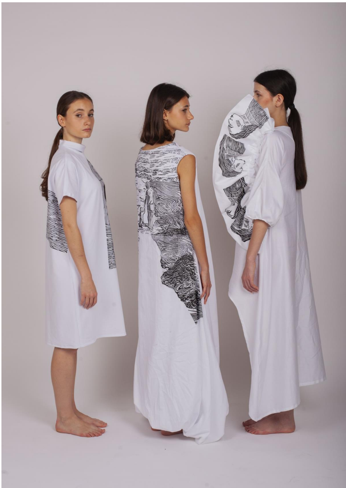
Kolekce tří oděvů – Hledání identity v oděvu 2