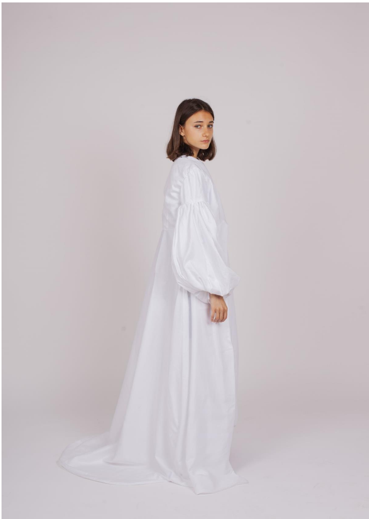
První fáze procesu hledání identity 2, pohled z boku