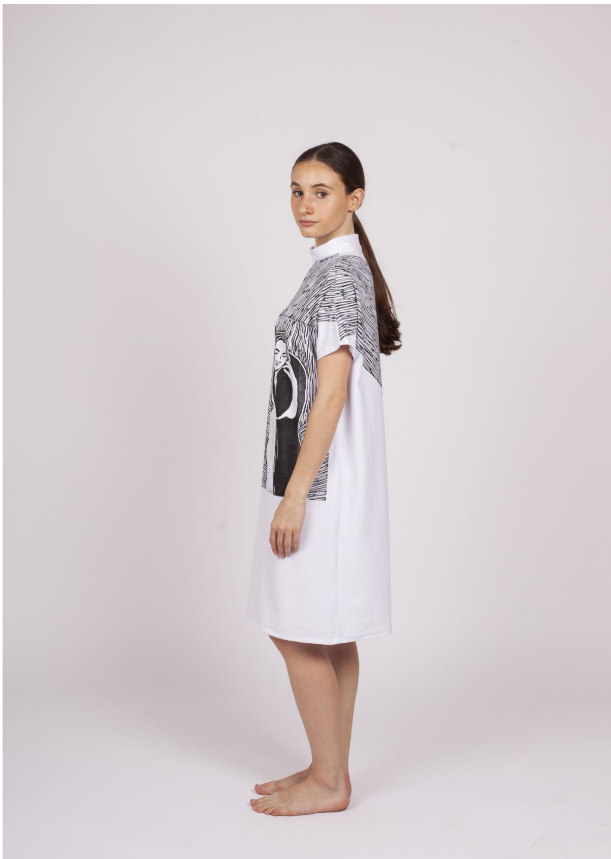
Třetí fáze procesu hledání identity 2, pohled z boku – vlastní zdroj