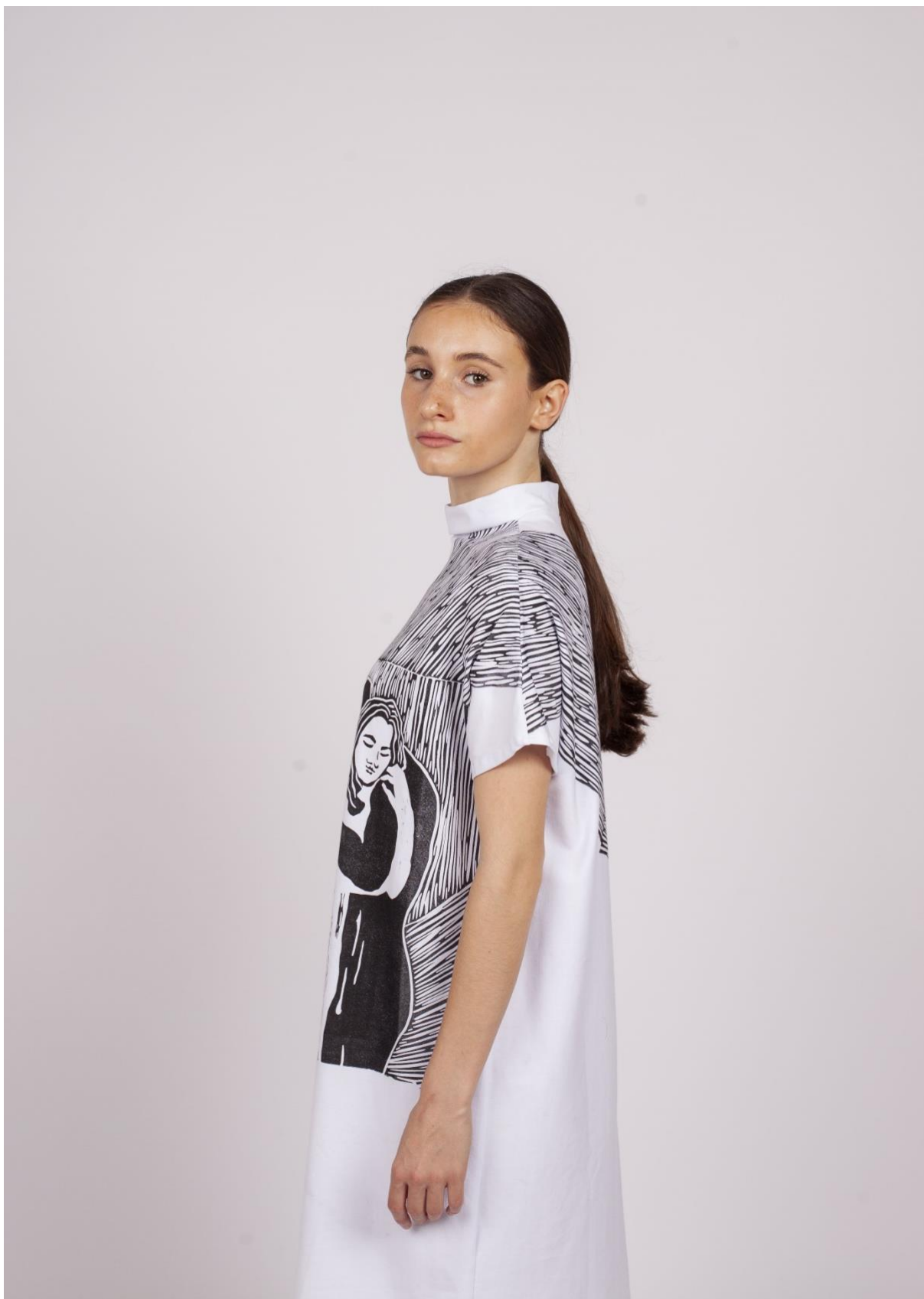
Třetí fáze procesu hledání identity 3, pohled z boku