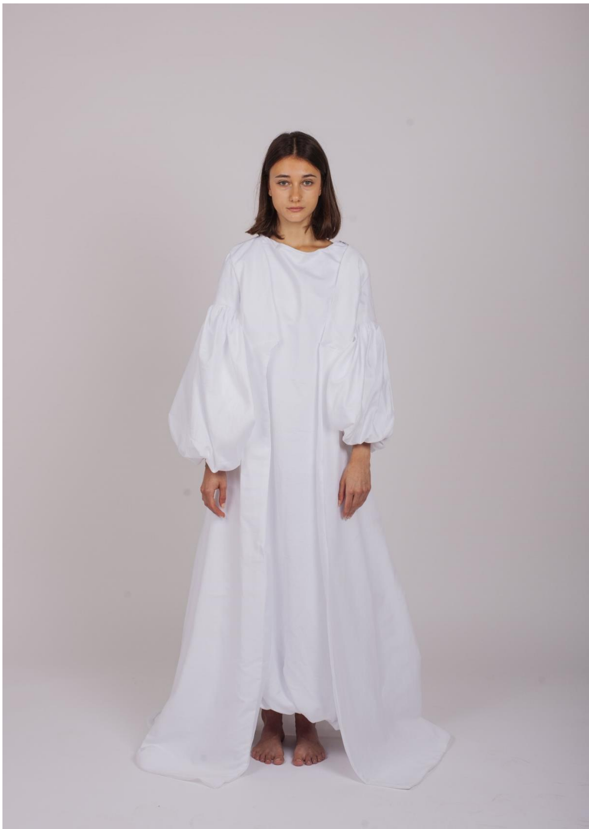
První fáze procesu hledání identity 1