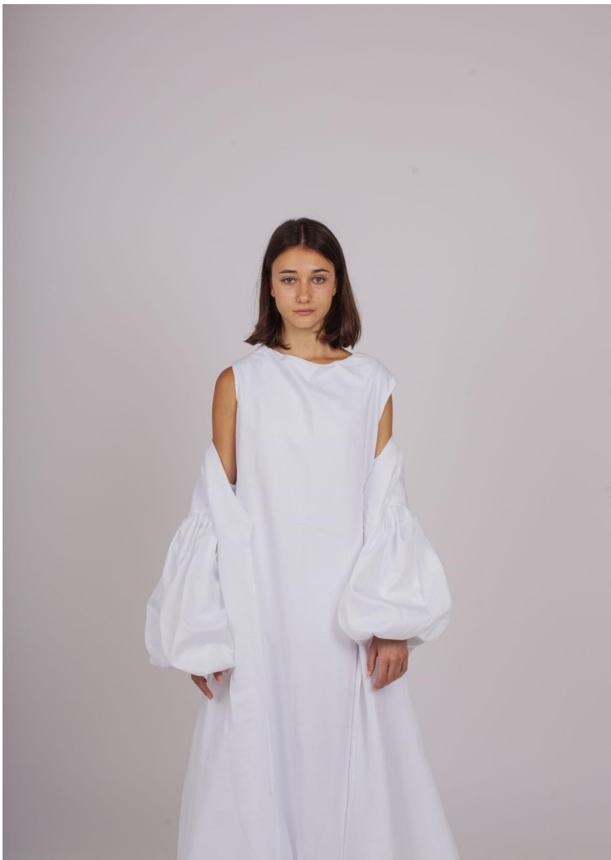
První fáze procesu hledání identity 3