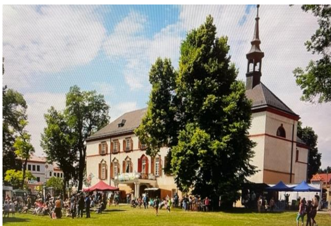
Obrázek 1: LZŠ Měcholupy při letních slavnostech