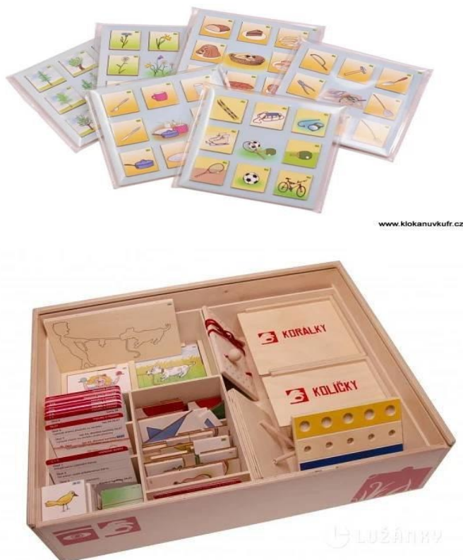
Obrázek 2: Klokanův kufr