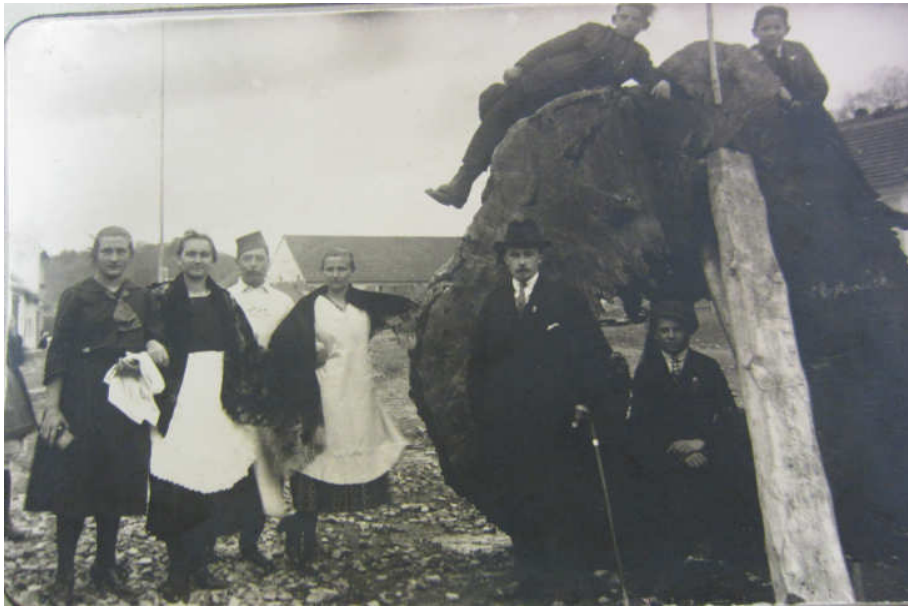
obr. 13: Řez Masarykova dubu v roce 1922, Okresní archiv v Uherském Hradišti, fond Národní škola, inv. č. 483