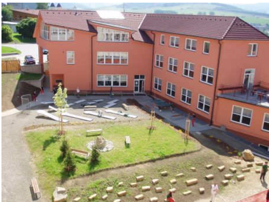
obr. 10: Školní park s minigolfem, pohled na zadní stranu vstupního a stravovacího pavilonu, URL: http://www.zsbojkovice.cz/index.php?ID=1403 , [cit. 18. března 2012]