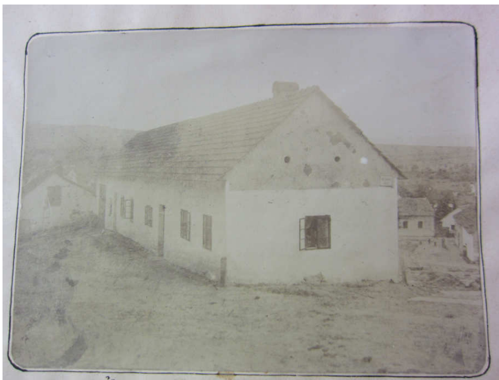
obr. 2: Školní budova v Bojkovicích v 18. století