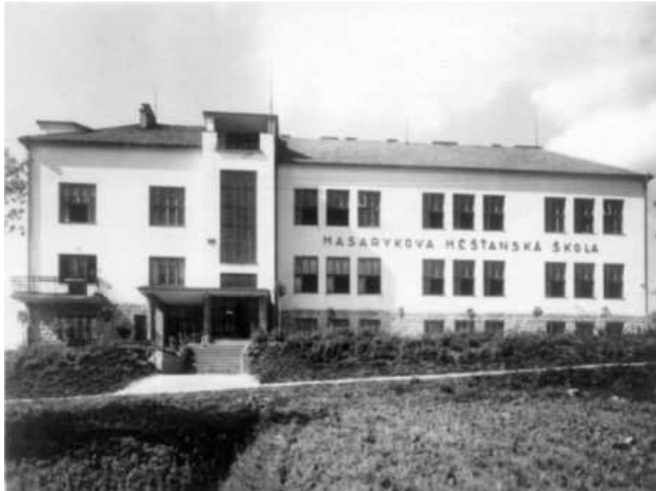
obr. 5: Masarykova měšťanská škola, URL: http://www.zsbojkovice.cz/index.php?ID=1288 , [cit. 18. března]