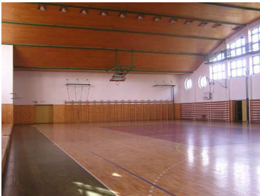
obr. 8: Interiér sportovní haly, URL: http://www.zsbojkovice.cz/index.php?ID=1403 , [cit. 18. března 2012]