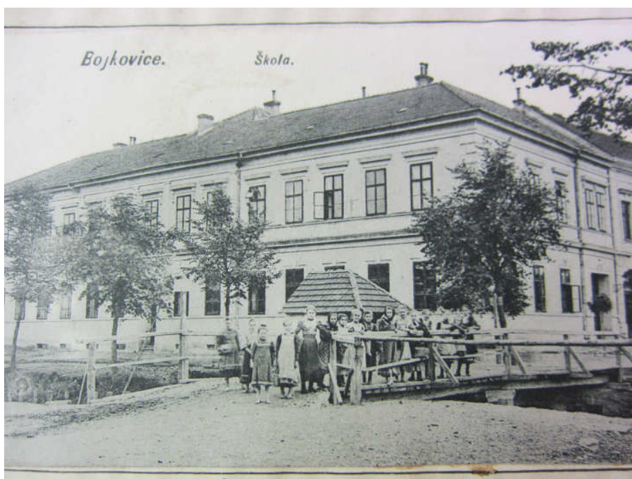
obr. 3: Škola v roce 1893, Okresní archiv v Uherském Hradišti, fond Národní škola, inv. č. 483