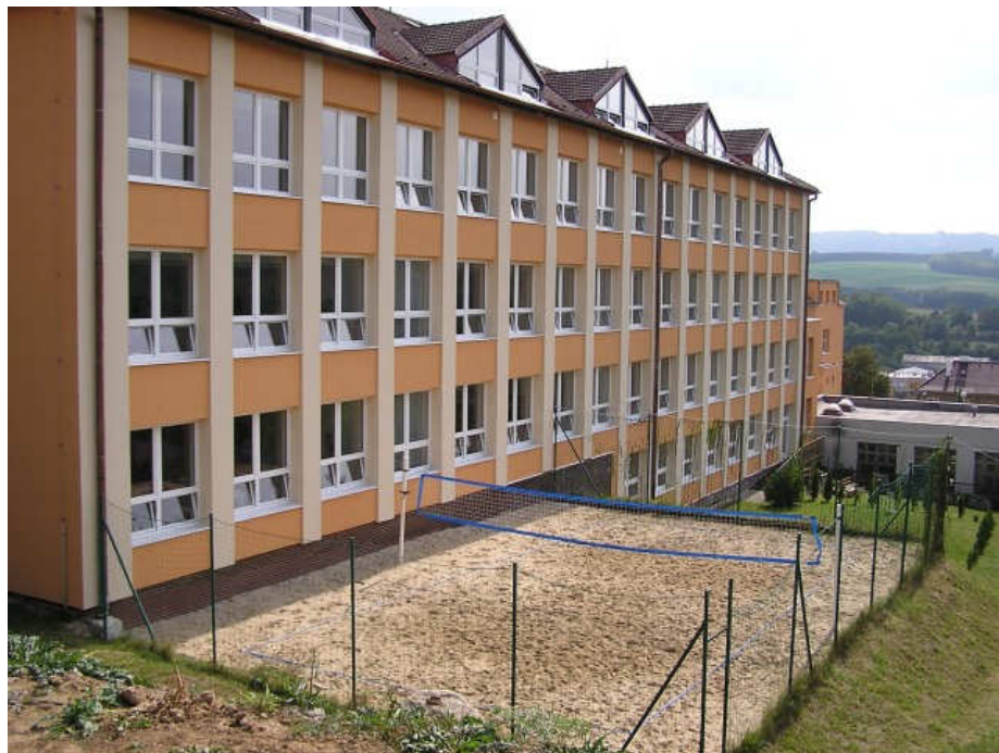
obr. 6: Nový pavilon školy z roku 1993, URL: http://www.zsbojkovice.cz/index.php?ID=1288 , [cit. 18. března 2012]