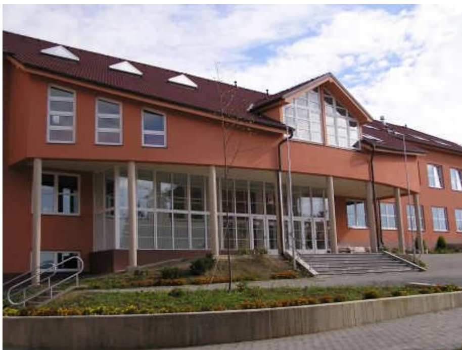
obr. 9: Vstupní a stravovací pavilon, URL: http://www.zsbojkovice.cz/index.php?ID=1288 , [cit. 18. března 2012]