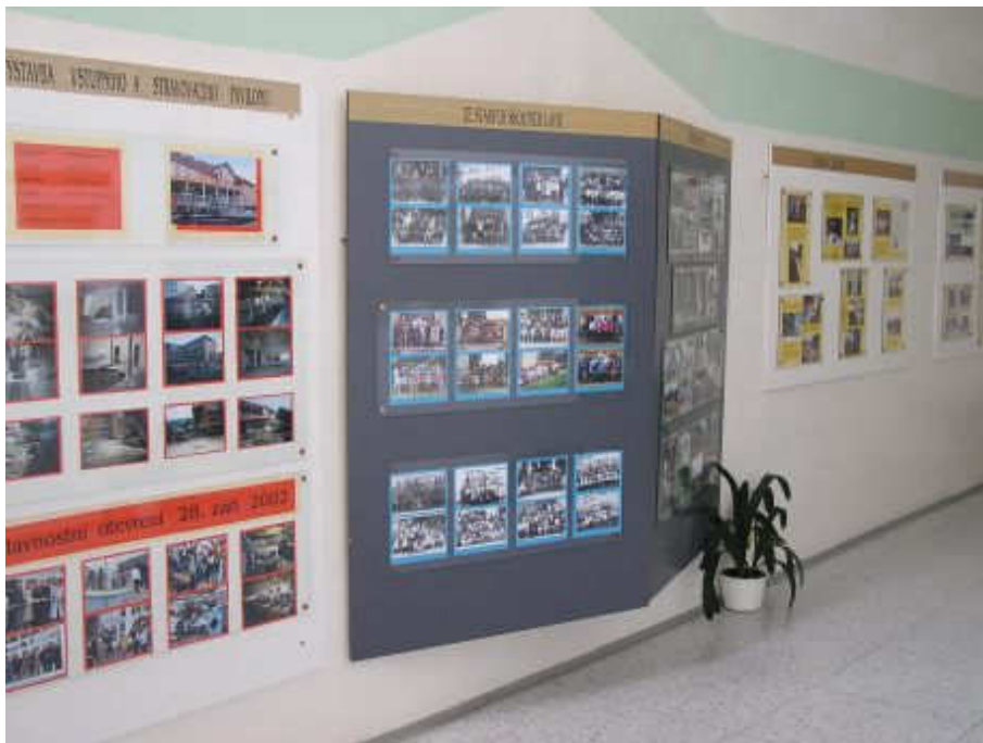
obr. 14: část expozice Historie školství v budově ZŠ T. G. Masaryka v Bojkovicích v roce 2012