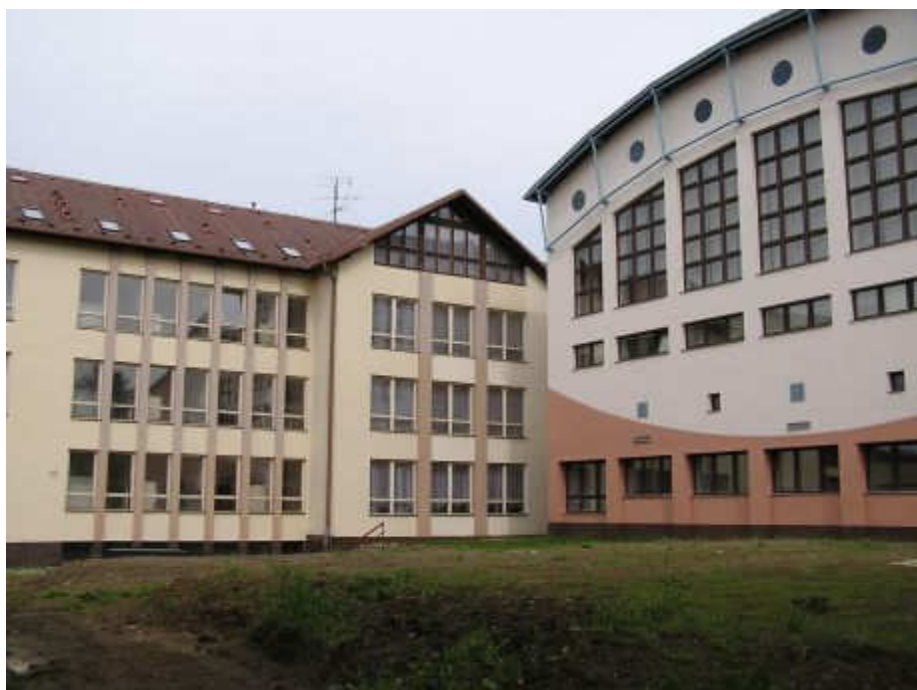
obr. 7: sportovní hala propojena s pavilonem z roku 1993