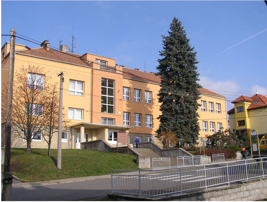
obr. 11.: Škola po generální opravě v roce 2009, URL: http://www.zsbojkovice.cz/index.php?ID=3328 , [cit. 18. března 2012]