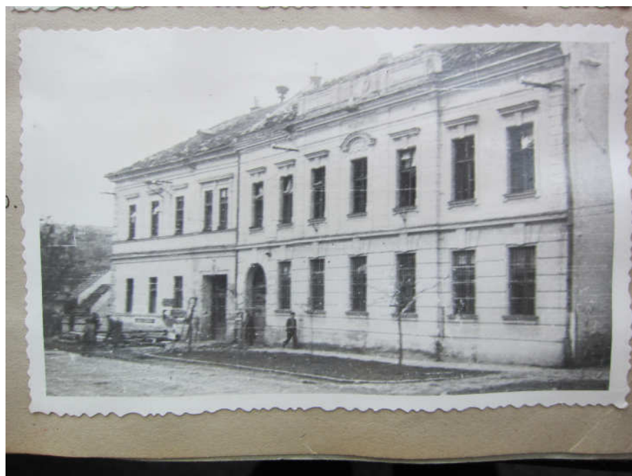
obr. 4: Škola zasažená 2. světovou válkou, Okresní archiv v Uherském Hradišti, fond Národní škola, inv. č. 483