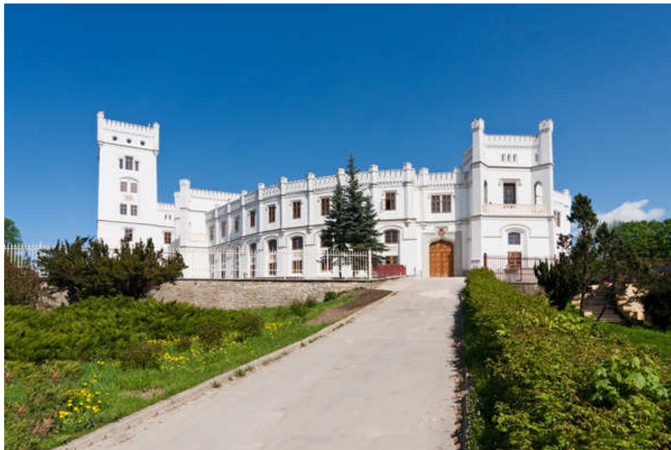
obr. 1: Zámek Nový Světlov, URL: http://www.rr-strednimorava.cz/photo_full/zamek-novy-svetlov-v , [cit. 18. března 2012]