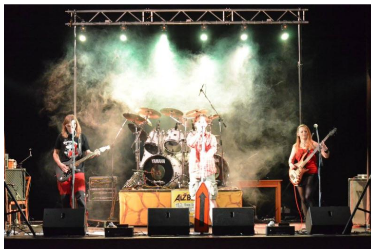
Obrázek č. 3: Hořická punková kapela Zamčená hlava.