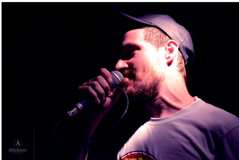
Underground Music Club

Fotografie č.2: Vystoupení hiphopového uskupení Prago Union v hořickém klubu