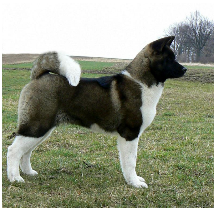
Americká akita, FCI V

Skupina V má celkem osm sekcí: Severští sáňoví psi, Severští lovečtí psi, Severští hlídací a ovčáctí psi, Evropští špicové, Asijské špicové a příbuzná plemena, Primitivní plemena, Primitivní lovecká plemena a Primitivní lovecká plemena s protisměrně rostoucí srstí na hřbetě. Česká republika nemá v této skupině žádné zástupce.