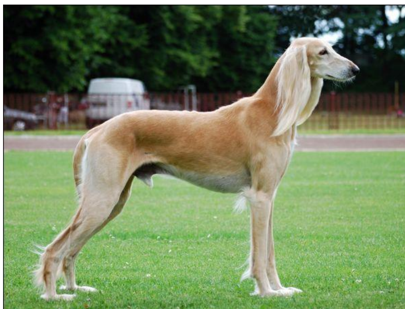
autor fotografie: Petra Pudová, Saluki, FCI X

Skupina X – chrti byli vyšlechtěni na rychlost a „lov očima“. Při lovu nepoužívají čich, nýbrž oči, které mají velmi dobře vyvinuté. Tito psi jsou vysocí, šlachovití, mrštní a štíhlí. Jejich předností je neúnavnost a rychlost. Vyjímkou je italský chrtík, který je menší a byl vyšlechtěn jako společenský pes. Česká republika zde nemá zástupce.