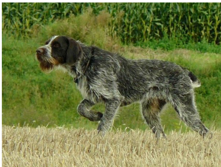
autor fotografie: CHS Vanaticus Major, Český fousek, FCI VII

Skupina VII jsou psi vyšlechtění o lovu zvěře, ale v současné době se využívají jako společníci rodin. Skupina má dvě sekce: kontinentální ohaři a ohaři britských ostrovů, přičemž kontinentální ohaři mají ještě tři podsekce: Typ brague, typ španěl a typ griffon. Česká republika má v této skupině zástupce; českého fouska.