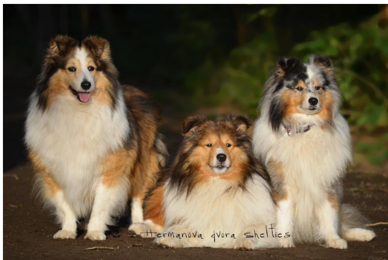
Sheltie, FCI

Skupina I se rozděluje do 2 sekcí: Ovčácká a pastevecká plemena a plemena Honácká. Samotná Česká republika zde žádného zástupce nemá, ale je zde jedno plemeno československý ovčák, která se ale oficiálně považuje za slovenské plemeno. Ovčáčtí, pastevečtí a honáčtí psi jsou středně velcí až velcí, tedy až na výjimku u Welsh Corgi Pembroka a Cardegana. Do této skupiny patří psi, kteří jsou lehce vycvičitelní, snadno ovladatelní, přesto dobří hlídači.