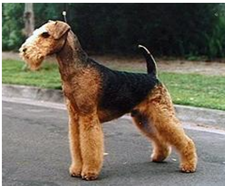
Erdelteriér, FCI III

Skupina III se dělí na 3 sekce: Velcí a střední teriéři, Malí teriéři, Teriéři typu bull a Toy teriéři. V této skupině má zástupce i Česká republika a to je český teriér, zařazen v sekci Malí teriéři. Časté využití teriéru je k lovu krysy či norování.