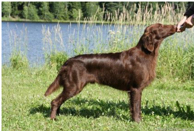
Flat coated retrívř, FCI VIII

Skupina VII nemá příliš zástupců. Většina plemen z této skupiny jsou původně lovecká, dnes jsou ale z většiny psi společenští. Tato skupina má tři sekce: Retrívři, Slídiči a Vodní psi. Česká republika zde nemá zástupce.