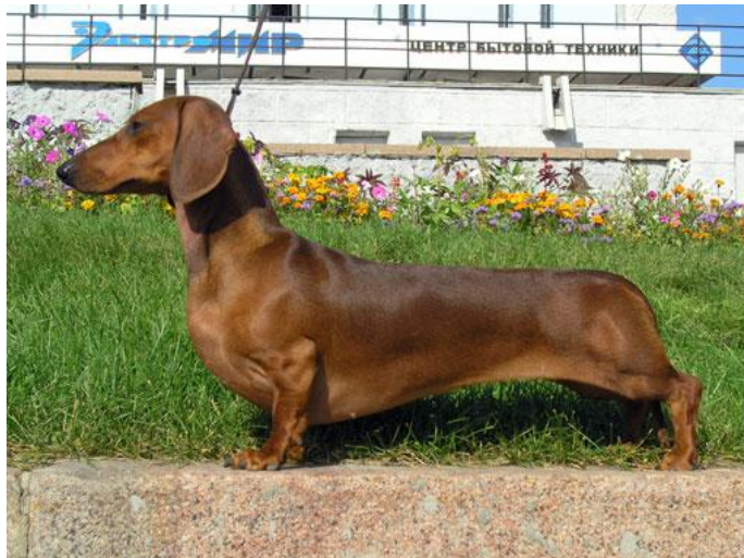
Jezevčík standardní krátkosrstý, FCI IV

Skupina IV je nejméně početná. Jezevčíky rozdělujeme dle velikosti: trpasličí/králičí a standardní a typu srsti: dlouhá, drsnosrstá a krátkosrstá. Původem patří mezi honiče. Jezevčíci byli vyšlechtěni pro práci v jezevčích a liščích norách.