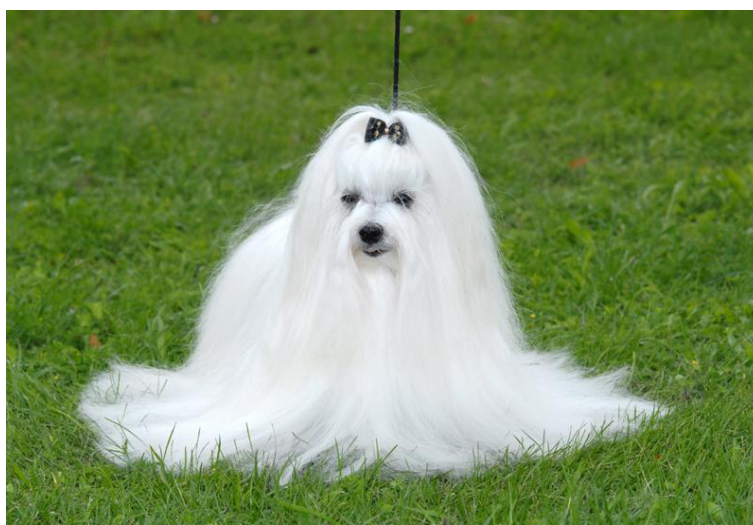
Maltézský psík, FCI IX, citace on-line: 08. 08. 2015

Skupina IX je skupina plemen vyšlechtěných k tomu, aby dělala společnost lidem. Většinou se jedná o psy klidné a přátelské povahy. Tato skupina je početná a má mnoho sekcí: Bišonci a příbuzná plemena, Pudl, Malý kontinentální španěl, Belgičtí psíci, Naháči, Tibetská plemena, Čivava, Angličtí společenští španělé a ruský toy španěl, Japan-chin a pekingský palácový psík, Kromfohrländer a Malí molossoidní psi. Česko nemá v této skupině žádné zástupce, ale na uznání FCI čeká pražský krysařík, který bude patřit právě do této skupiny.