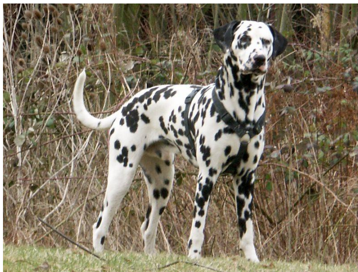
Dalmatin, FCI VI

Skupina VI je skupina psů vyšlechtěná pro stopování a pronásledování zvěře. Úkol Barvářů je zvíře vystopovat a usmrtit. Tato skupina má tři sekce: Honiči, Barváři a Příbuzná plemena. Sekce Honiči má tři podsekce: Velcí honiči, Střední honiči a Malí honiči. Příbuzná plemena je sekce se dvěma psími plemeny, dalmatinem a rhodéským ridgebackem.