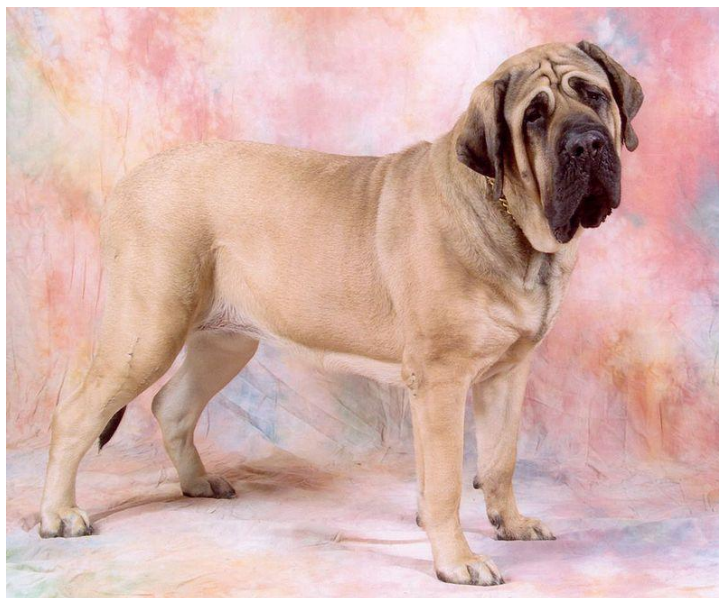
Anglický mastif, FCI II

Skupina II je velmi rozsáhlá z pohledu velikosti plemen. Lze zde najít drobné pinče, ale zároveň velké dogy. Pojem „molosoidní“ označuje plemena těžká, jako jsou dogy a mastifové. Skupina se dělí do tří sekcí: Pinčové a knírači, Molosoidní plemena (dogovití psi) a Švýcarští salašnickí psi. Česká republika zde zástupce nemá.