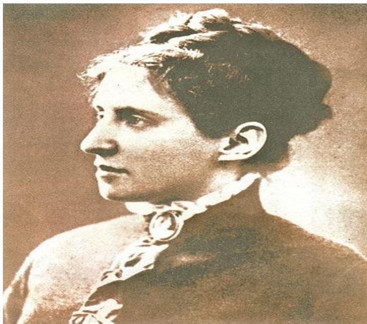
Obrázek 1: Charlotta Masaryková

zrovnoprávnění postavení ženy ve společnosti. V roce 1923 se k zdravotním komplikacím Charlotty přidává mozková mrtvice a postupná paralýza. Dne 13. května 1923 Charlotta Masaryková umírá na prezidentském zámku v Lánech. Její dcera Alice tak přebírá definitivně roli první dámy a stojí po boku svého otce jako důstojná náhrada ženy, která Tomáši Masarykovi ujasnila smysl jeho životního směřování a cíl politických aktivit. V celkovém hodnocení jejího odkazu je nutno zmínit především i roli, kterou sehrála při humánní výchově svých dětí. Zejména Alice čerpala z jejího intelektuálního odkazu a výchovných metod, které se později snažila aktivně uplatnit ve své sociálně-politické koncepci vývoje moderní společnosti. V sociálně-zdravotní sféře ji ovlivnil zejména matčin apel na dodržování hygienických zásad, čistoty a pořádku, které jsou pro život člověka nezbytné a které byly vždy v rodině Masarykových dodržovány. 6