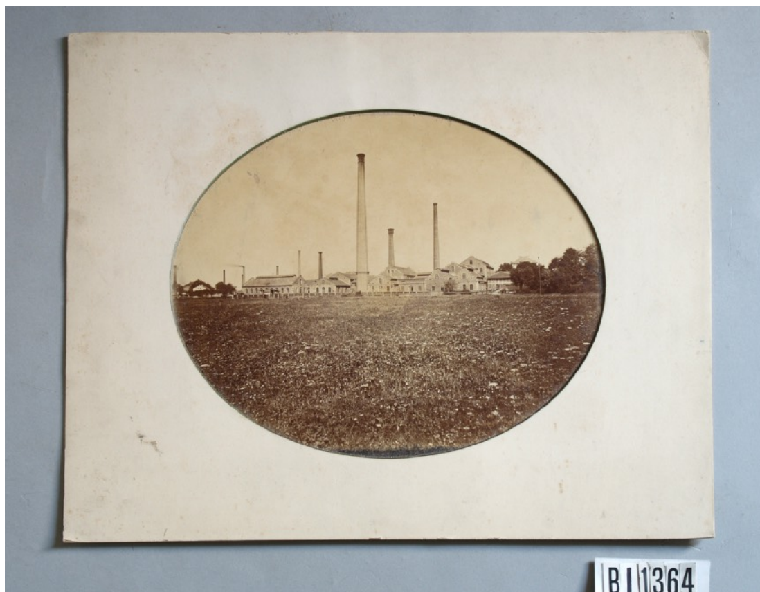
Porcelánka v Horním Slavkově

Archiv Státního hradu Bítov, i. č. BI1364.