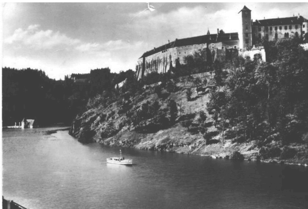
Pohled na hrad Bítov během napouštění Vranovské přehrady.

Archiv Státního hradu Bítov, neuspořádáno.