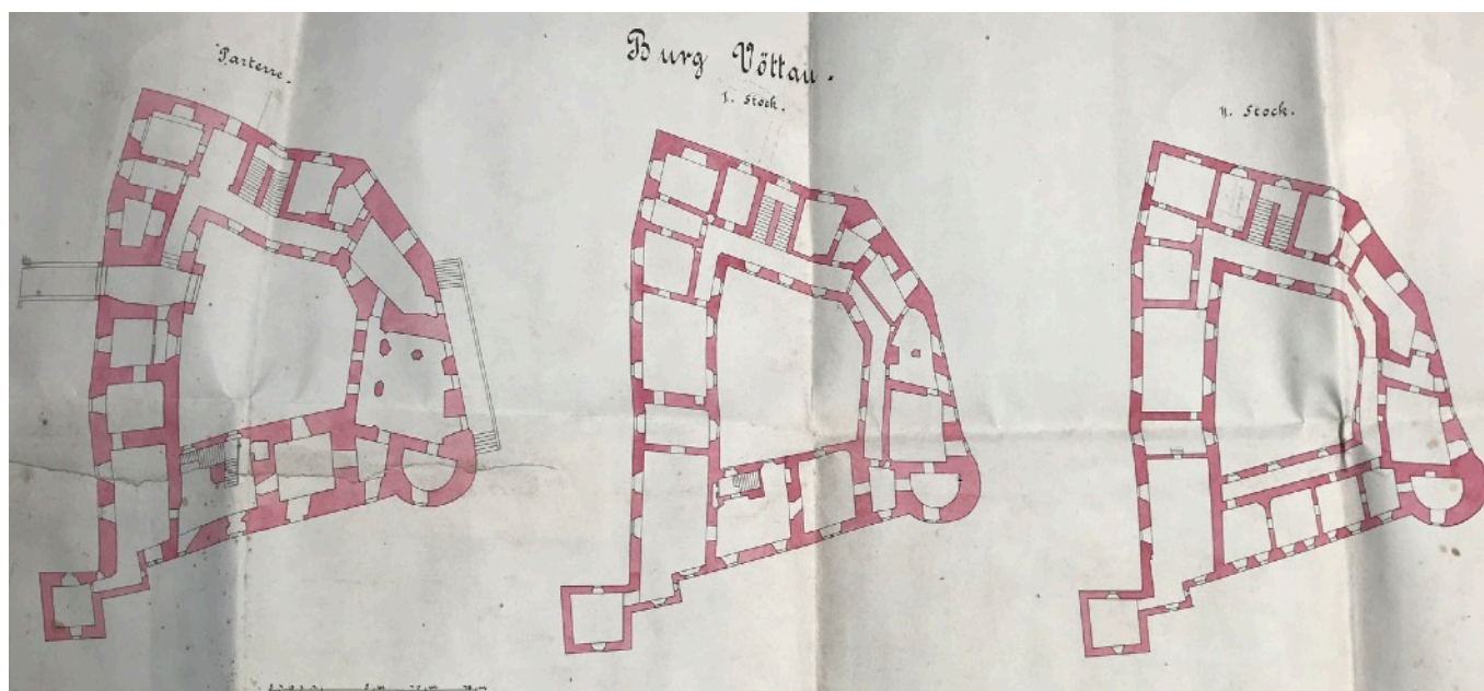
Plán půdorysu paláce z roku 1912

MZA v Brně, fond F 38, i. č. mapa 2018, 1912.