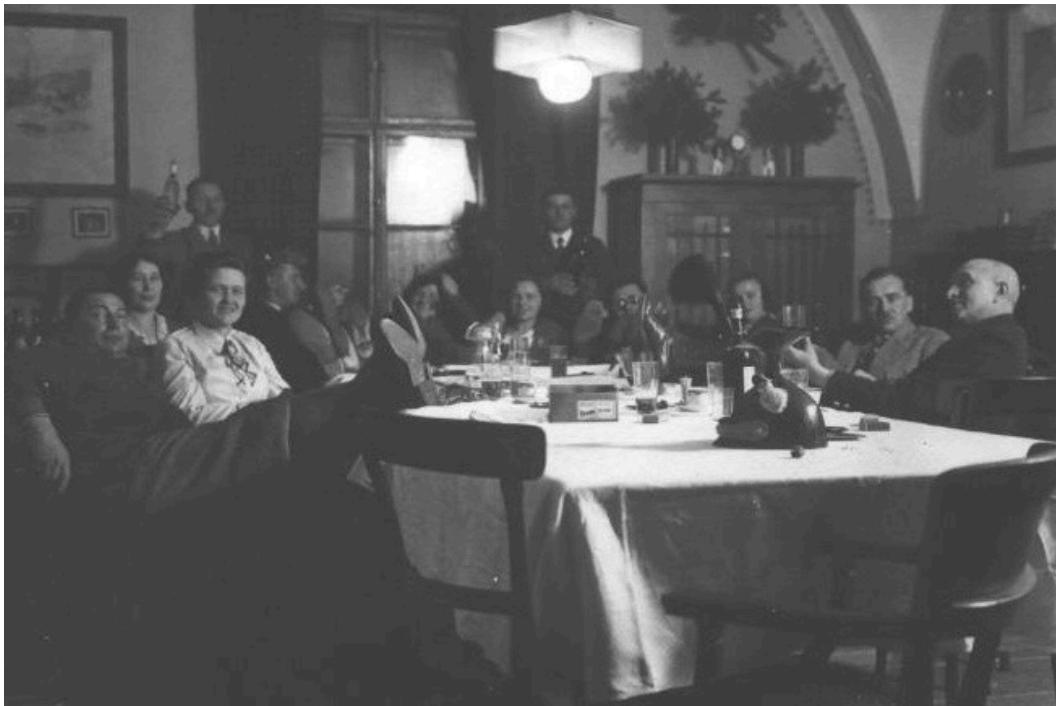
Přátelé v Haasově bytě v jižním křídle hradu.

Archiv Státního hradu Bítov, i. č. BI1405.