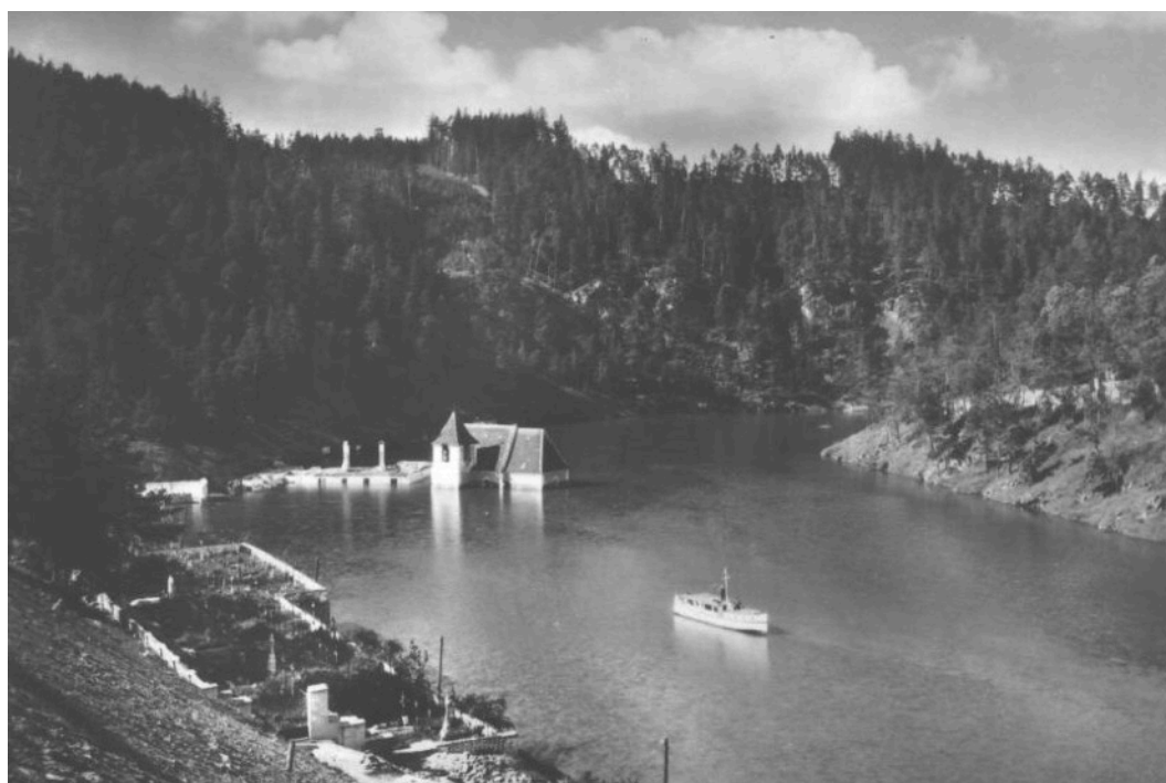
Napouštění Vranovské přehrady, pohled na Bítov.