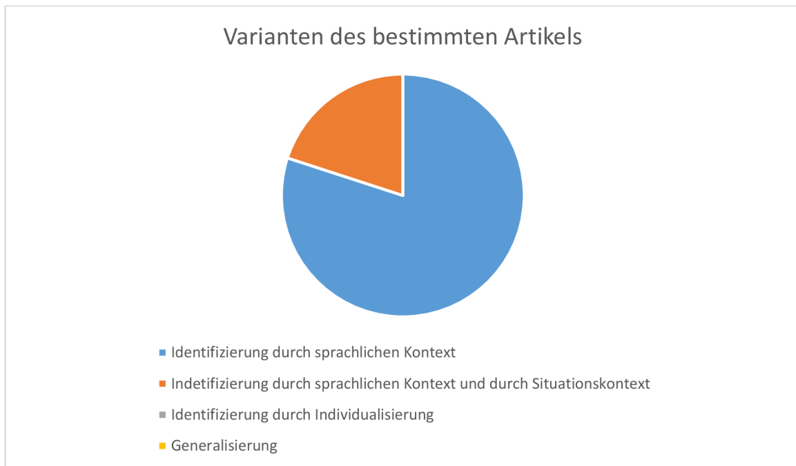
Graph 2: Varianten des bestimmten Artikels

In der Arbeit werden auch Varianten des unbestimmten Artikels untersucht. Der unbestimmte Artikel wird vor dem Substantiv für Dinge verwendet, die zum ersten Mal erwähnt werden, oder für Dinge, die unbekannt sind, für Dinge, die im Kontext bereits erwähnt, aber nicht näher beschrieben werden, vor einem Substantiv anstelle eines bestimmten Artikels, zur Bezeichnung des Objekts, vor einem Substantiv mit Attribut als Element einer Gruppe oder die Bezeichnung des Objekts der Realität als Klasse. In allen untersuchten Lehrbüchern werden nur zwei von diesen Funktionen verwendet, nämlich die Variante, bei der der unbestimmte Artikel vor einem unbekanntem, im Kontext zum ersten Mal erwähnten Substantiv und vor einem bereits erwähnten, aber im Kontext nicht spezifizierten Substantiv, verwendet wird.