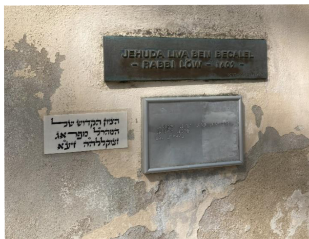
© Denisa Brücknerová, 2024 Hrob rabiho Löwa na Starém židovském hřbitově v Praze