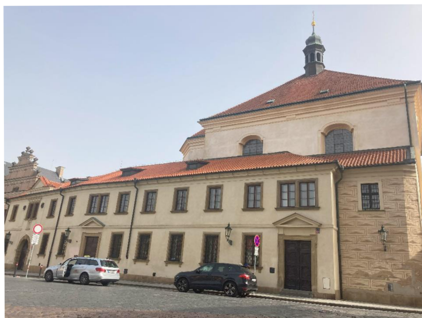
Klášter bosých karmelitánů (zvaný též barnabitek) v Praze