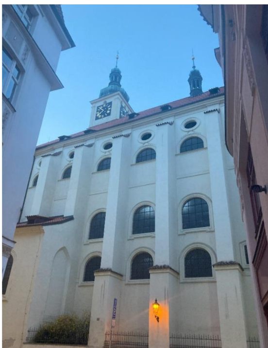
© Denisa Brücknerová, 2024 Bazilika svatého Jakuba Většího v Praze