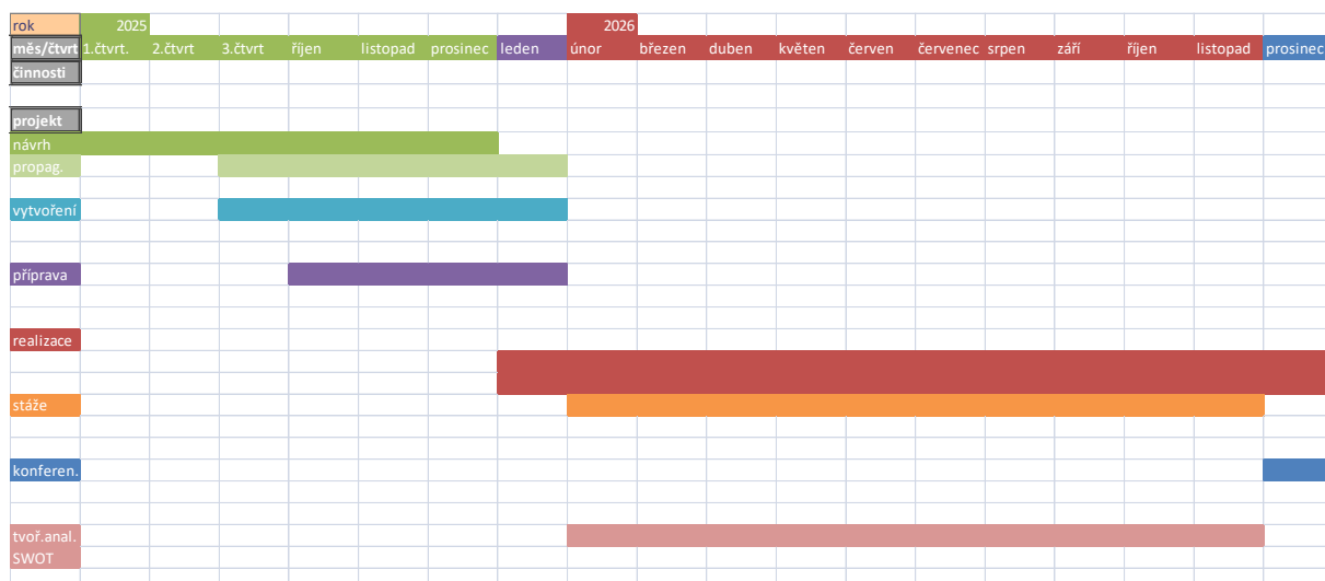
Tabulka 5 Harmonogram průběhu 1. stáže