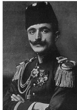
Ismail Enver paša