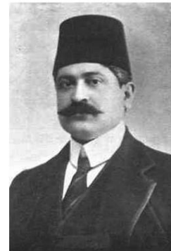
Mehmed Talat paša