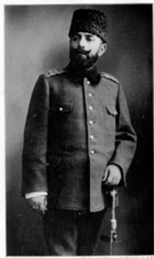
Ahmad Džemal paša