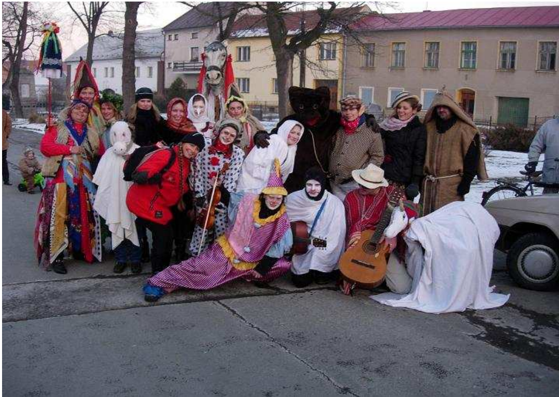
Obrázek 3. Masopust