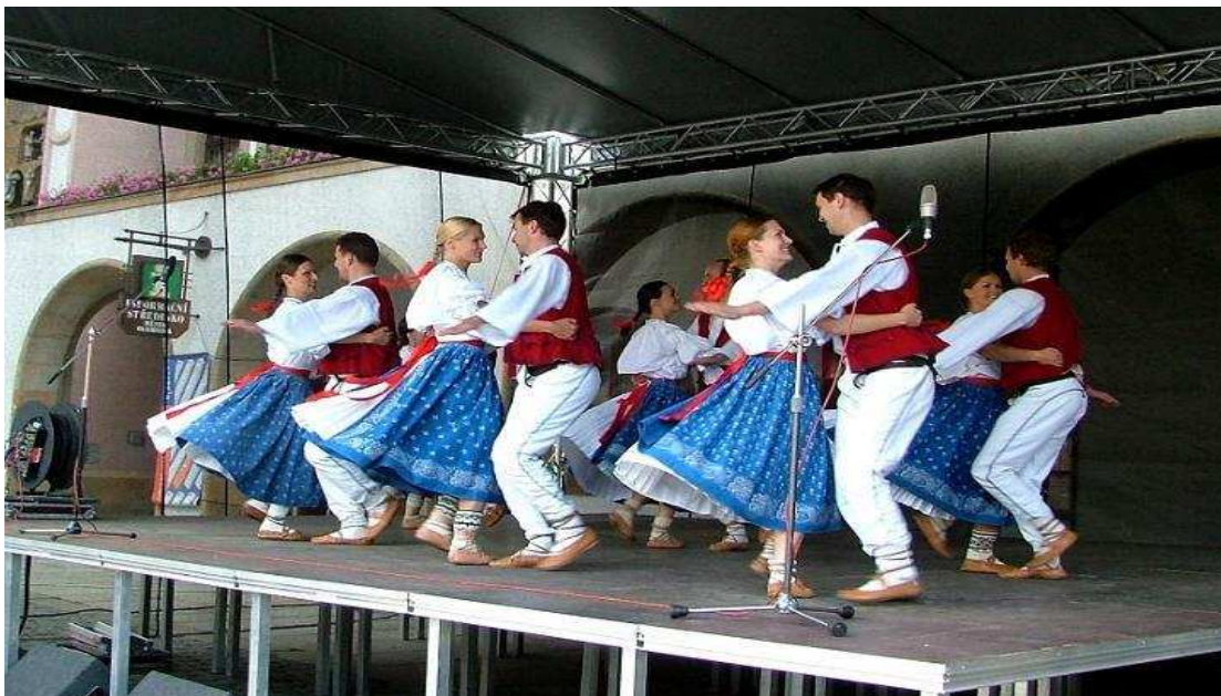
Obrázek 2. Taneční pásmo Kopanice