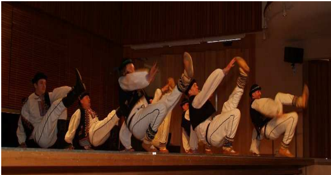
Obrázek 4. Zbojnické tance