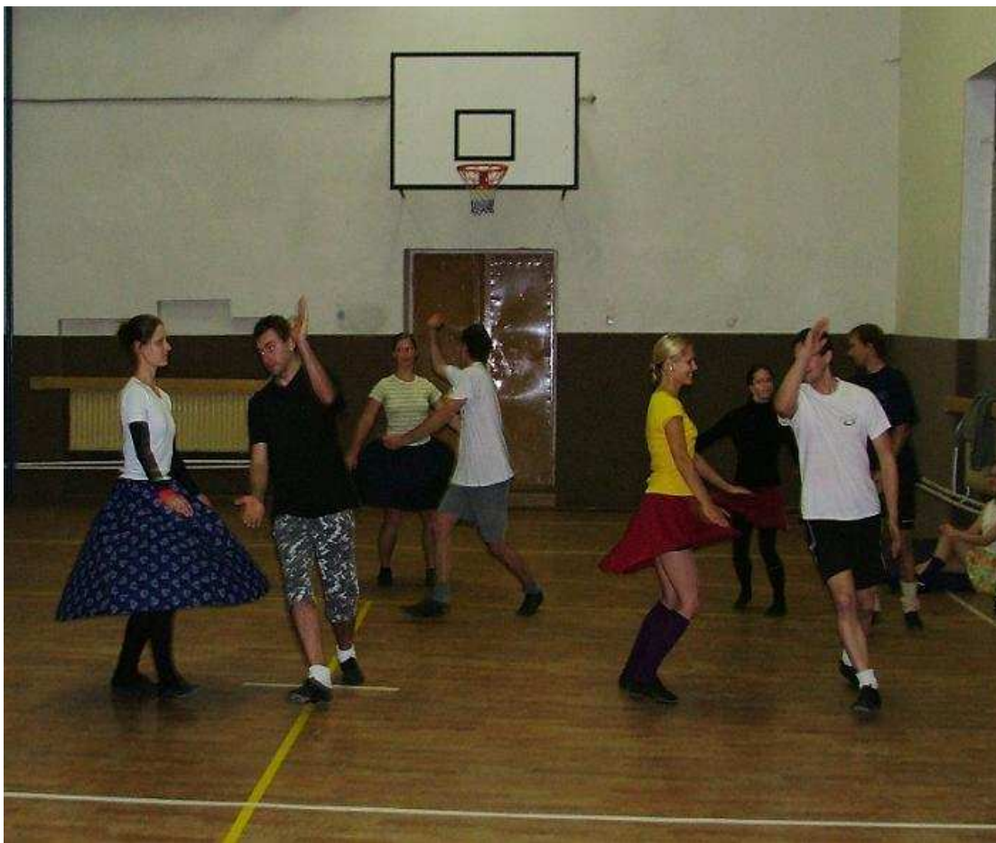
Obrázek 1. Nácvič pásem