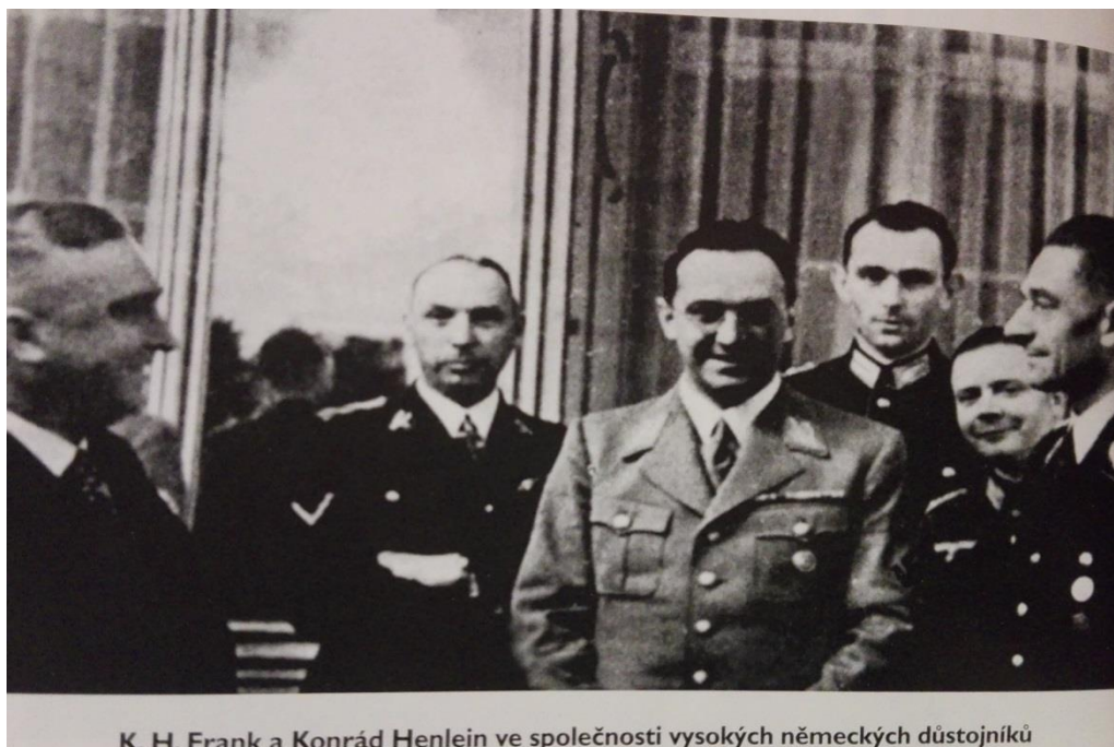
K. H. Frank a Konrad Henlein ve společnosti vysokých německých důstojníků

Příloha č. 2: K. H. Frank a K. Henlein ve společnosti vysokých německých důstojníků