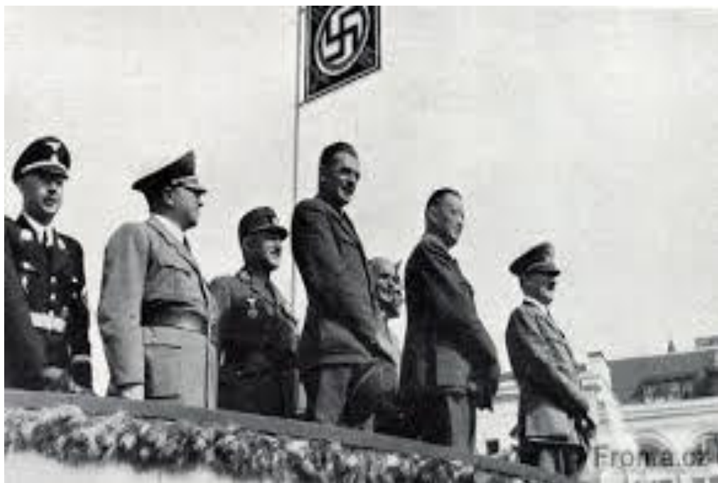
Zdroj: UHLÍŘ, Boris Jan. Karl H. Frank 1898-1946 . Praha 2017.