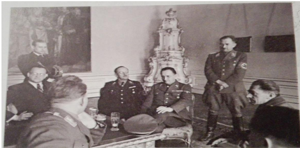
Pražský hrad, 16. březen 1939. Představitelé Říšské župy Sudety v očekávání přijetí u Vůdce Adolfa Hitlera. Zprava: zástupce župního vedoucího SS-Brigadeführer Karl H. Frank, vládní prezident SS-Standartenführer Hans Krebs a říšský komisař a župní vedoucí SS-Gruppenführer Konrad Henlein.

Zdroj: UHLÍŘ, Boris Jan. Karl H. Frank 1898-1946 . Praha 2017.