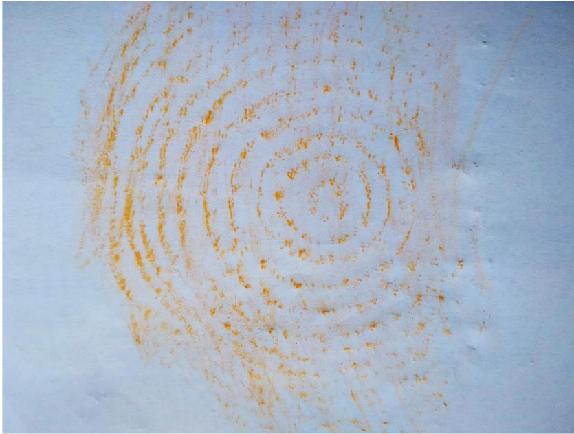
Obrázek 7 Letokruhy