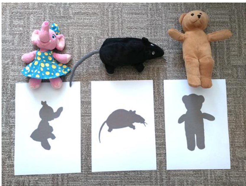
Obrázek 5 Stínohra