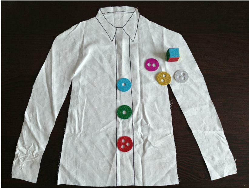
Obrázek 3 Přišívání knoflíků