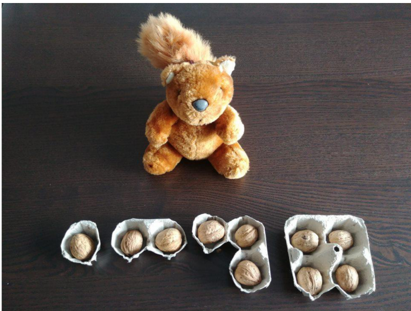
Obrázek 2 Oříšky pro veverku