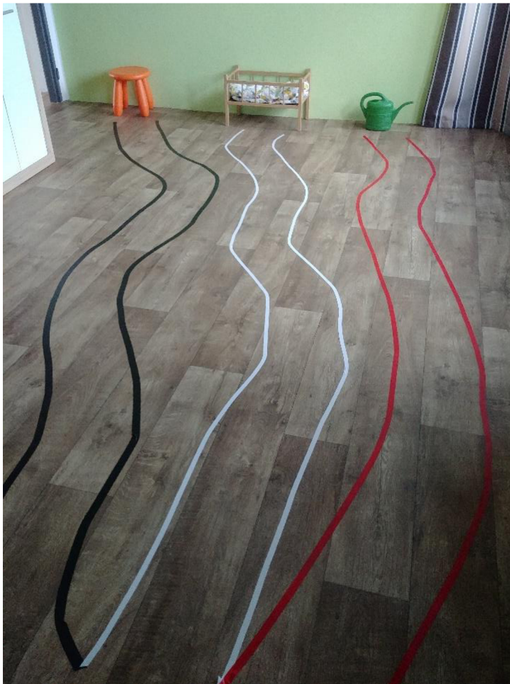
Obrázek 4 Kudy vede cesta