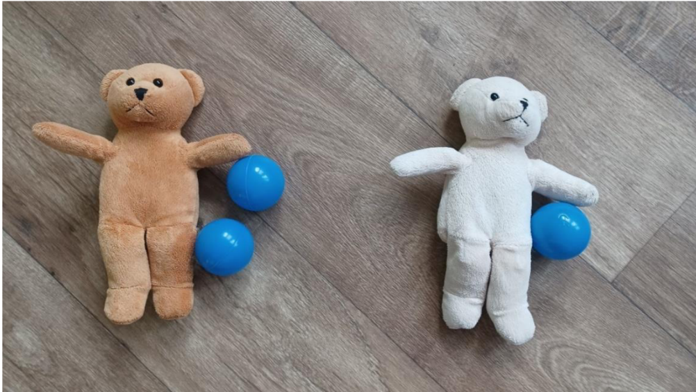
Obrázek 9 Usuzování – medvědi