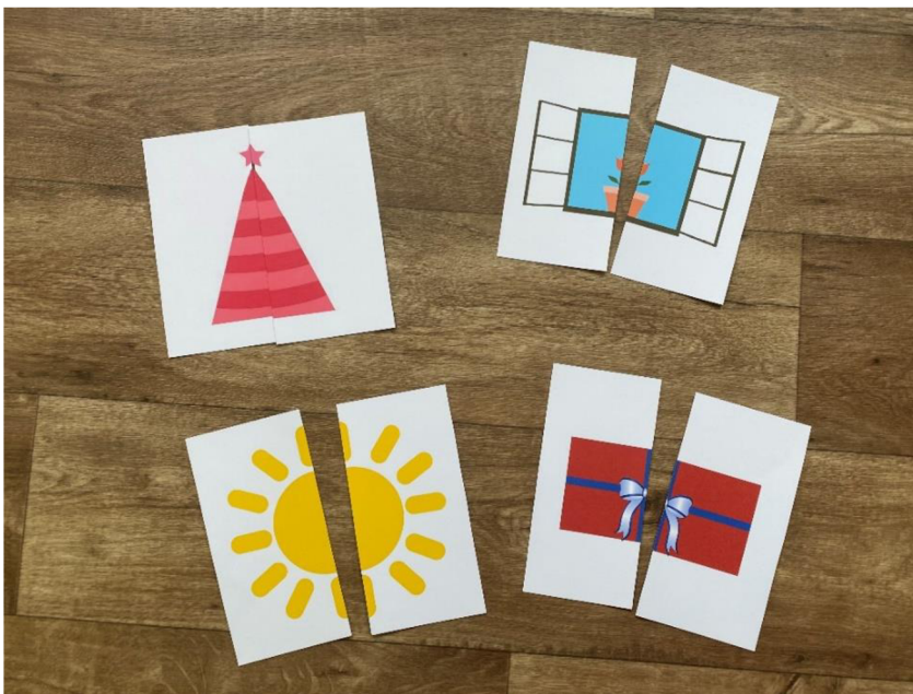
Obrázek 8 Puzzle