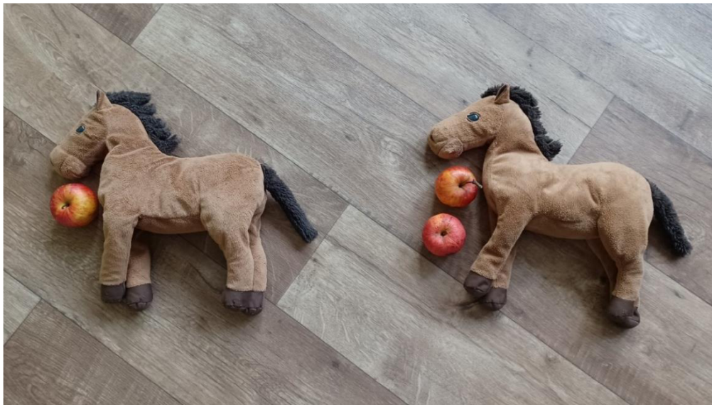
Obrázek 10 Usuzování – koně