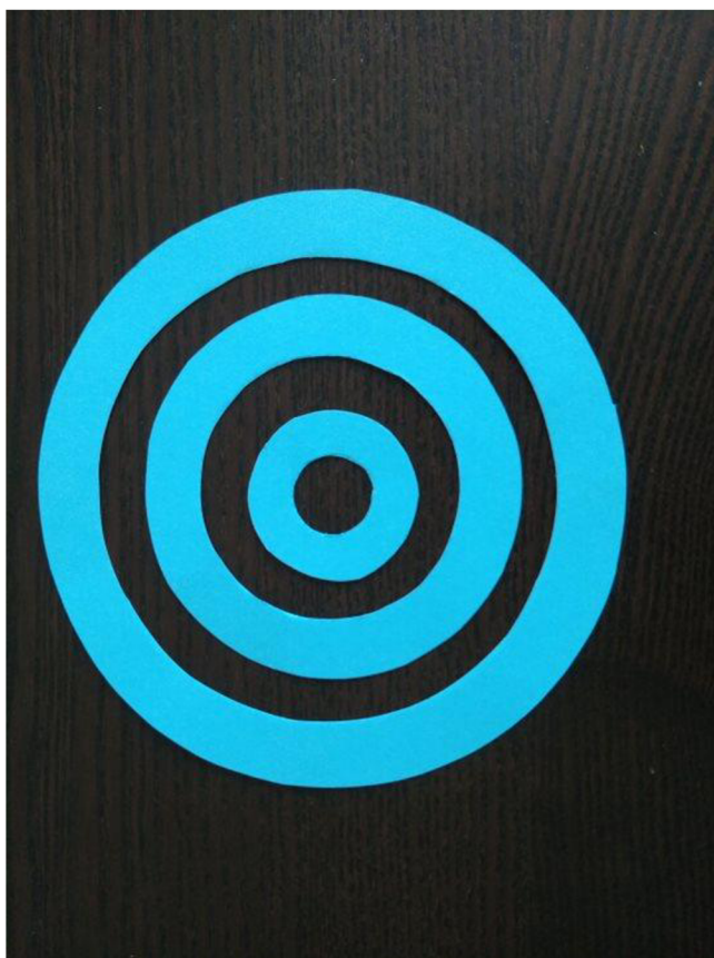
Obrázek 6 Dešťové kaluže