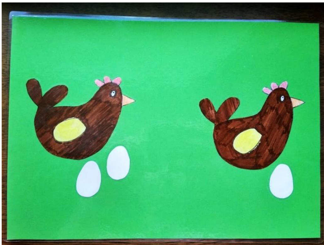
Obrázek 11 Usuzování – slepice