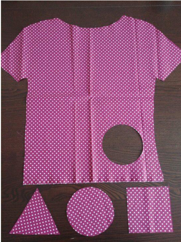
Obrázek 9 Zápata