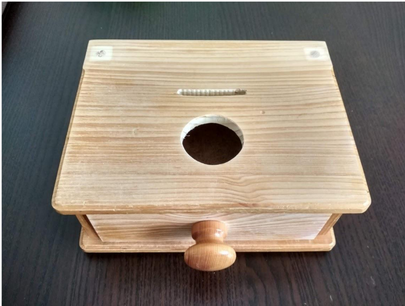
Obrázek 1 Montessori šuplíček