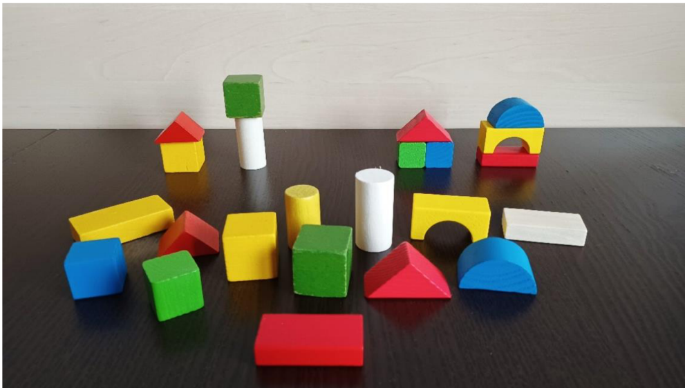
Obrázek 6 3D stavby