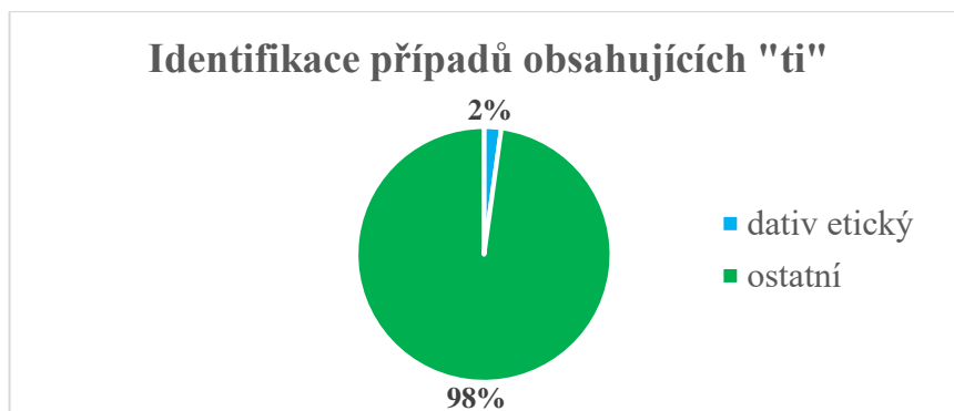
Graf 2: Identifikace případů, které obsahují slovní tvar "ti"

Věty se slovesem být lze vidět na příkladu (7), věty se slovesem mít jsou znázorněny na příkladu (8). Z pohledu sémantiky, sloveso být v příkladech (7) je vždy ve spojení s určitou frází, která má funkci hodnotící. Může se jednat o hodnocení vzhledu, jako tomu je ve větě (7a), hodnocení povahy (7b), hodnocení situace (7c) či (7d) a mnoho dalších. Ve všech případech se potvrzuje pravidlo, že mluvčí se cítí být dějem zasažen a zároveň, všechny příklady odkazují na osobu diskurzu. V případě slovesa mít to není totožná situace. Zde se jedná buď o vztah vlastnický – viz příklad (8d), kde autor odkazuje na fyzický předmět, nebo o výraz, který je nějak spojený s pocitem či myslí člověka – viz (8a), (8b) a (8c). Všechny příklady obsáhlé v (7) a (8) jsou specifickým druhem dativu, a to dativem kontaktovým.