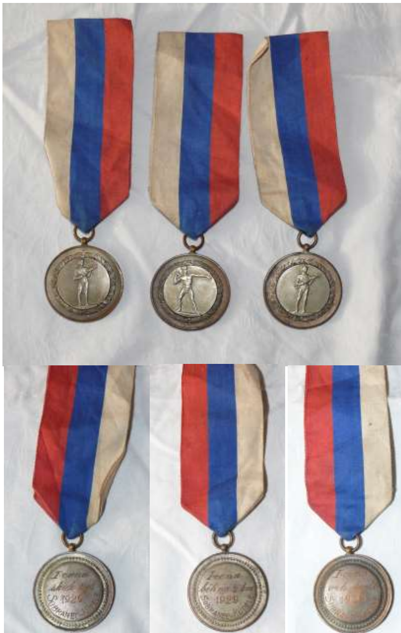
Příloha č. 1: Sbíрка medailí z disciplín vrh koulí, skok vysoký a běh na 2 km ze Sobranců 1929