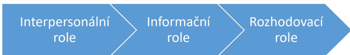
Obrázek 1: Manažerské role dle H. Mintzberga

na nepředvídatelné situace a přijímat opatření k jejich řešení. V roli alokaci zdrojů užívá manažer své autority k rozdělování zdrojů jako jsou finanční prostředky, čas, zaměstnanci či zásoby. Manažer má klíčovou roli v rozhodování o organizaci práce, přičemž vykonává kontrolu tím, že schvaluje klíčová rozhodnutí dříve, než jsou prakticky provedena. Poslední roli tvoří role jednatele, která se uplatňuje při jednáních s jednotlivci nebo organizacemi, například při podepisování nových smluv. Role jednatele se opírá o autoritu, důvěryhodnost, přístup k informacím a odpovědnost za rozdělování zdrojů (Cejthamr & Dědina, 2010). Tyto tři manažerské role znázorňuje obrázek 1.