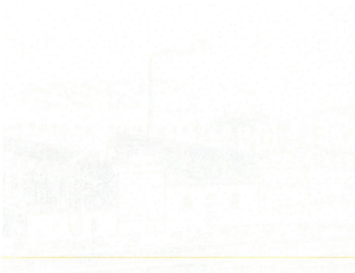
(Výrobní skupina Aroma & Aroco, 2016)