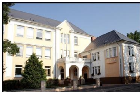
Obrázek 3 Masarykova základní škola