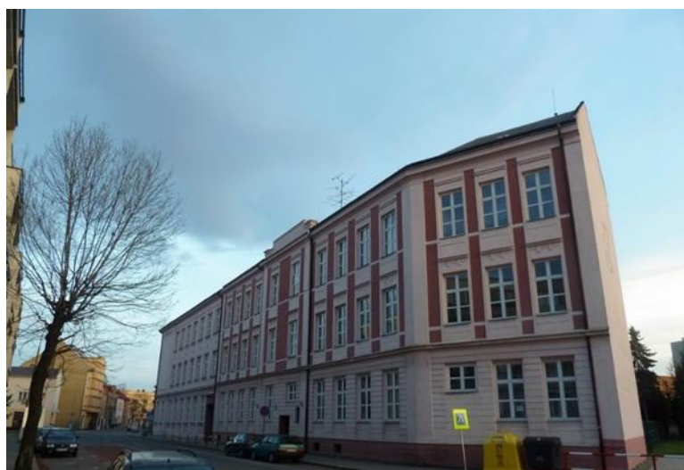
Obrázek 4 Základní škola a mateřská škola tř. Dr. E. Beneše