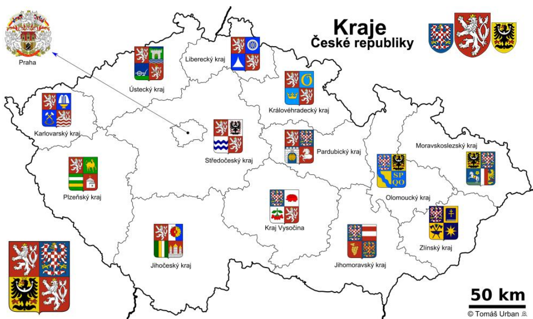
Obrázek č. 3: Mapa České republiky: Přehled krajů a jejich znaky

Jihočeský kraj, který byl do 30. května 2001 krajem Budějovickým, sousedí se Středočeským, Plzeňským, Jihomoravským krajem a krajem Vysočina. Jihočeský kraj se podílí svou rozlohou 10 058 km 2 , tedy necelými 13 % na ploše České republiky s počtem obyvatel 637 047. Kraj je rozdělen na 7 okresů (České Budějovice, Český Krumlov, Jindřichův Hradec, Písek, Prachatice, Strakonice a Tábor). V tomto kraji bylo zřízeno 17 správních obvodů obcí s rozšířenou působností a 37 správních obvodů obcí s pověřeným úřadem. Krajským městem jsou České Budějovice. 108