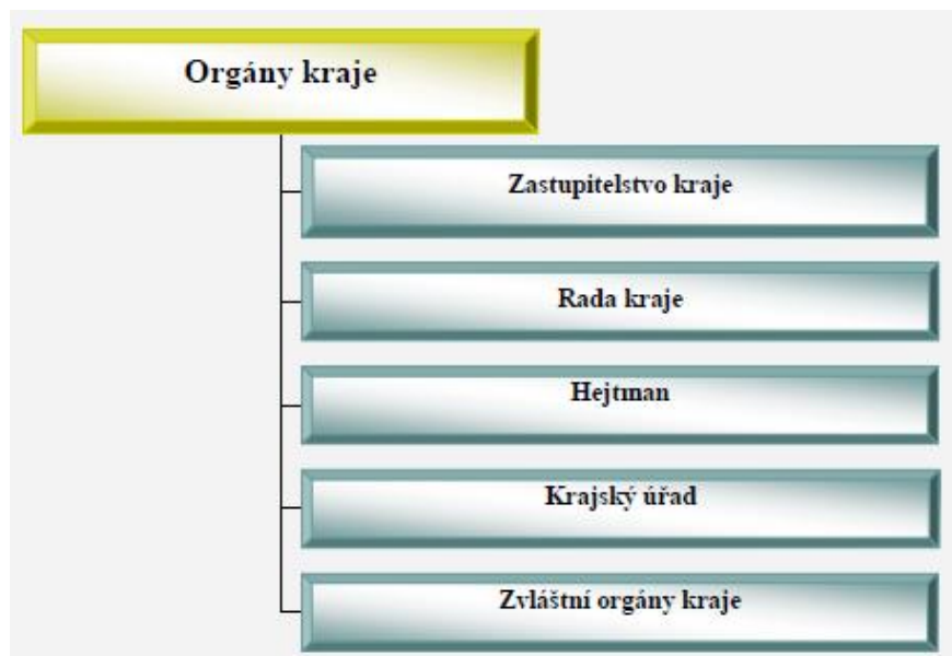
Obrázek č. 2: Orgány kraje

Systém místní správy v České republice spadá do oblasti kontinentálního systému a uplatňuje model správy na úrovni obcí a krajů, kdy kraje mimo své samosprávné funkce zabezpečují i část výkonu státní správy, který na ně byl přenesen (viz kapitola 3.2.1a 3.2.2 samostatná a přenesená působnost). Místní státní správa musí splňovat požadavek organizační a funkční jednoty státní správy. 67 V následující části budou jednotlivě přiblíženy jednotlivé orgány kraje.