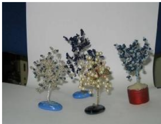
Obr. 17: Konečné výrobky obviněných