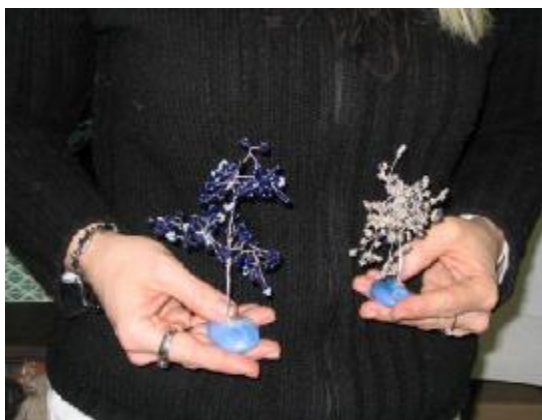
Obr. 16: Ukázky práce obviněných