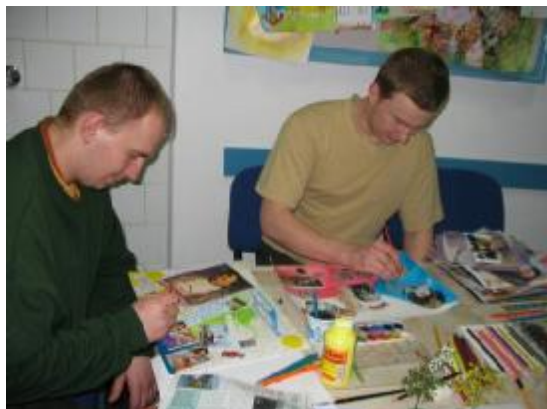
Obr. 9: Obvinění zleva Z. K (20 let) a L. F. (23 let), koláž na téma „Hodnoty a přátelství“