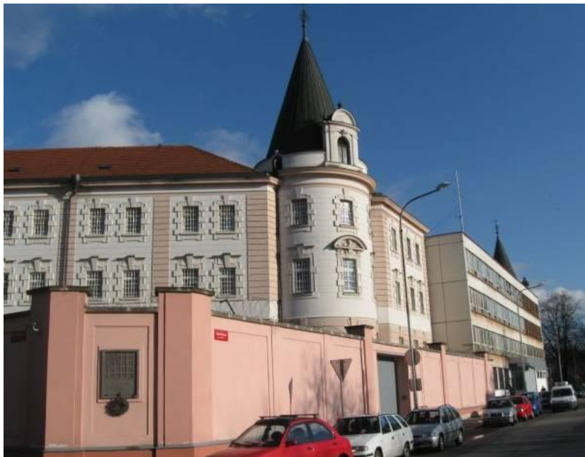
Obr. 1: Pohled na historickou budovu Vazební věznice