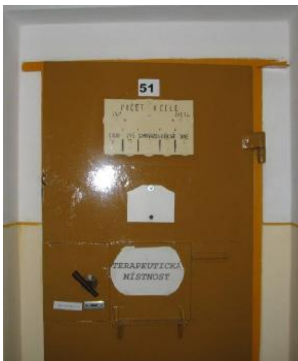
Obr. 2: Vchod do terapeutické místnosti ve Vazební věznici v Českých Budějovicích