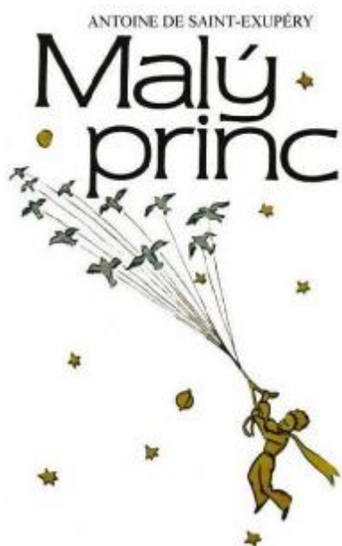
Obr. 18: Obálka románu