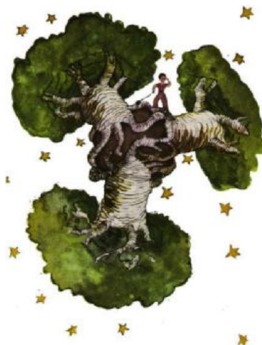
Obr. 20: Baobaby