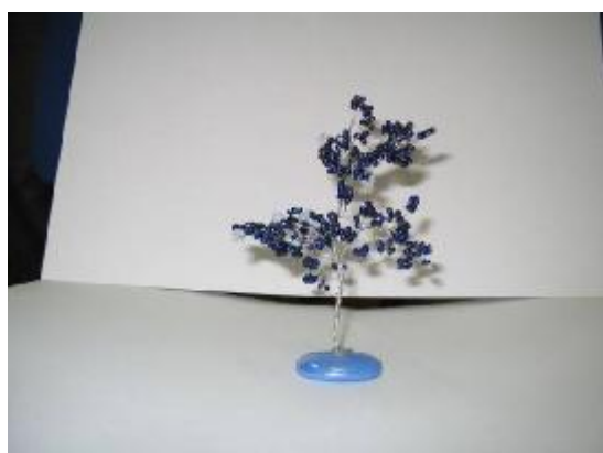
Obr. 15: Ukázka práce L. F. (23 let)