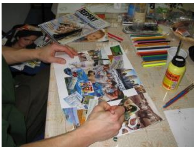
Obr. 4: Obviněný P. S. (26 let) dokončuje koláž na téma „Představ planetu Zemi“