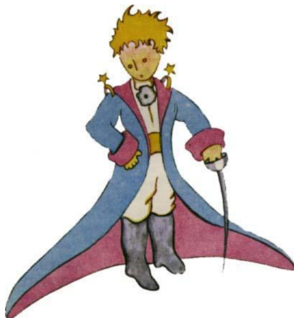
Obr. 19: Malý princ