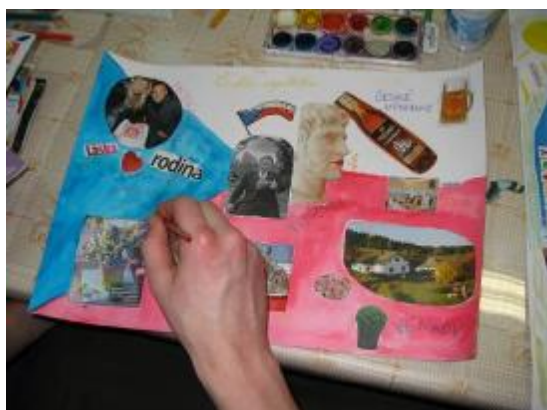
Obr. 11: Koláž na téma „Česká republika“