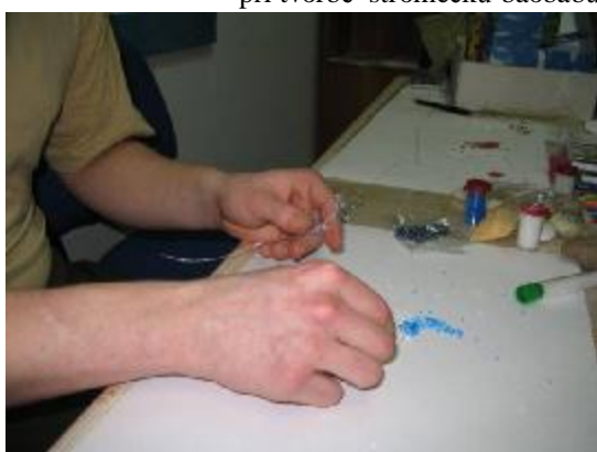
Obr. 14: Výroba stromečku Z. K. (20 let)