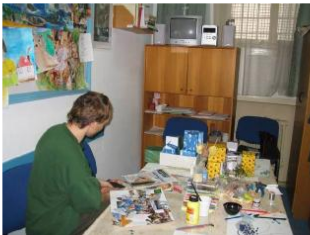
Obr. 3: Obviněný P. S. (26 let)