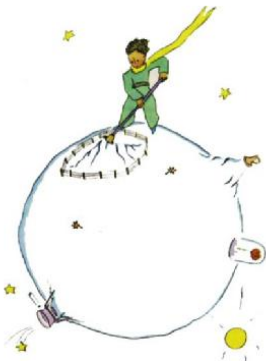
Obr. 20: Planetka Malého prince