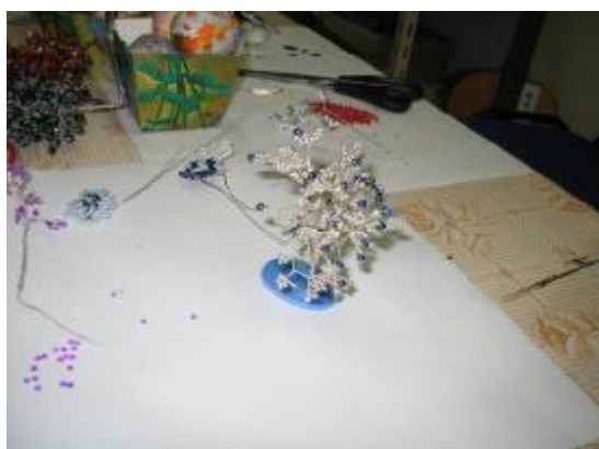
Obr. 13: Ukázka práce Z. K. (20 let)