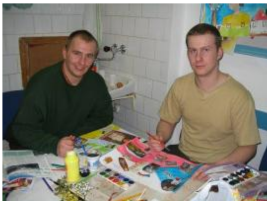
Obr. 8: Obvinění zleva Z. K (20 let) a L. F. (23 let), koláž na téma „Česká republika“