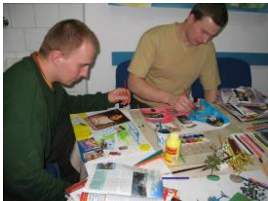
Obr. 7: Obvinění zleva Z. K (20 let) a L. F. (23 let) při tvorbě koláže