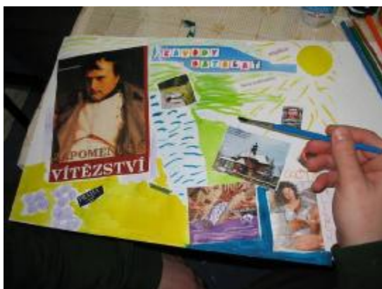
Obr. 10: Koláž na téma „Hodnoty a přátelství“